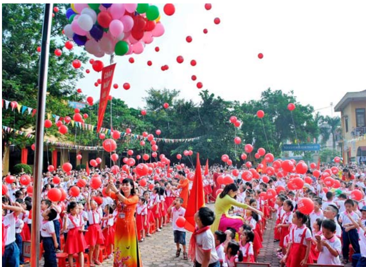
Thầy và trò Trường Tiểu học Đội Cấn trong ngày khai giảng năm học mới (2015 - 2016).