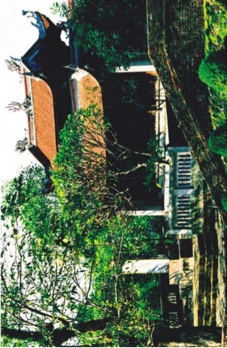
Đền thờ Đội Cấn (Di tích lịch sử xếp hạng cấp Tỉnh năm 1997)