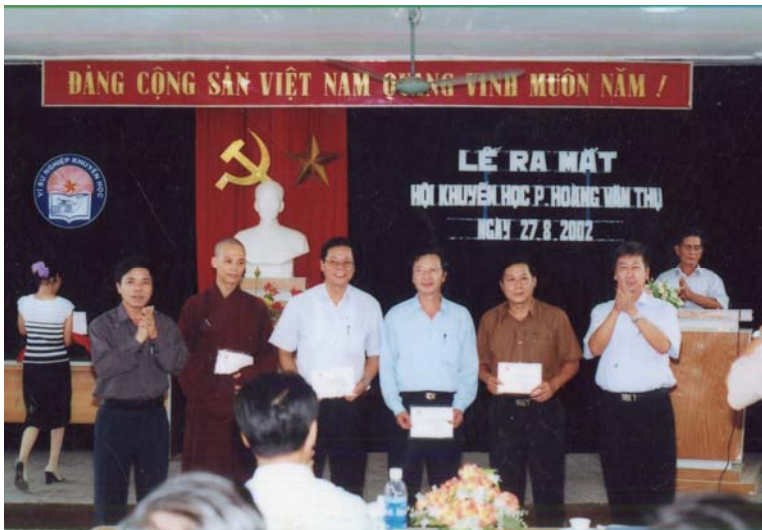
Lễ ra mắt Hội Khuyến học phường (năm 2002).