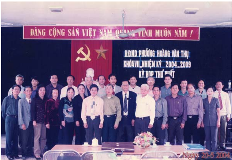
Các đại biểu dự kì họp thứ nhất Hội đồng nhân dân phường khóa VII - nhiệm kì 2004-2009 (20/5/2004).