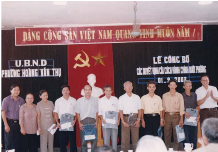
Lễ Công bố các quyết định cải cách hành chính của Ủy ban nhân dân phường Hoàng Văn Thụ (1/9/2003).