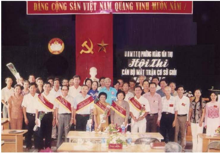
Ủy ban Mặt trận Tổ quốc phường tổ chức Hội thi Cán bộ Mặt trận cơ sở giới (2005).