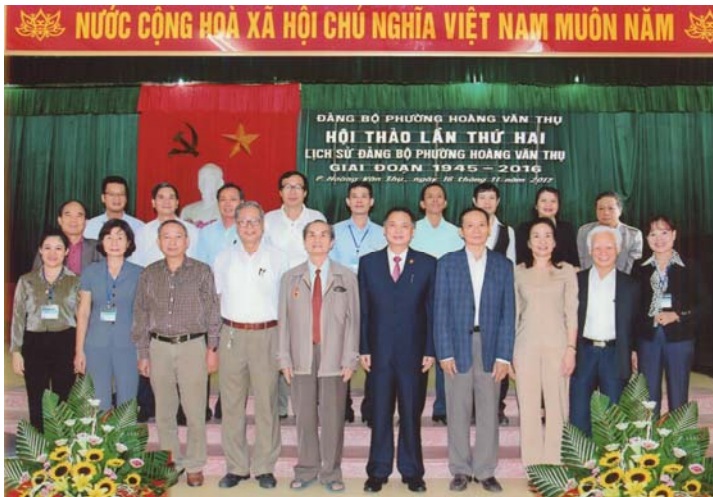
Một số đại biểu tham dự Hội thảo khoa học Bản thảo lần thứ hai Lịch sử Đảng bộ phường Hoàng Văn Thụ (16/11/2017).