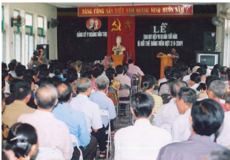
Toàn cảnh Lễ trao Huy hiệu Đảng viên 40 năm, 50 năm tuổi Đảng và đổi Thẻ Đảng viên đợt 2/9/2004 do Đảng ủy phường tổ chức (2004).