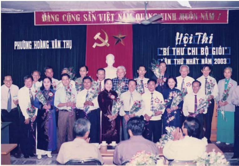
Các thí sinh tham dự Hội thi Bí thư Chi bộ giỏi phường lần thứ nhất do Đảng ủy phường tổ chức (2003).