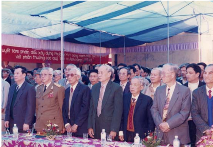
Các đại biểu tham dự Lễ mừng công, đón nhận danh hiệu Anh hùng Lực lượng vũ trang nhân dân