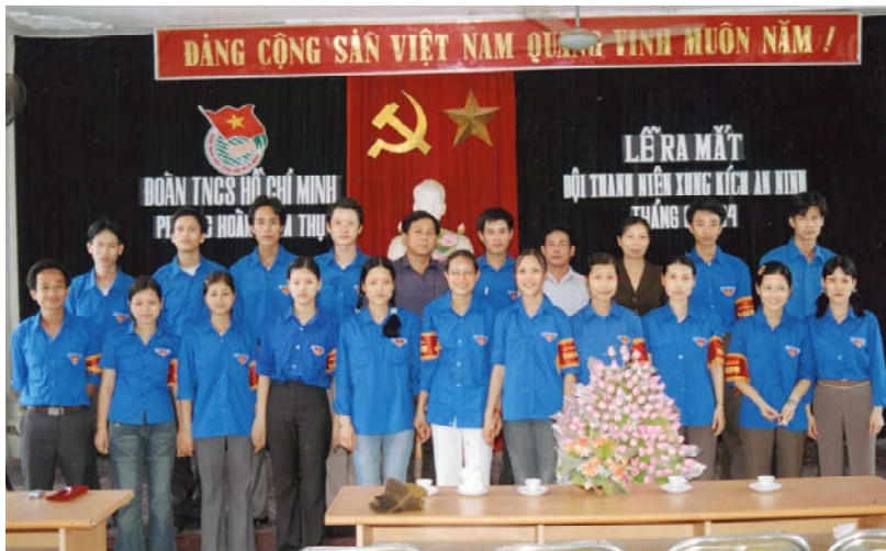
Lễ ra mắt Đội Thanh niên xung kích an ninh phường (năm 2004)