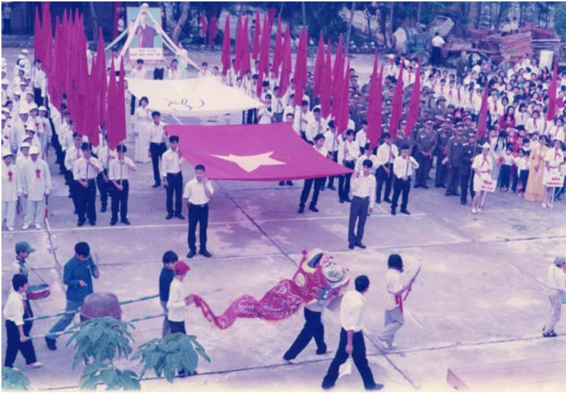
Toàn cảnh Đại hội Thể dục – Thể thao phường lần thứ nhất (2001).