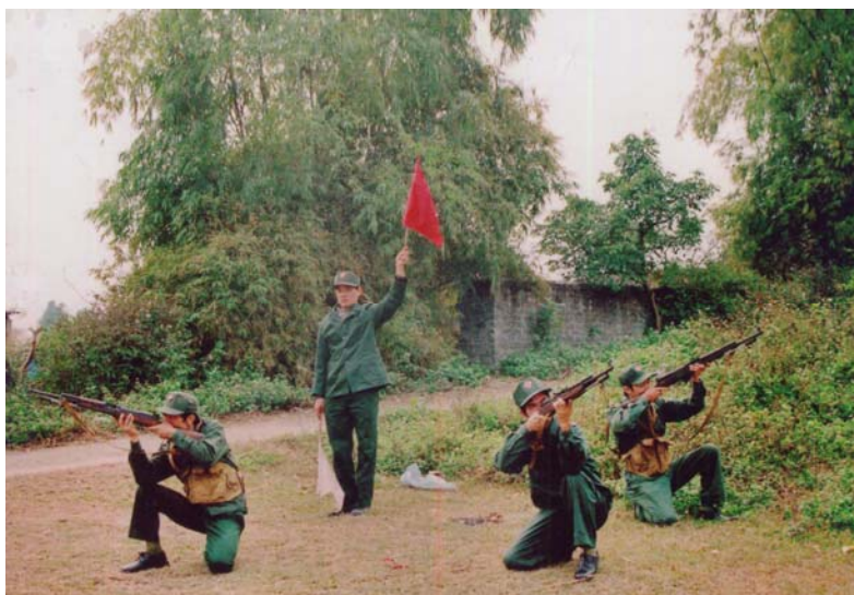
Lực lượng dân quân phường luyện tập bắn máy bay bay thấp bằng súng bộ binh (2010)