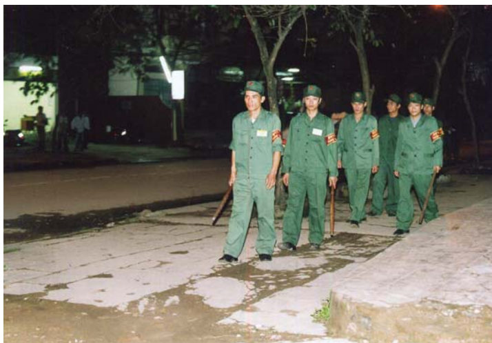
Lực lượng bảo vệ an ninh, trật tự phường tuần tra trên địa bàn (2015)