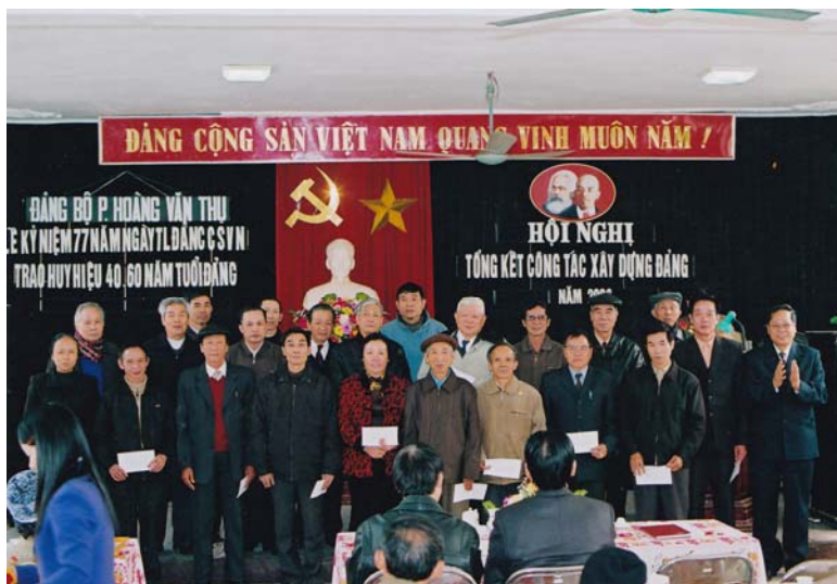
Đảng bộ phường Hoàng Văn Thụ tổ chức Lễ Kỷ niệm 77 năm ngày thành lập Đảng, Trao Huy hiệu 40 năm, 60 năm tuổi Đảng và Tổng kết công tác xây dựng Đảng năm 2006 (năm 2007).