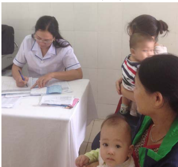
Trạm Y tế phường được Ủy ban nhân dân tỉnh Thái Nguyên công nhận đạt chuẩn quốc gia về Y tế từ năm 2005 (2017)