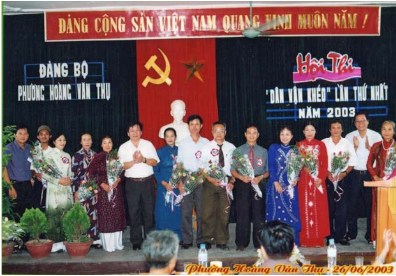
Đảng ủy phường tổ chức Hội thi Dân vận khéo lần thứ nhất năm 2003, (26/6/2003).