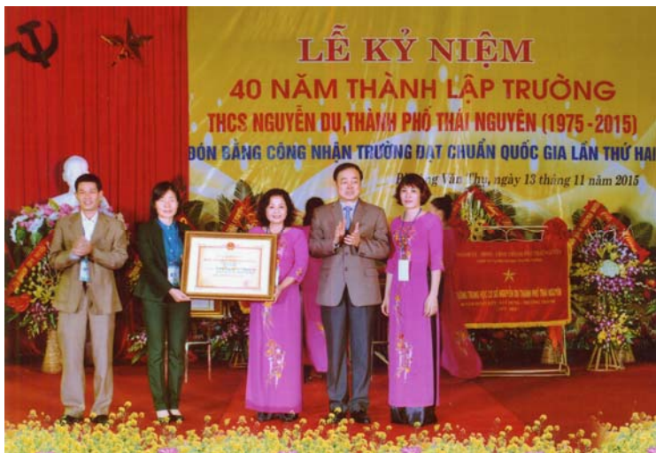
Thầy và trò Trường Trung học cơ sở Nguyễn Du vinh dự được đón nhận Bằng Công nhận Trường đạt chuẩn quốc gia lần thứ Hai (13/11/2015).