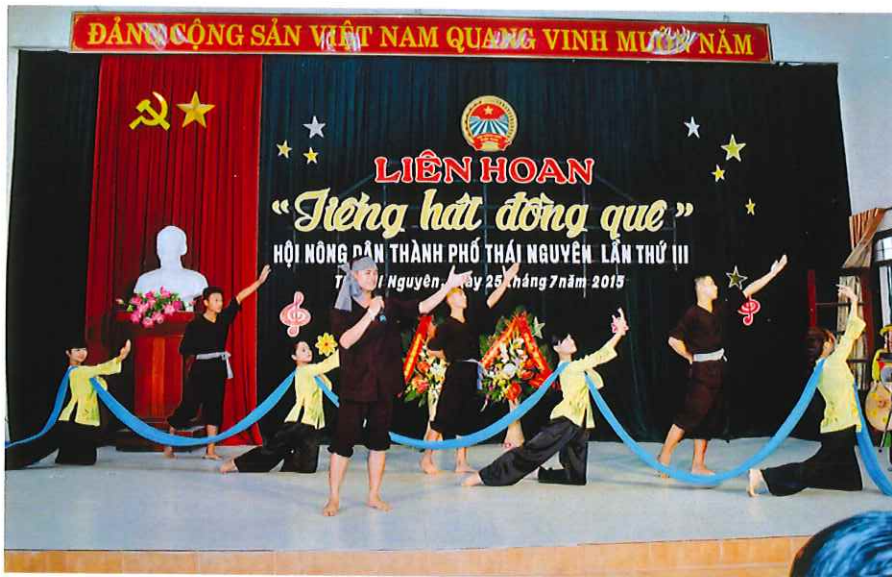
Liên hoan "Tiếng hát đồng quê" Hội nông dân thành phố Thái Nguyên lần thứ III năm 2015