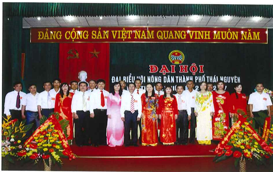
BCH Hội Nông dân thành phố Thái Nguyên khóa IX, nhiệm kỳ 2012-2018