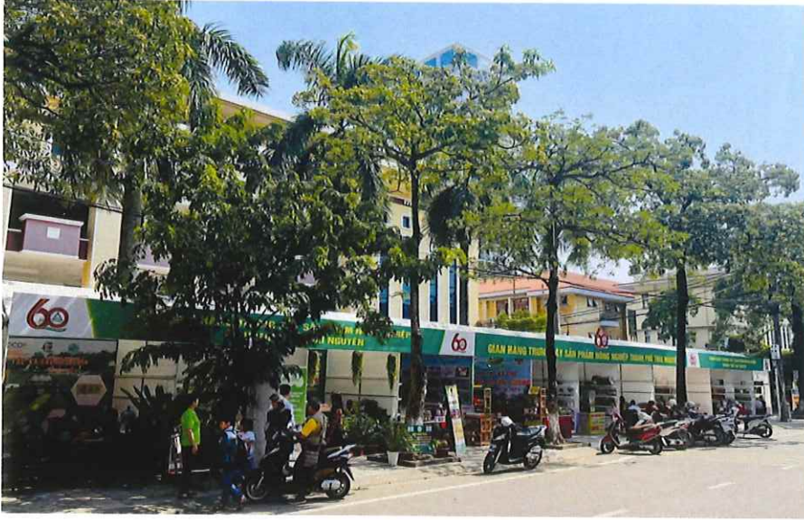
Gian hàng trưng bày sản phẩm nông nghiệp thành phố Thái Nguyên chào mừng kỷ niệm 60 năm ngày thành lập thành phố (19/10/1962 - 19/10/2022)