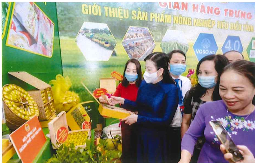
Đ/c Nguyễn Thanh Hải - Ủy viên BCH TW Đảng, Bí thư Tỉnh ủy, Trưởng đoàn đại biểu Quốc Hội Tỉnh Thái Nguyên tham quan gian trưng bày Sản phẩm nông nghiệp tiêu biểu thành phố Thái Nguyên năm 2021