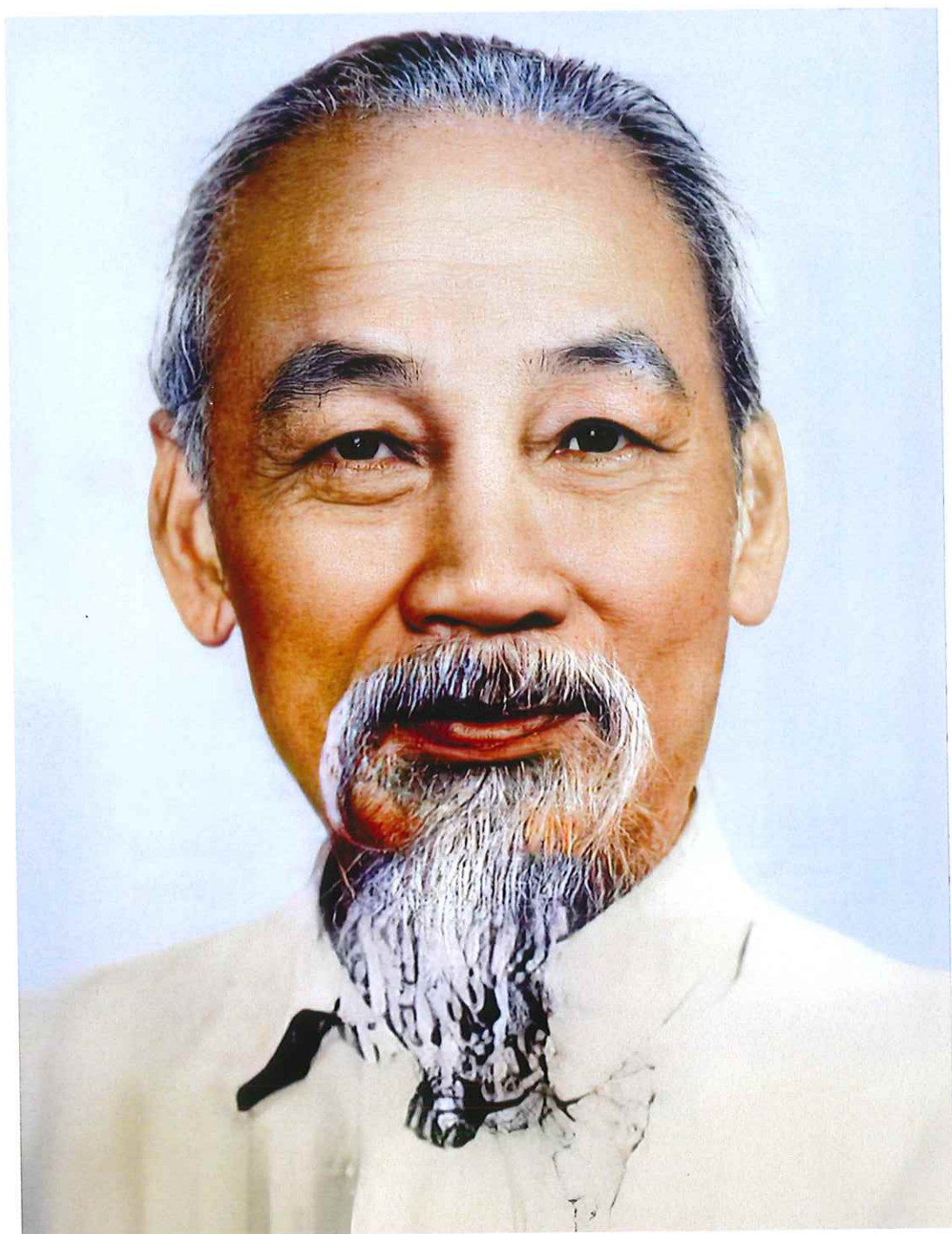
CHỦ TỊCH HỒ CHÍ MINH (1890 - 1969)