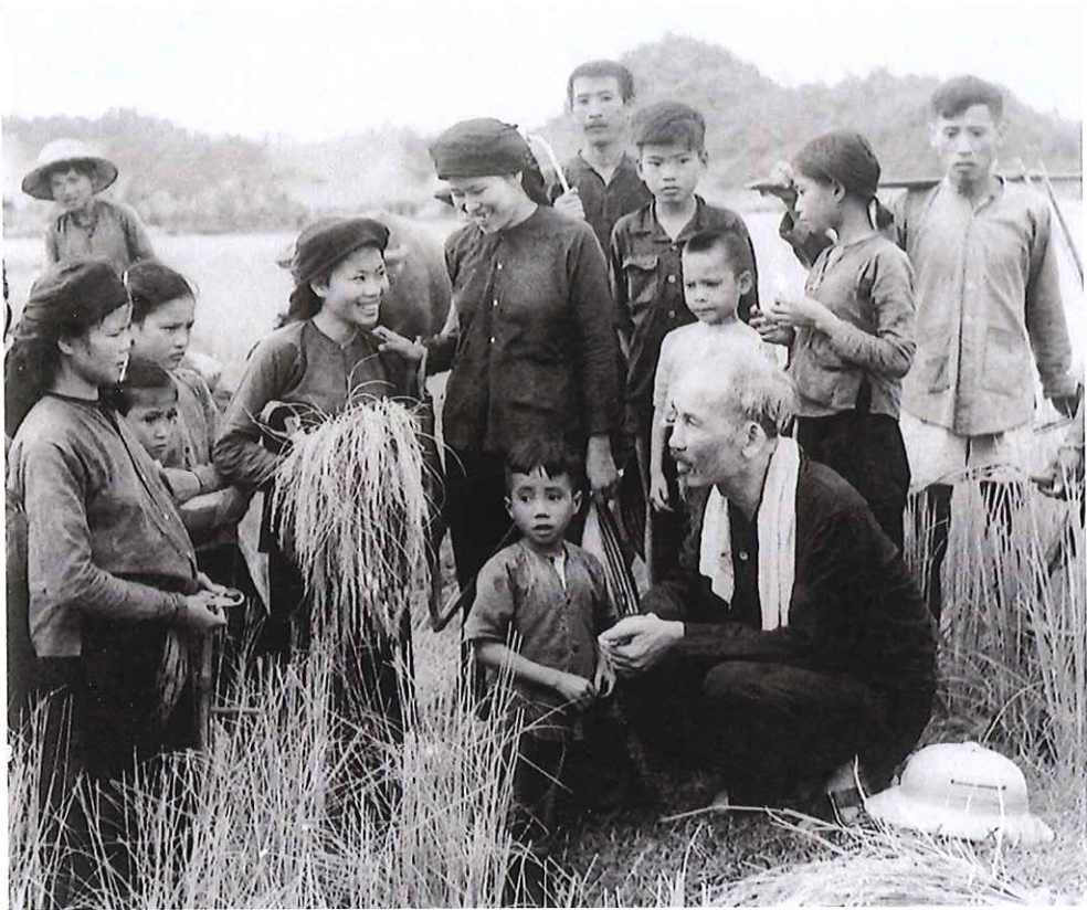
Bác Hồ thăm bà con nông dân Thái Nguyên năm 1954