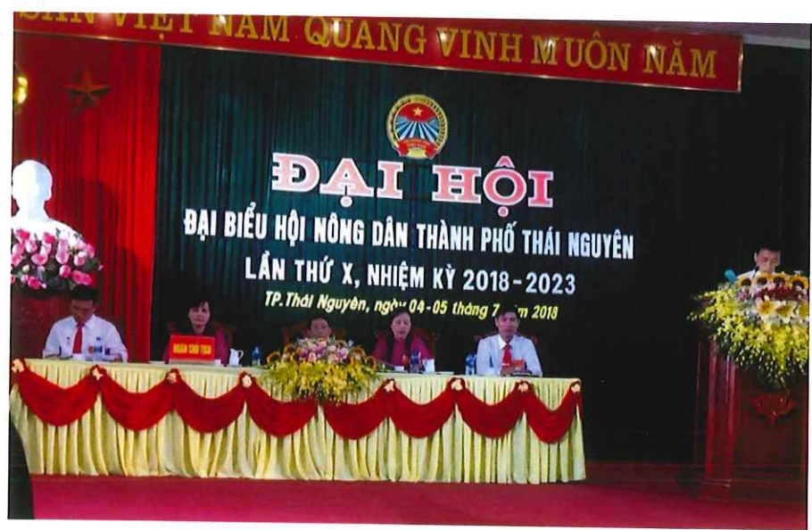
Đại hội đại biểu Hội Nông dân thành phố Thái Nguyên lần thứ X nhiệm kỳ 2018 - 2023