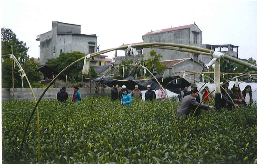
Hội Nông dân thành phố triển khai dự án trồng hoa chất lượng cao tại phường Túc Duyên năm 2012