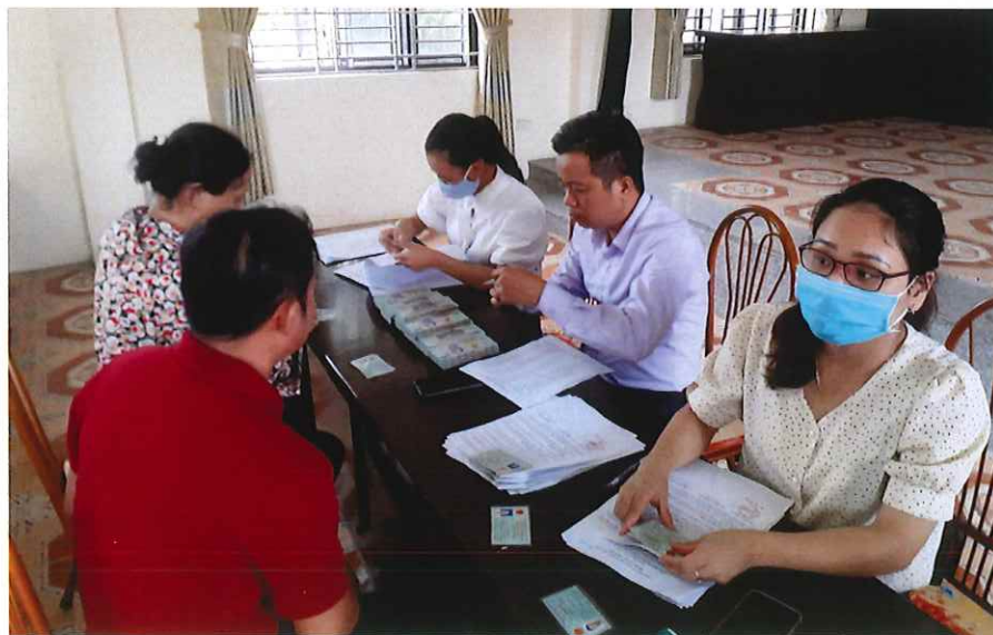
Giải ngân Quỹ Hỗ trợ nông dân giúp nông dân có vốn phát triển sản xuất kinh doanh tại Thịnh Đức năm 2020