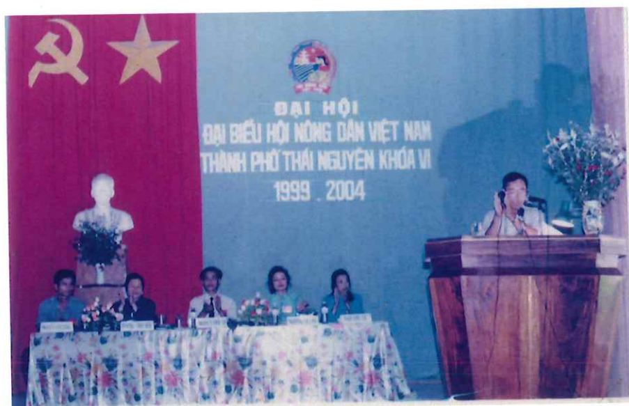
Đại hội đại biểu Hội Nông dân Việt Nam thành phố Thái Nguyên lần thứ VI nhiệm kỳ 1999 - 2004