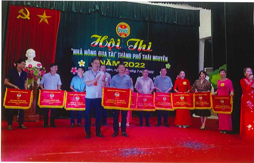
Hội thi "Nhà nông đua tài" thành phố Thái Nguyên chào mừng kỷ niệm 92 năm Ngày thành lập Hội Nông dân Việt Nam (14/10/1930 - 14/10/2022) 60 năm ngày thành lập thành phố (19/10/1962 - 19/10/2022)