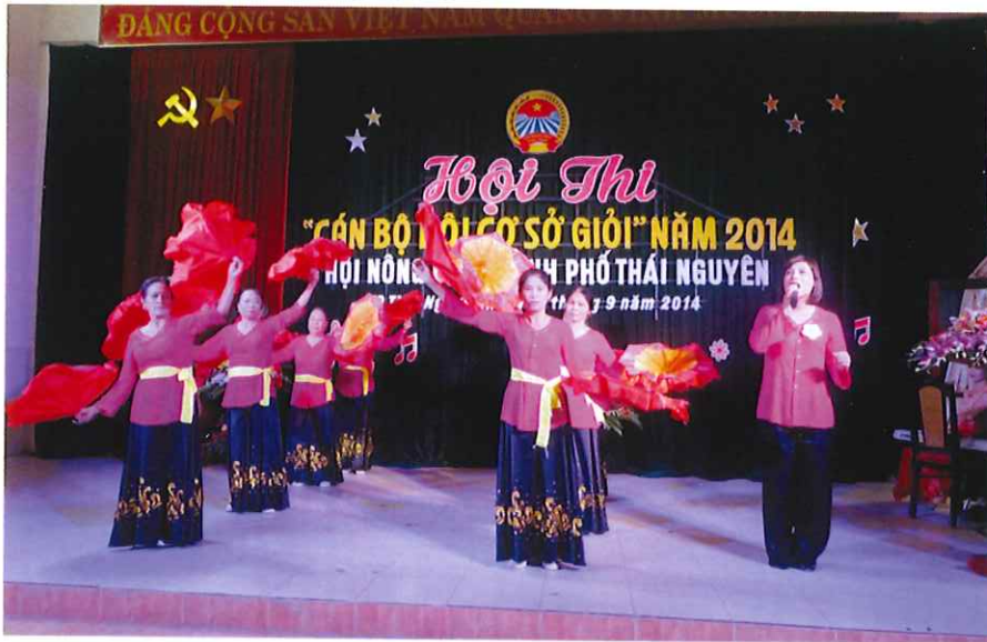
Hội thi cán bộ cơ sở giỏi năm 2014