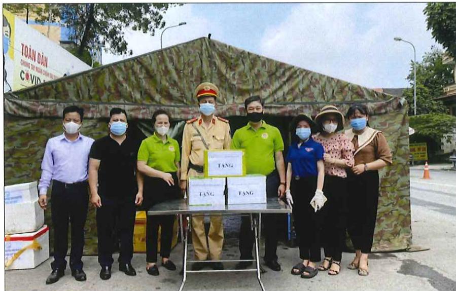
Tặng quà cho các chốt phòng dịch Covid - 19 năm 2021