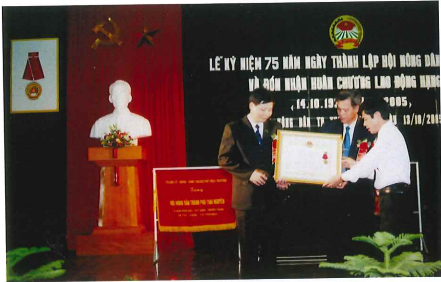
Lễ kỷ niệm 75 năm thành lập Hội Nông dân Việt Nam (14/10/1930 - 14/10/2005) và đón nhận Huân chương Lao động hạng Ba