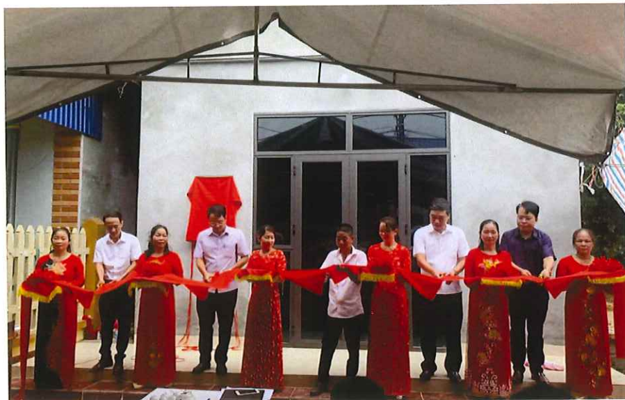
Bàn giao Mái ấm nông dân cho hội viên nghèo Cam Giá nhân kỷ niệm 90 năm ngày thành lập Hội Nông dân Việt Nam (14/10/1930 - 14/10/2020)