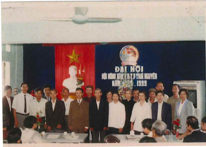
Ban Chấp hành Hội Nông dân thành phố Thái Nguyên khóa V nhiệm kỳ 1994 - 1999