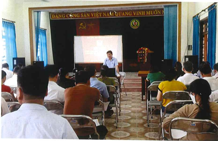
Bồi dưỡng nâng cao kỹ năng cho cán bộ Hội cơ sở về Công tác hỗ trợ, trợ giúp pháp lý cho hội viên, nông dân năm 2013