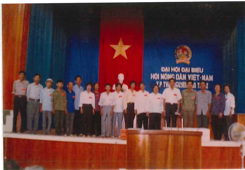
BCH Hội Nông dân thành phố Thái Nguyên khóa VI, nhiệm kỳ 1999-2004