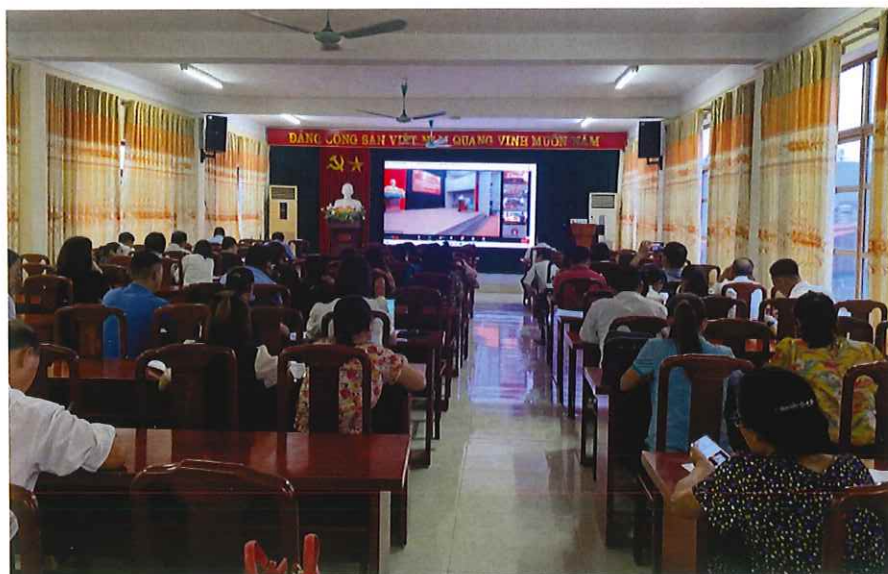
Tập huấn nghiệp vụ công tác hội và phong trào nông dân năm 2022