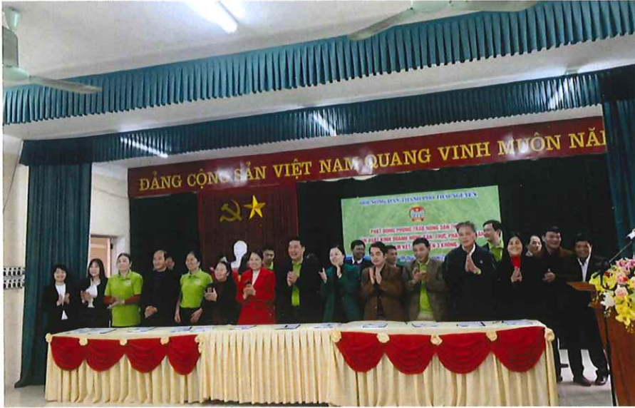
Phát động ký cam kết thực hiện “3 không” trong sản xuất, kinh doanh, tiêu thụ sản phẩm nông nghiệp năm 2020