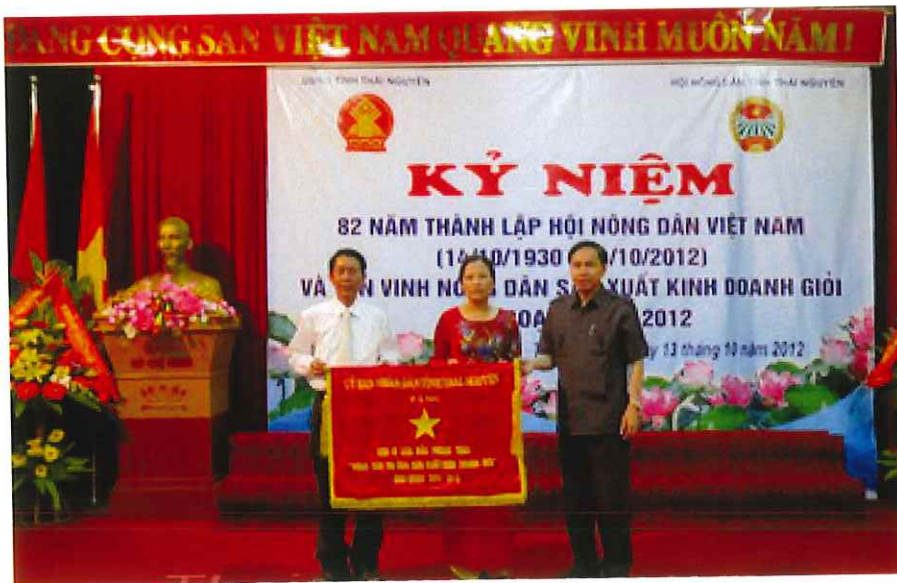
Đồng chí Dương Ngọc Long - Phó bí thư Tỉnh ủy, Chủ tịch UBND tỉnh Thái Nguyên tặng Cờ thi đua xuất sắc cho Hội Nông dân thành phố Thái Nguyên năm 2012