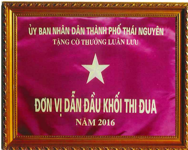
Cờ thường luân lưu của Ủy ban nhân dân Thành phố tặng Đơn vị dẫn đầu khối thi đua năm 2016