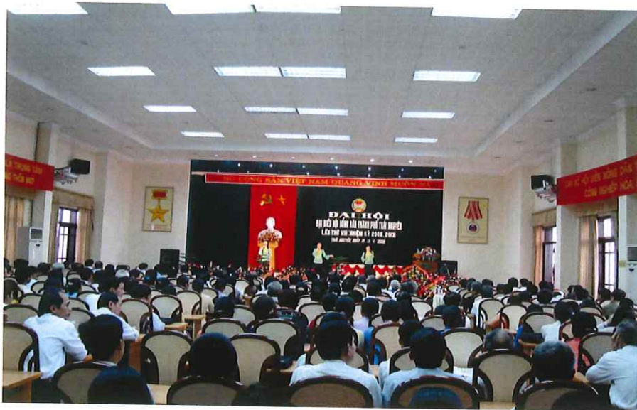
Đại hội đại biểu Hội Nông dân thành phố Thái Nguyên lần thứ VIII nhiệm kỳ 2008 - 2013