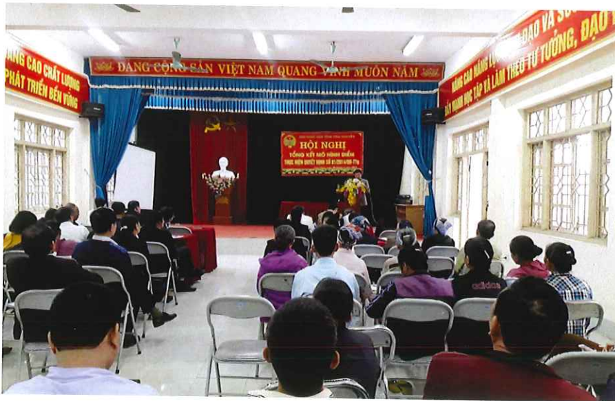
Tổng kết mô hình điểm thực hiện quyết định số 81/2014/QĐ-TTg tại Cao Ngạn năm 2019