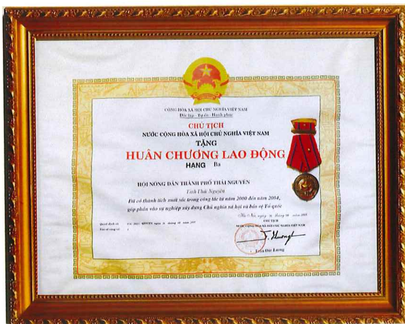
Huân chương Lao động hạng Ba (năm 2005)