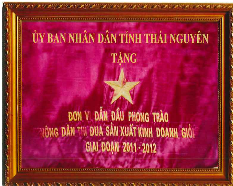
Cờ của Ủy ban nhân dân tỉnh tặng Đơn vị dẫn đầu phong trào Nông dân thi đua sản xuất kinh doanh giỏi giai đoạn 2011 - 2012