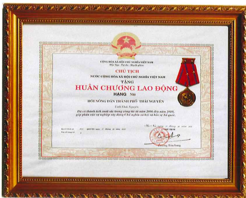
Huân chương Lao động hạng Nhì (năm 2011)