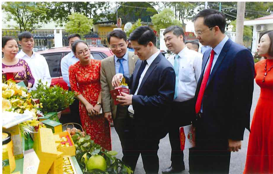
Các đ/c lãnh đạo TW Hội, Tỉnh Hội thăm quan gian trưng bày sản phẩm nông nghiệp tiêu biểu của thành phố năm 2020