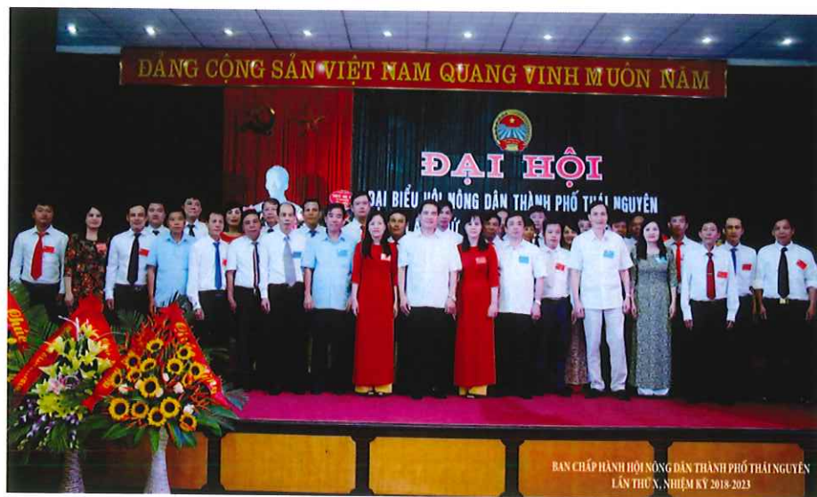
Ban Chấp hành Hội Nông dân thành phố Thái Nguyên khóa X nhiệm kỳ 2018 - 2023