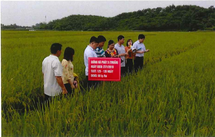
Hội thảo đầu bờ đánh giá mô hình giống lúa mới tại xã Thịnh Đức năm 2021