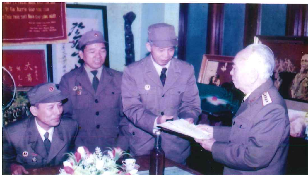
Lãnh đạo Hội Cựu chiến binh Thành phố chúc thọ Đại tướng Võ Nguyên Giáp (năm 1995)