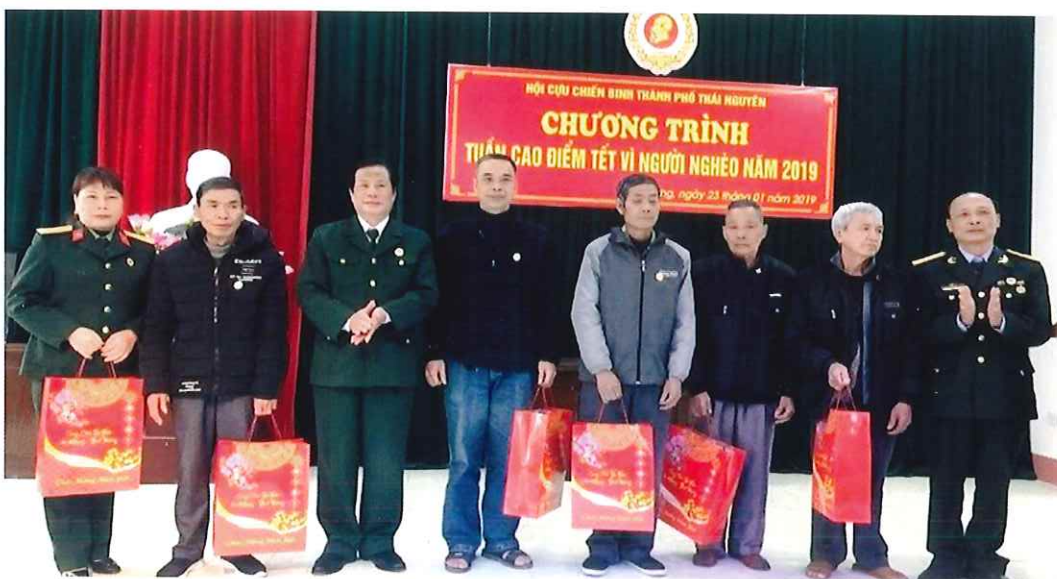
Hội Cựu chiến binh Thành phố trao quà cho hội viên có hoàn cảnh khó khăn trong "Tuần cao điểm Tết vì người nghèo năm 2019"