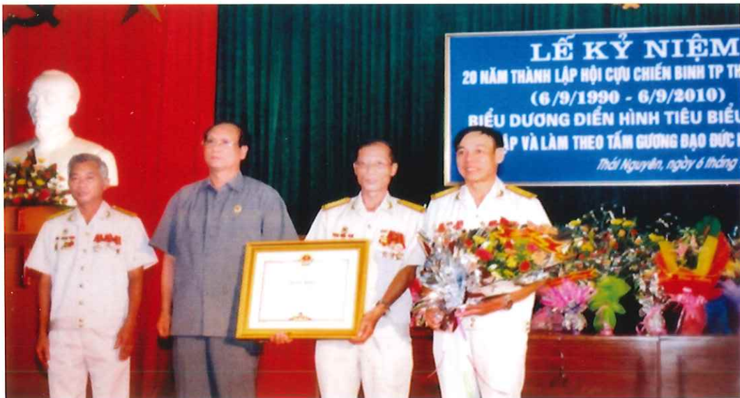
Đồng chí Dương Vương Thử, Ủy viên Ban Thường vụ Tỉnh ủy, nguyên Bí thư Thành ủy Thái Nguyên trao Bằng khen của Thủ tướng Chính phủ cho Hội Cựu chiến binh Thành phố (năm 2010)