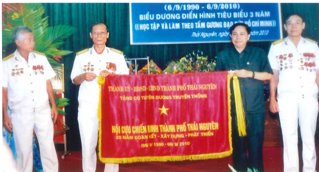
Đồng chí Dương Ngọc Long, Ủy viên Ban Chấp hành Đảng bộ tỉnh, Bí thư Thành ủy Thái Nguyên trao Cờ tuyên dương truyền thống của Thành ủy - HĐND - UBND thành phố Thái Nguyên cho Hội Cựu chiến binh Thành phố (năm 2010)