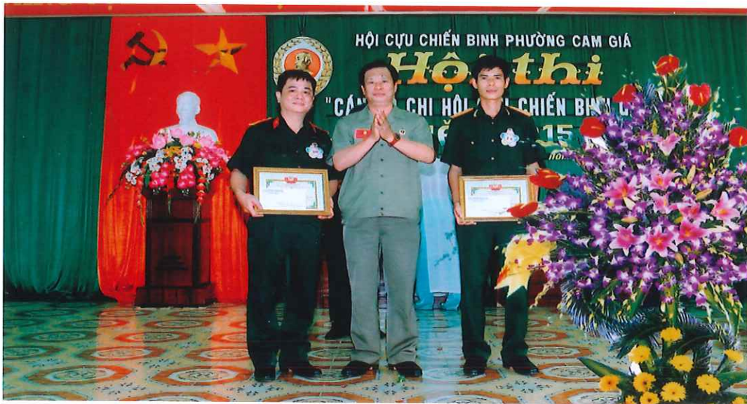
Lãnh đạo Hội Cựu chiến binh Thành phố dự và trao giải tại Hội thi Cán bộ chi hội Cựu chiến binh giỏi phường Cam Giá (năm 2015)