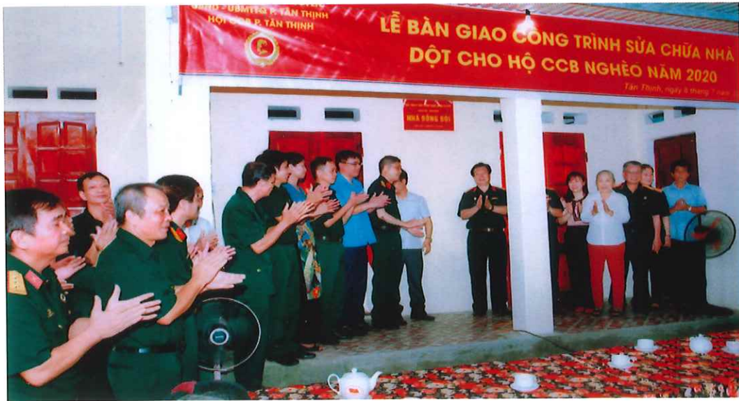
Lễ bàn giao công trình sửa chữa nhà đột cho hộ Cựu chiến binh nghèo tại phường Tân Thịnh (năm 2020)