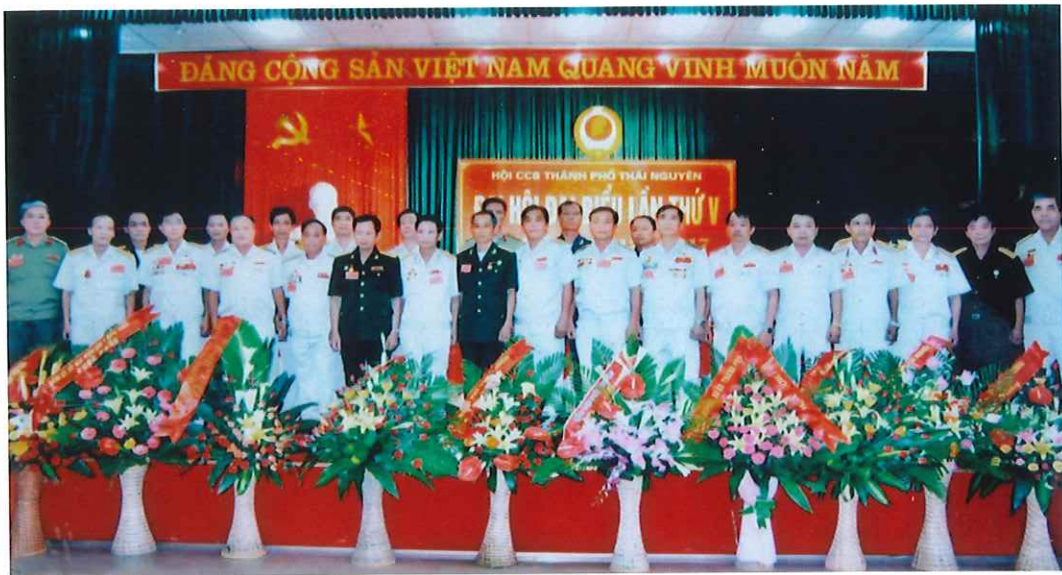
Ban Chấp hành Hội Cựu chiến binh thành phố Thái Nguyên khóa V (Nhiệm kỳ 2012 - 2017)