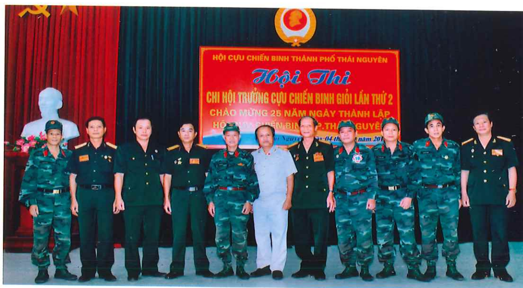
Lãnh đạo Hội Cựu chiến binh Thành phố và các cán bộ tham dự Hội thi Chi hội trưởng Cựu chiến binh giỏi cấp Thành phố lần thứ II (năm 2015)