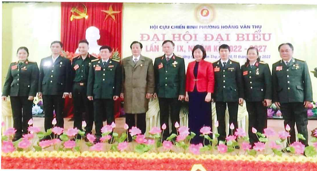
Hội Cựu chiến binh phường Hoàng Văn Thụ tổ chức Đại hội điểm khởi xã, phường nhiệm kỳ 2022-2027 thành công tốt đẹp (tháng 1/2022)