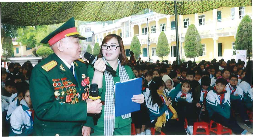
Cán bộ Hội Cựu chiến binh phường Quang Trung kể chuyện lịch sử với học sinh Trường Trung học cơ sở Quang Trung nhân kỷ niệm Ngày Chiến thắng 30 - 4 (năm 2019)