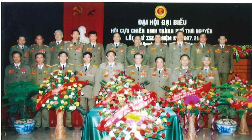
Ban Chấp hành Hội Cựu chiến binh thành phố Thái Nguyên khóa IV (Nhiệm kỳ 2007 - 2012)