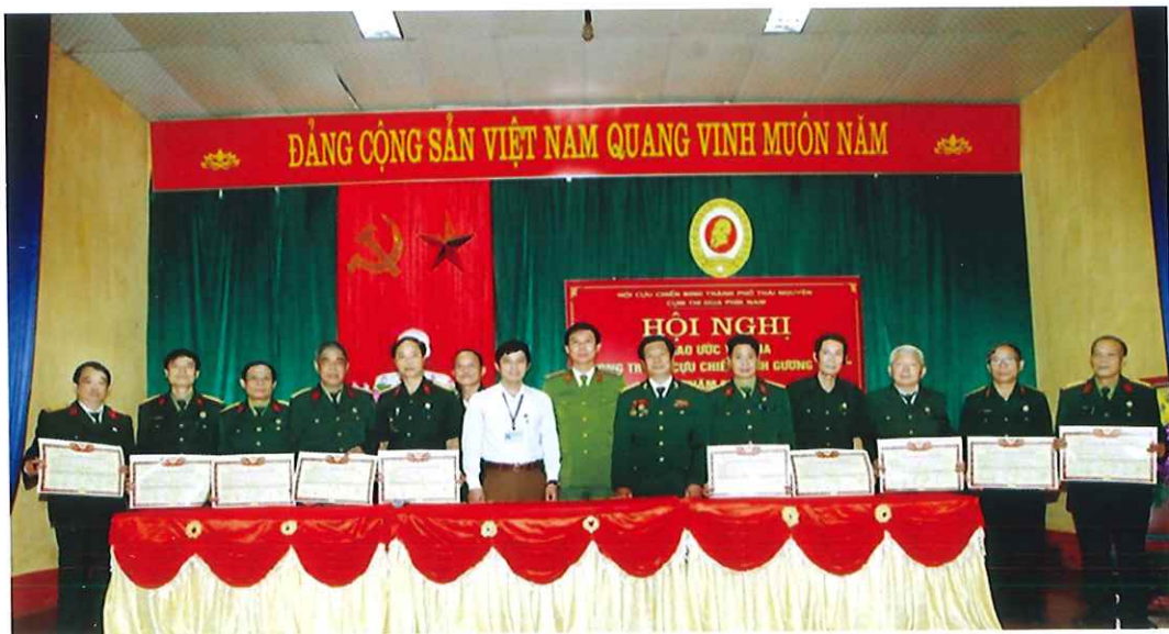
Cụm thi đua phía Nam ký kết giao ước thi đua phong trào "Cựu chiến binh gương mẫu" năm 2019