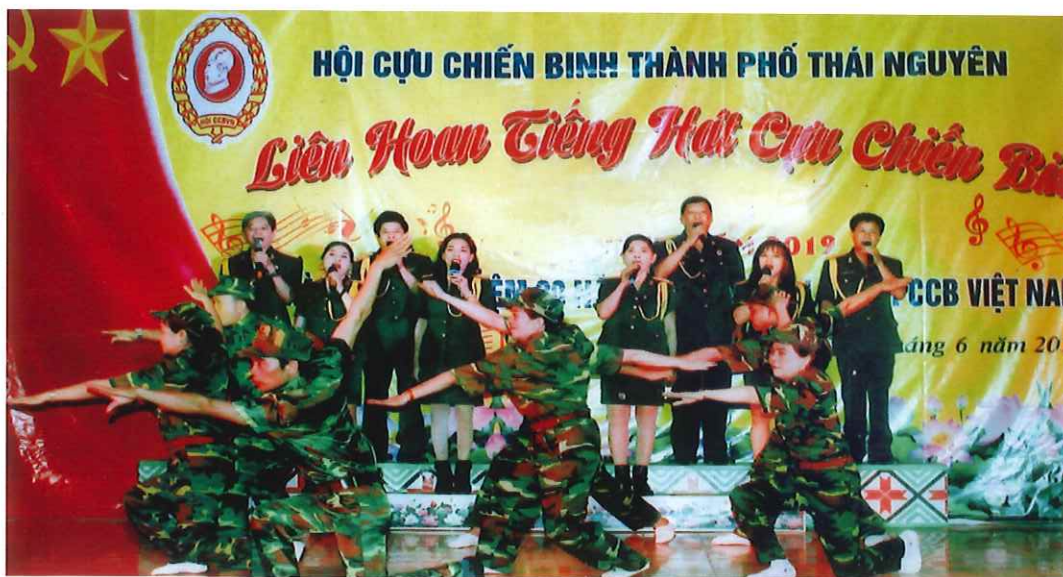
Liên hoan tiếng hát Cựu chiến binh thành phố Thái Nguyên (năm 2019)