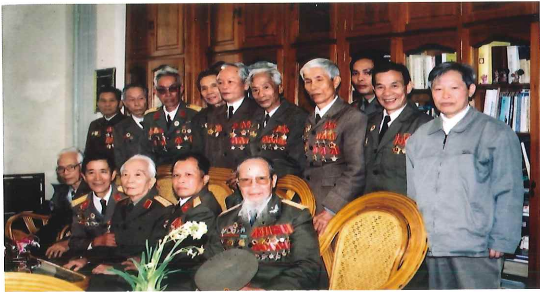
Ban liên lạc Chiến sĩ Điện Biên thành phố Thái Nguyên về thăm, chúc sức khỏe Đại tướng Võ Nguyên Giáp nhân dịp xuân Quý Mùi (năm 2003)