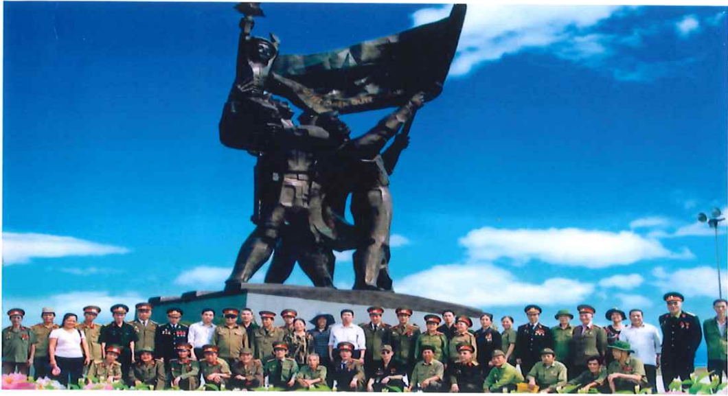
Đoàn đại biểu Hội Cựu chiến binh phường Túc Duyên thăm Tượng đài Chiến thắng Điện Biên Phủ (năm 2013)