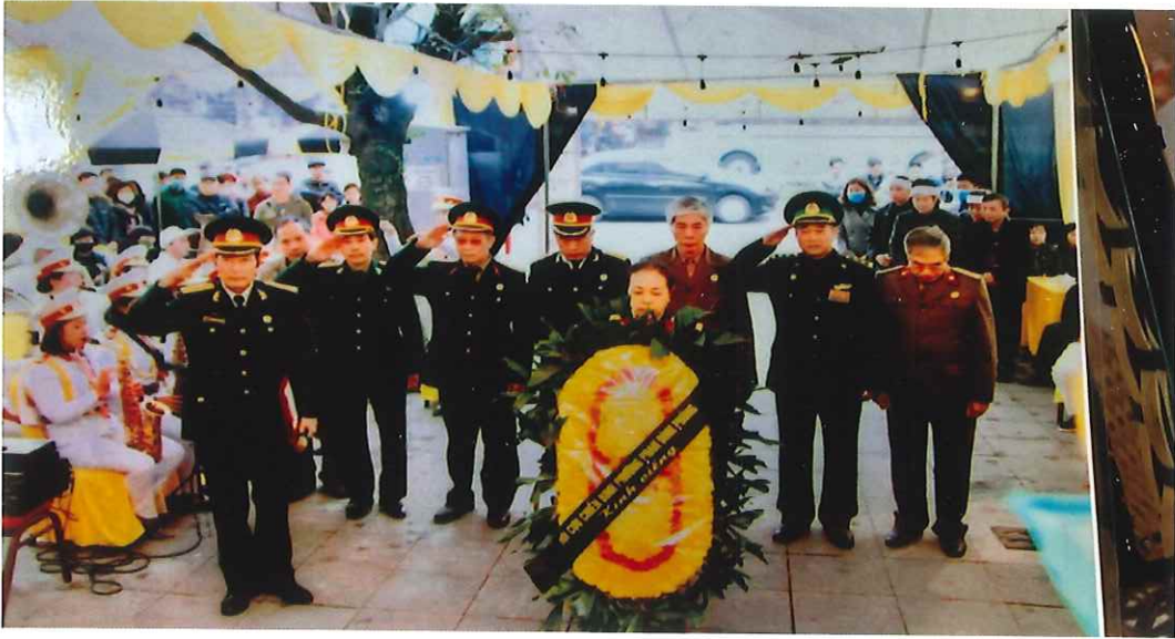
Đại biểu Hội Cựu chiến binh phường Phan Đình Phùng tiễn đưa hội viên về nơi an nghỉ cuối cùng (năm 2019)