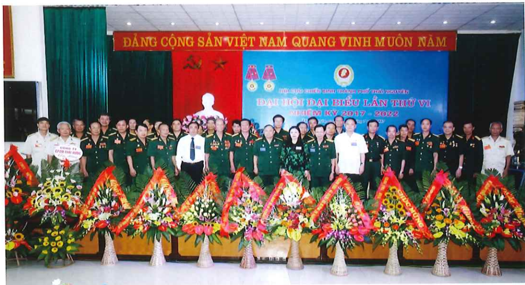
Ban Chấp hành Hội Cựu chiến binh thành phố Thái Nguyên khóa VI, nhiệm kỳ 2017 - 2022 chụp ảnh chung với các đại biểu tại Đại hội