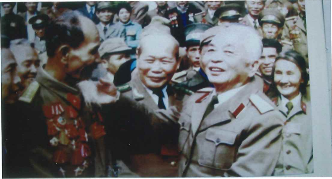
Đại tướng Võ Nguyên Giáp gặt gỡ thân mật với Cựu chiến binh Thành phố (năm 1990)