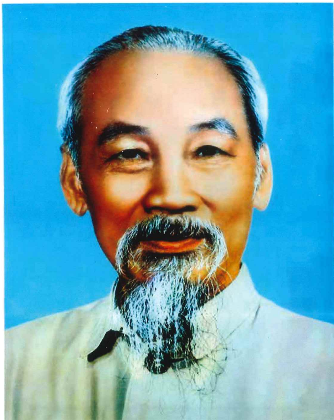
CHỦ TỊCH HỒ CHÍ MINH (1890 - 1969)