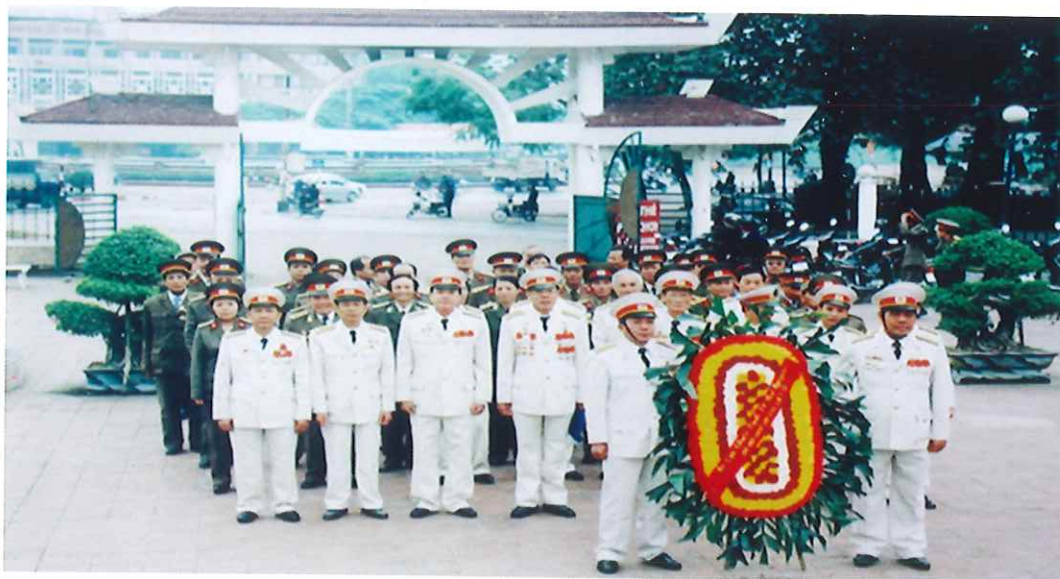
Đoàn đại biểu Hội Cựu chiến binh Thành phố viếng tượng đài Anh hùng liệt sĩ tỉnh Thái Nguyên (năm 2012)