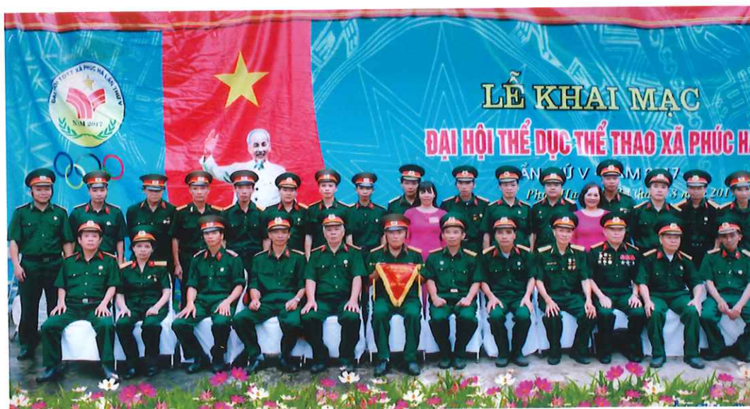
Đại biểu Hội Cựu chiến binh xã Phúc Hà tham gia Đại hội Thể dục, thể thao lần thứ V của xã (năm 2017)