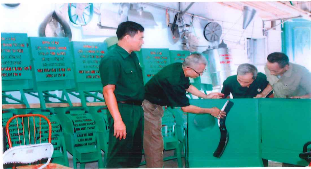
Xưởng cơ khí của hội viên Cựu chiến binh xã Hướng Thượng sản xuất ra nhiều sản phẩm đáp ứng nhu cầu thiết yếu của Nhân dân (năm 2017)