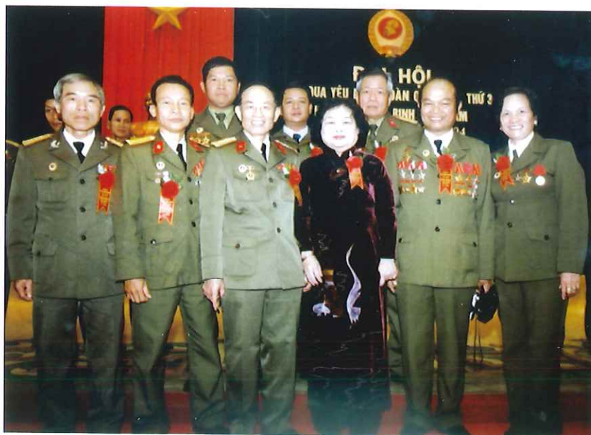
Phó Chủ tịch nước Trương Mỹ Hoa chụp ảnh chung với đại biểu Cựu chiến binh thành phố Thái Nguyên tại Đại hội thi đua yêu nước Hội Cựu chiến binh Việt Nam lần thứ 3 (năm 2004)