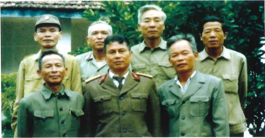
Ban Chấp hành lâm thời Hội Cựu chiến binh thành phố Thái Nguyên (Từ tháng 9/1990 - 7/1991)