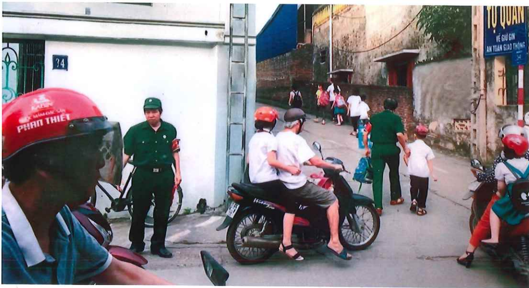
Cựu chiến binh phường Trung Thành thường xuyên giữ gìn trật tự giao thông tại cổng trường Tiểu học Trung Thành vào giờ tan trường (năm 2020)