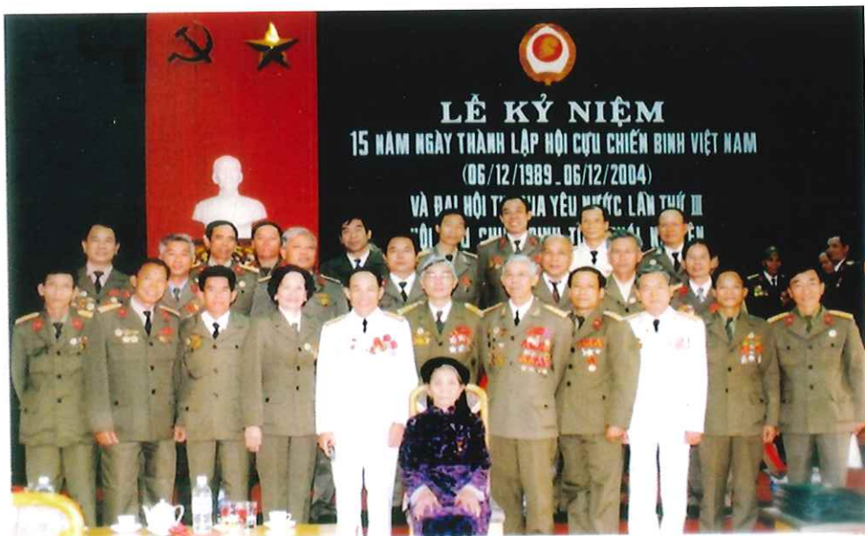
Các đại biểu Cựu chiến binh Thành phố dự Lễ kỷ niệm 15 năm Ngày thành lập Hội Cựu chiến binh Việt Nam và Đại hội thi đua yêu nước lần thứ III, Hội Cựu chiến binh tỉnh Thái Nguyên (năm 2004)