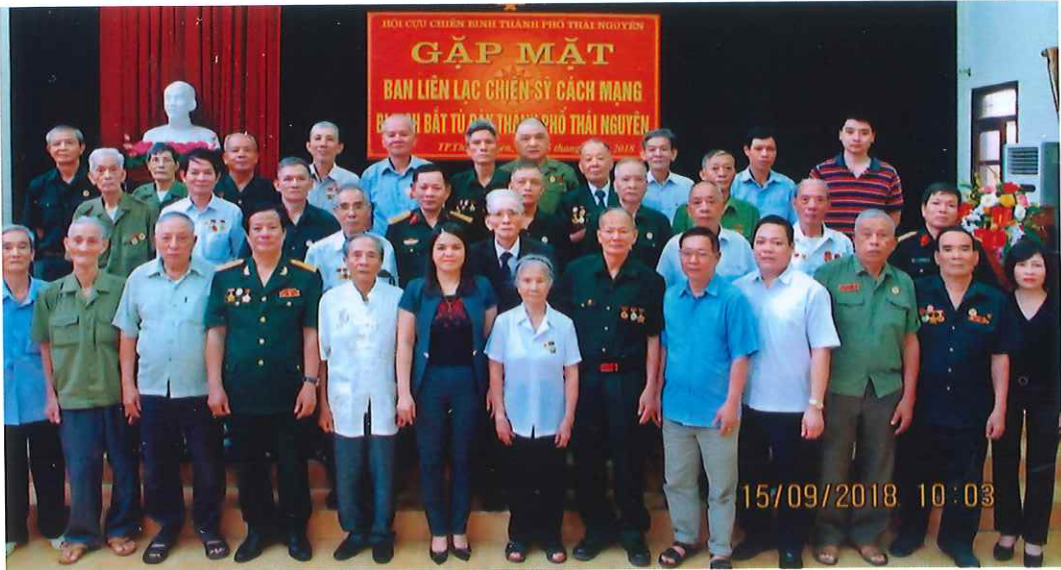
Hội Cựu chiến binh Thành phố tổ chức gặp mặt Ban liên lạc chiến sĩ cách mạng bị địch bắt tù đày thành phố Thái Nguyên (năm 2018)