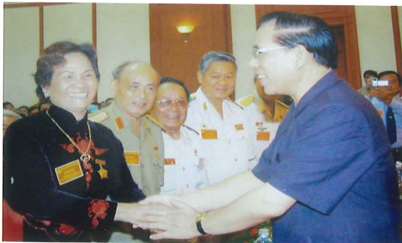
Tổng Bí thư Nông Đức Mạnh gặp mặt Cựu chiến binh tiêu biểu của Hội Cựu chiến binh thành phố Thái Nguyên (năm 2002)