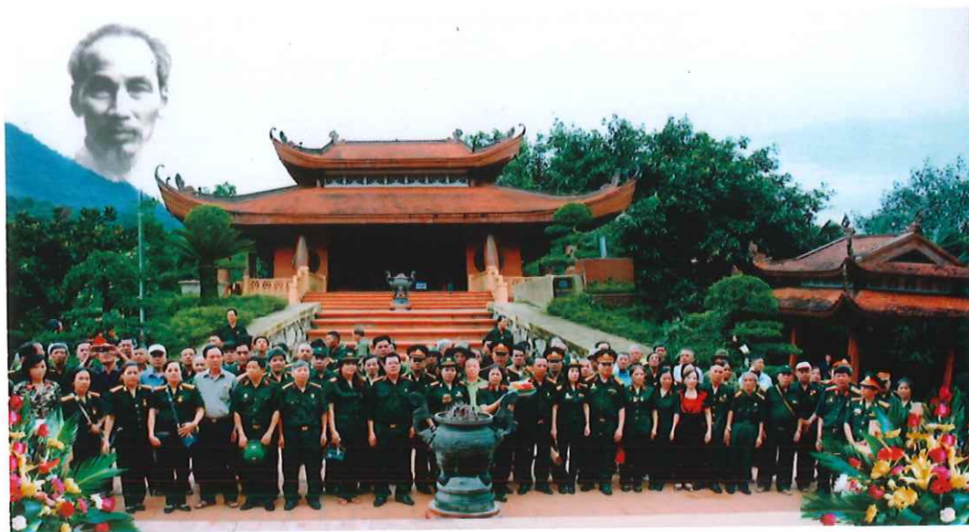
Đoàn đại biểu Hội Cựu chiến binh phường Thịnh Đán dâng hương tại Nhà Tưởng niệm Bác Hồ ở ATK Định Hóa (năm 2018)