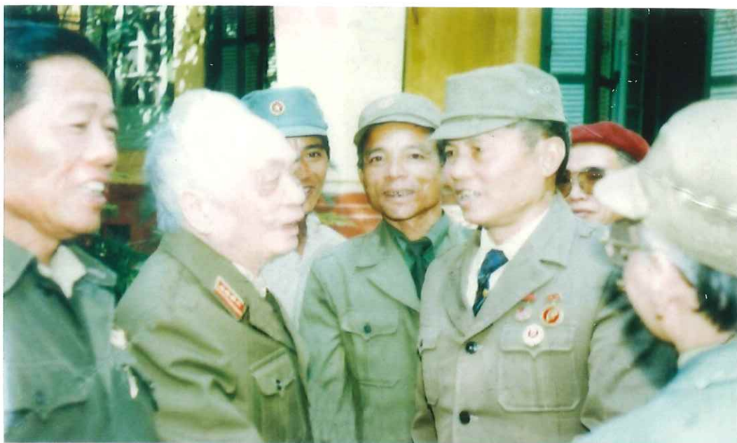
Đại tướng Võ Nguyên Giáp - Người anh Cả của Quân đội nhân dân Việt Nam, Chủ tịch danh dự Hội Cựu chiến binh Việt Nam từ 1992 - 2013, trò chuyện thân mật với lãnh đạo Hội Cựu chiến binh Thành phố (năm 1993)