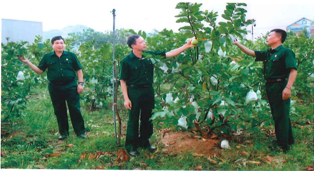
Mô hình trồng ổi mang lại hiệu quả kinh tế của hội viên Hội Cựu chiến binh xã Linh Sơn (năm 2019)