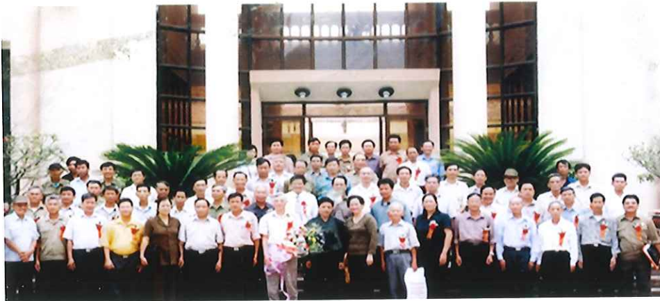
Các đại biểu dự Hội nghị Cựu chiến binh điển hình sản xuất, kinh doanh giỏi của thành phố Thái Nguyên (năm 2003)