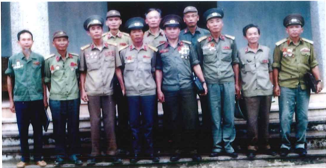
Ban Chấp hành Hội Cựu chiến binh thành phố Thái Nguyên khóa I (Nhiệm kỳ 1991 - 1996)