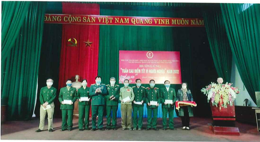
Chi hội Doanh nhân Cựu chiến binh thành phố Thái Nguyên tặng quà cho gia đình Cựu chiến binh nghèo xã Quyết Thắng trong “Tuần cao điểm Tết vì người nghèo” năm 2022