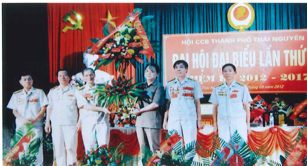
Đồng chí Mai Đông Kinh, Phó Bí thư Thường trực Thành ủy, Chủ tịch HĐND thành phố Thái Nguyên tặng hoa, chúc mừng Đại hội đại biểu Hội CCB Thành phố lần thứ V (tháng 5 - 2012)