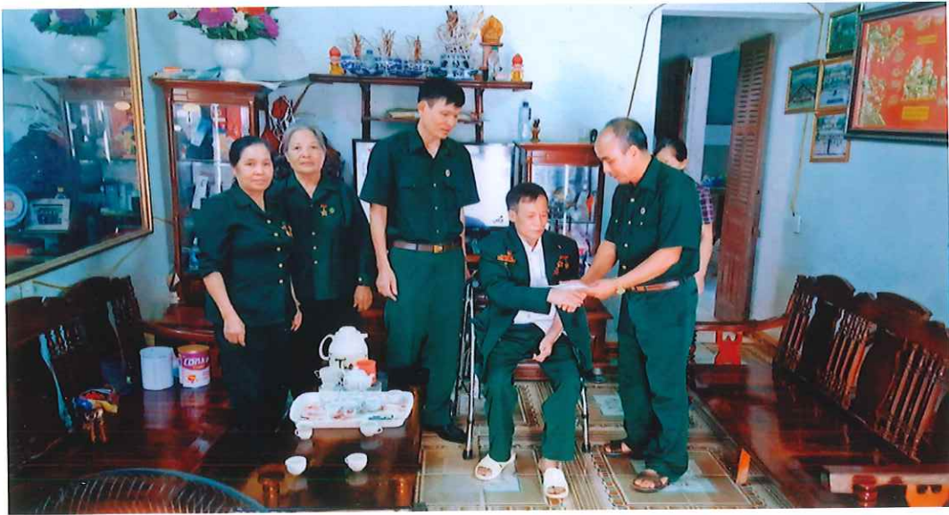
Đại biểu Hội Cựu chiến binh xã Tân Cương tặng quà hội viên là thương binh dịp 27/7/2020