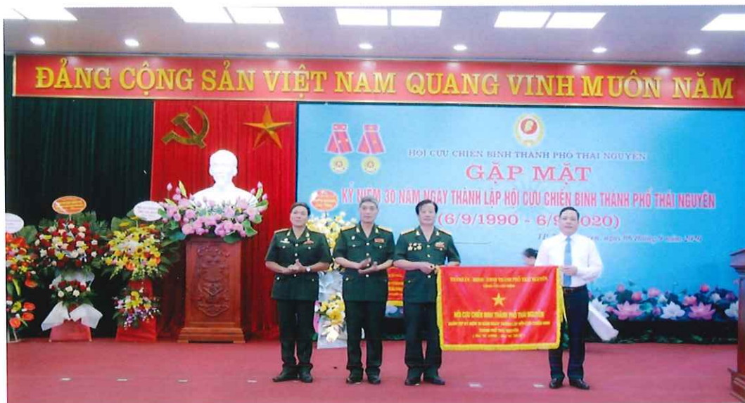
Đồng chí Nguyễn Hoàng Mác, Phó Bí thư Thường trực Thành ủy, Chủ tịch HĐND thành phố Thái Nguyên trao Cờ lưu niệm của Thành ủy - HĐND - UBND thành phố Thái Nguyên cho Hội Cựu chiến binh Thành phố tại buổi Gặp mặt kỷ niệm 30 năm Ngày thành lập Hội (6/9/1990 - 6/9/2020)