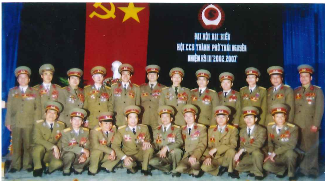
Ban Chấp hành Hội Cựu chiến binh thành phố Thái Nguyên khóa III (Nhiệm kỳ 2002 - 2007)