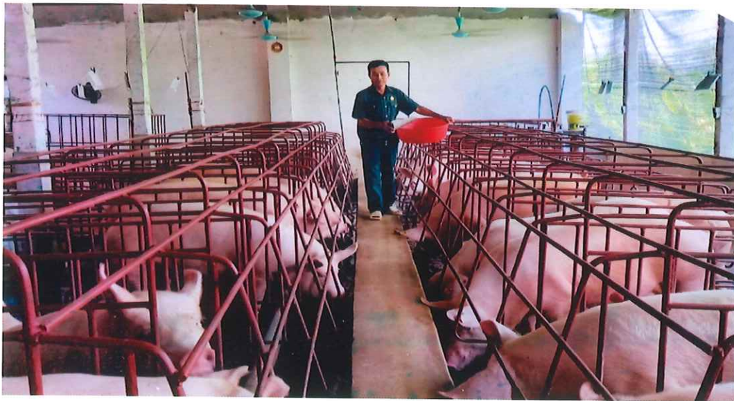
Chăn nuôi lợn thịt năng suất cao tại gia đình hội viên Hội Cựu chiến binh xã Cao Ngạn (năm 2018)