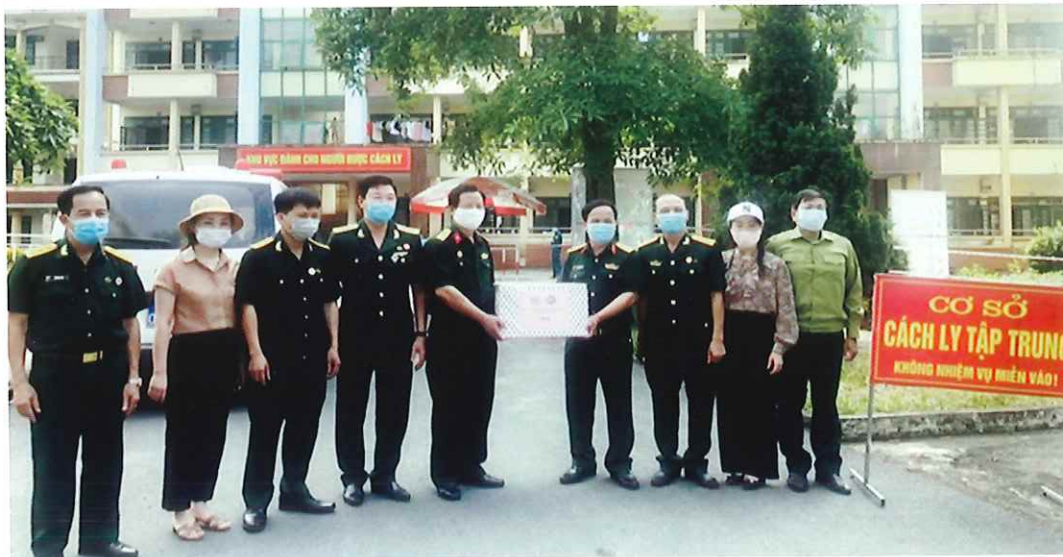
Hội Cựu chiến binh Thành phố tặng quà lực lượng làm nhiệm vụ phòng, chống Covid-19 tại Khu cách ly tập trung thành phố Thái Nguyên (trường Cao đẳng Công nghiệp Thái Nguyên - năm 2021)