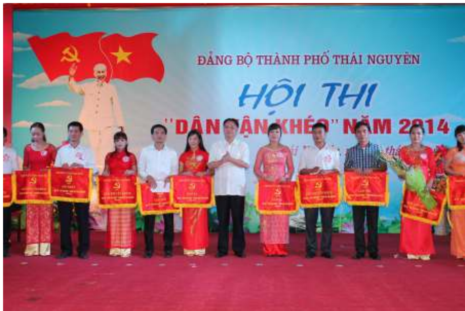
Đồng chí Mai Đông Kinh, Phó Bí thư Thường trực Thành ủy, Chủ tịch HĐND thành phố Thái Nguyên trao giải cho các thí sinh tại Hội thi Dân vận khéo của Đảng bộ thành phố Thái Nguyên (năm 2014)