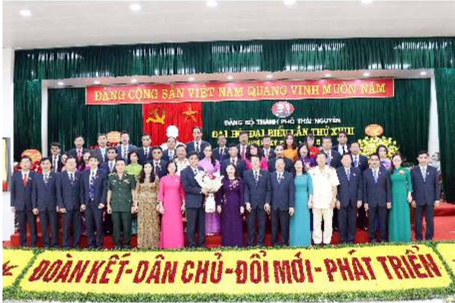
Ban Chấp hành Đảng bộ thành phố Thái Nguyên khóa XVIII (năm 2020)