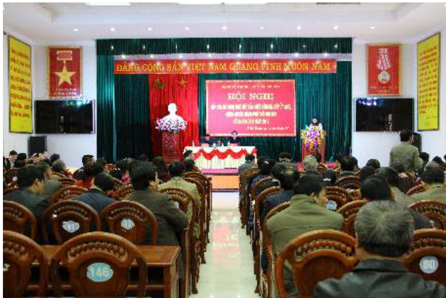
Hội nghị tiếp xúc, đối thoại của người đứng đầu cấp ủy đảng, chính quyền với nhân dân thành phố Thái Nguyên (năm 2017)