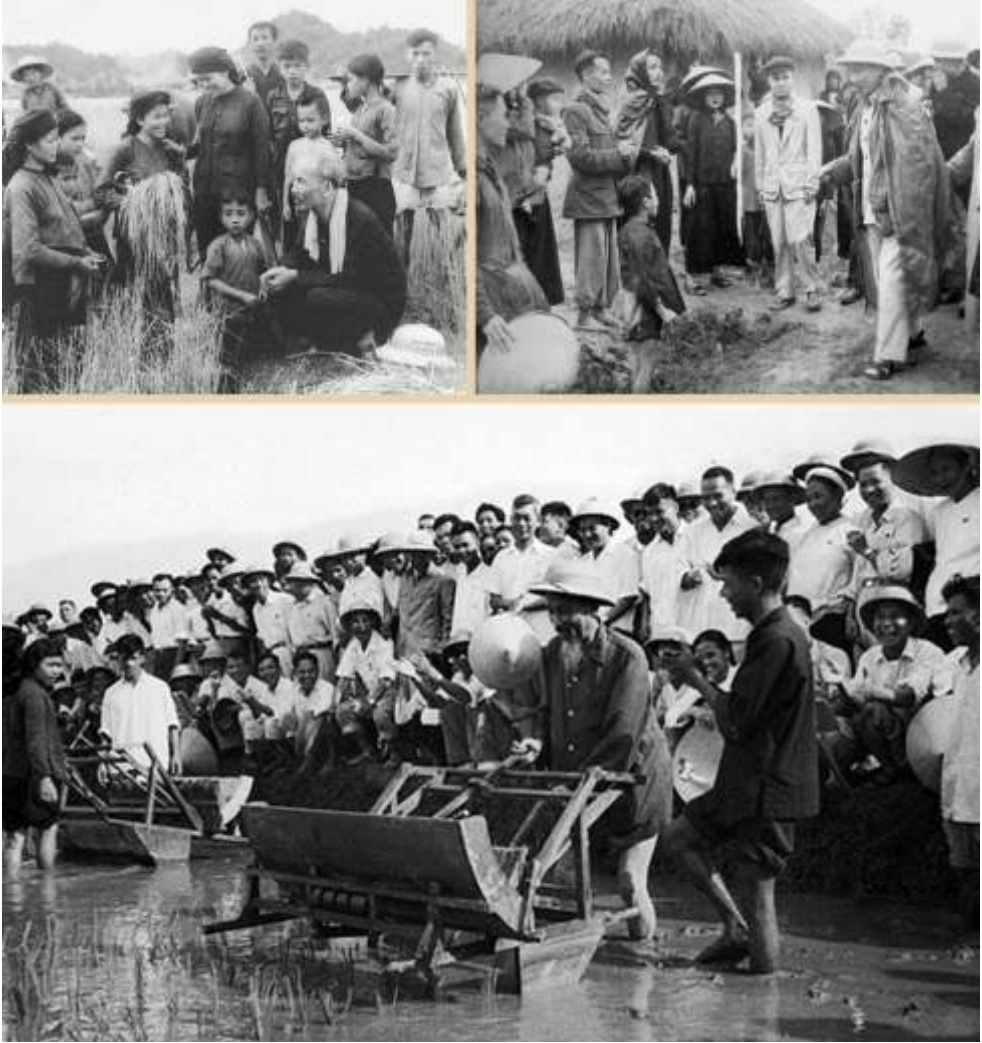
Bác Hồ gặp gỡ, trò chuyện với nhân dân và sử dụng thử máy cấy tại ruộng thí nghiệm (năm 1960)