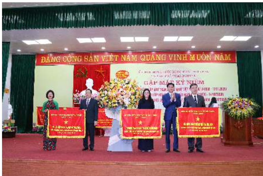
Thường trực Thành ủy tặng cờ lưu niệm cho Ủy ban Mặt trận Tổ quốc thành phố nhân kỷ niệm 90 năm ngày thành lập Mặt trận Dân tộc Việt nam (năm 2020)