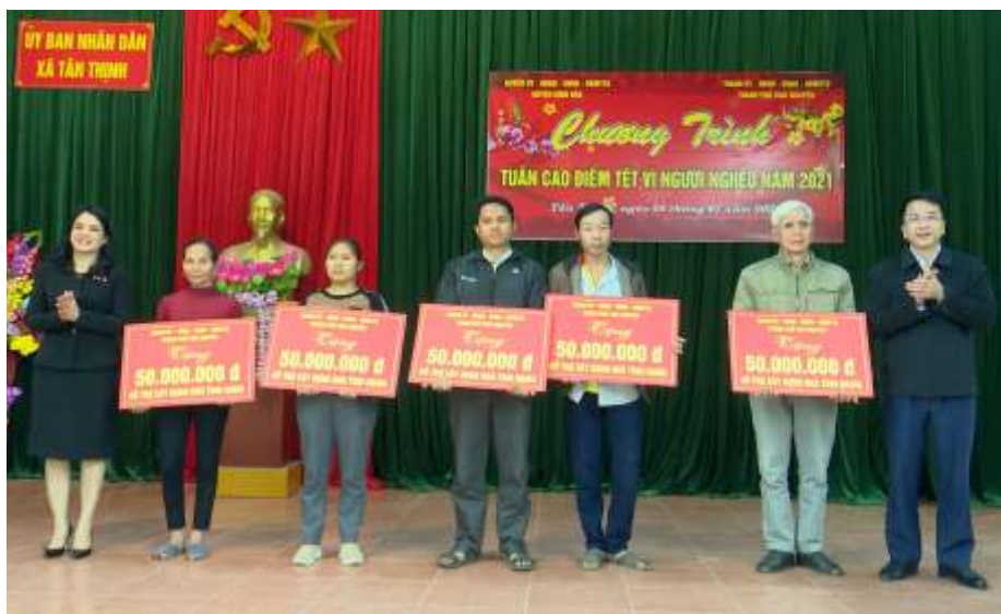
Chương trình tuần cao điểm Tết vì người nghèo (năm 2021)