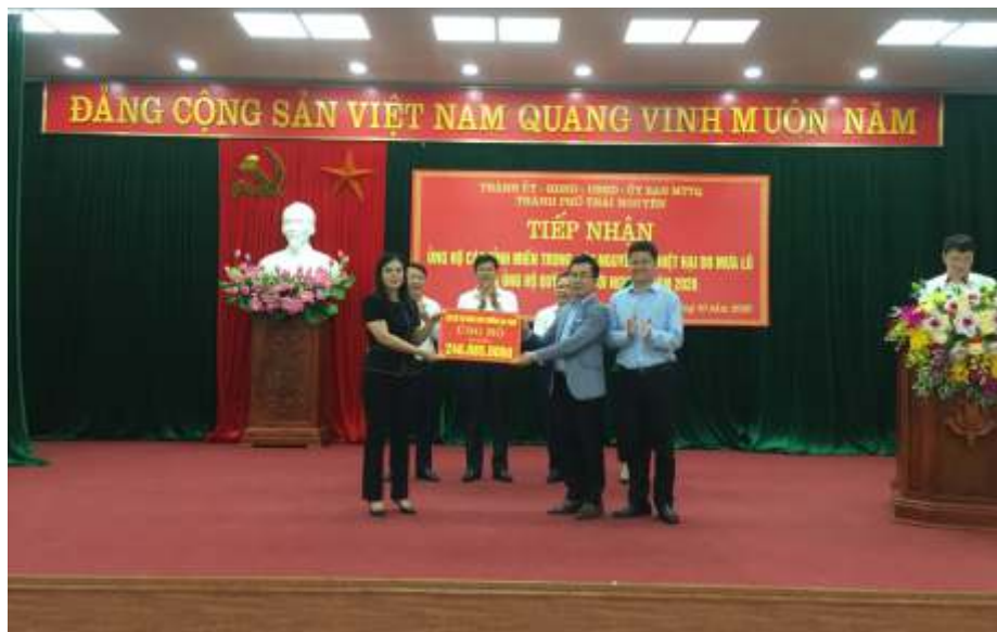
Lễ tiếp nhận ủng hộ các tỉnh Miền Trung Tây Nguyên thiệt hại do mưa lũ (năm 2020)