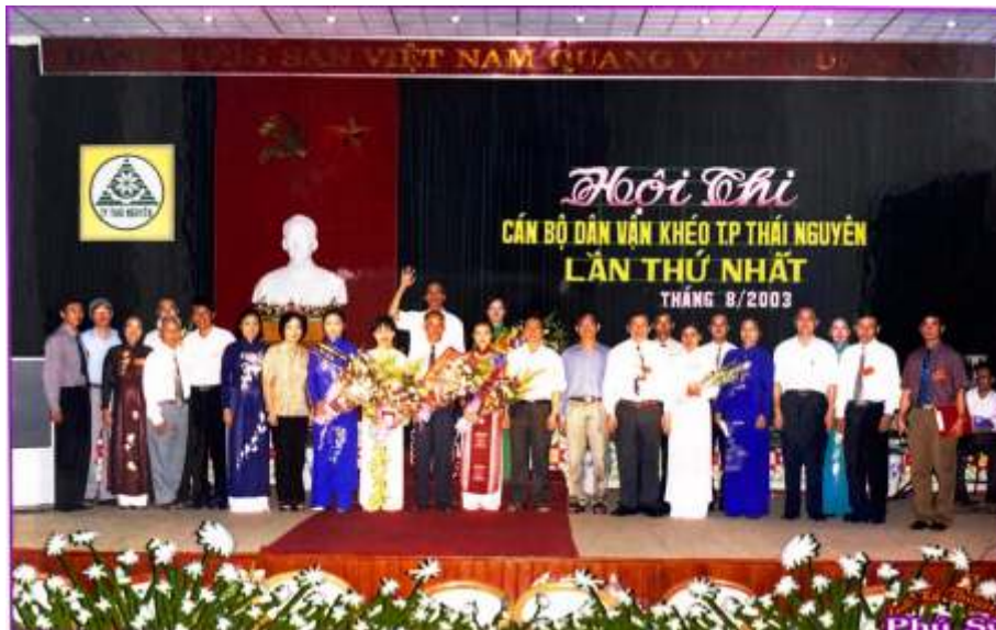
Hội thi cán bộ Dân vận khéo thành phố Thái Nguyên lần thứ nhất (năm 2003)