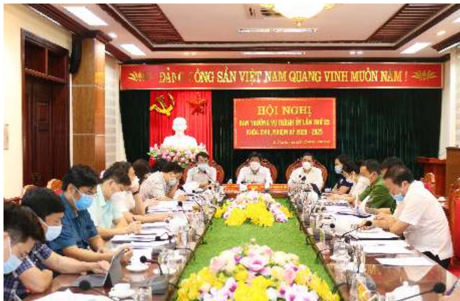
Hội nghị Ban Thường vụ Thành ủy lần thứ 23 khóa XVIII, nhiệm kỳ 2020-2025 (năm 2021)