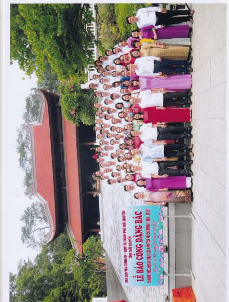
Ban Dân vận Thành ủy - UBMTTQ thành phố Thái Nguyên báo công dâng Bác tại khu di tích K9 - Ba Vì, Hà Nội