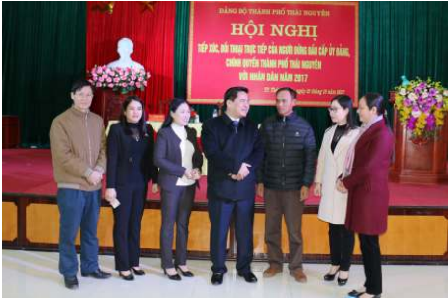
Các đồng chí Lãnh đạo thành phố tại Hội nghị tiếp xúc đối thoại trực tiếp của người đứng đầu cấp ủy đảng, chính quyền thành phố Thái Nguyên với nhân dân (năm 2017)