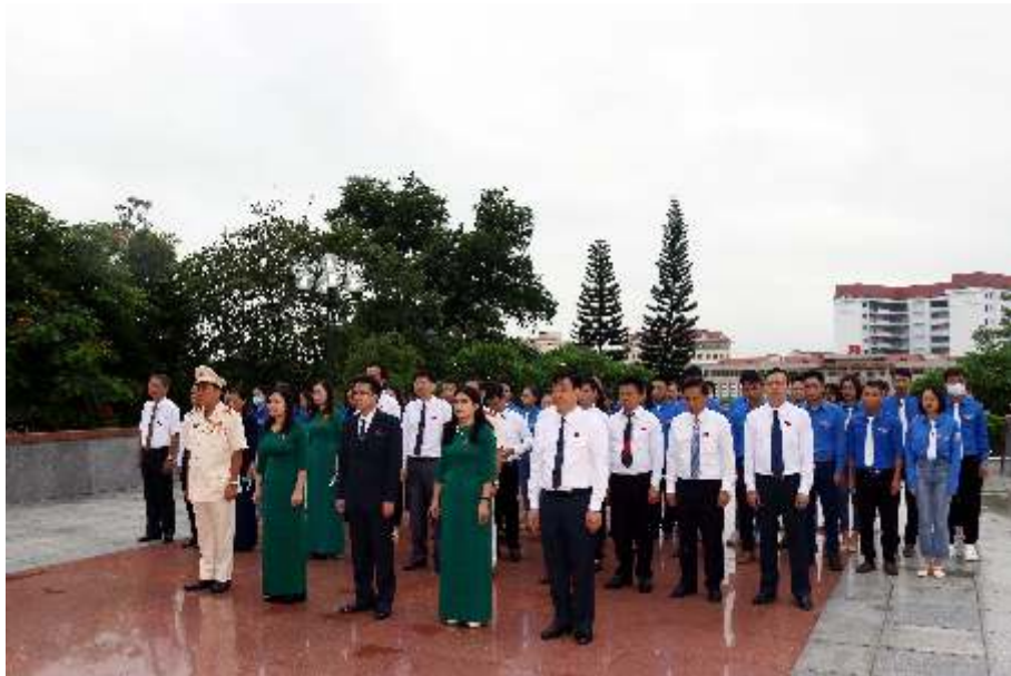
Lãnh đạo thành phố dâng hương tại Đài tưởng niệm các Anh hùng - Liệt sỹ tỉnh Thái Nguyên (năm 2020)