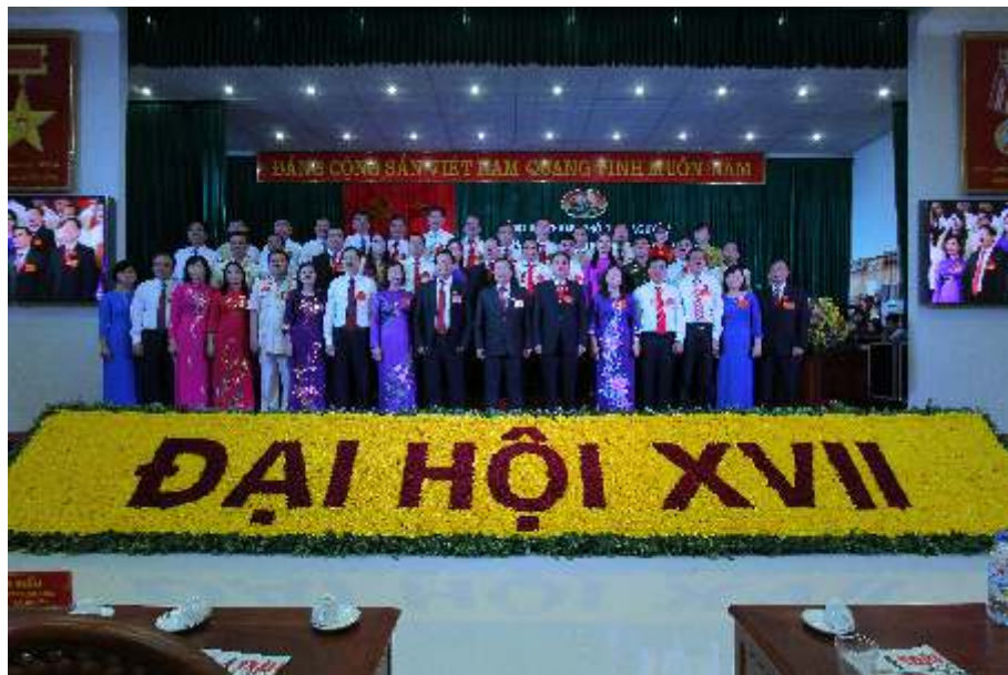
Ban Chấp hành Đảng bộ thành phố Thái Nguyên khóa XVII (năm 2015)