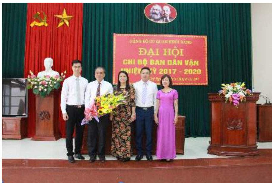
Đại hội Chi bộ Ban Dân vận Thành ủy nhiệm kỳ 2017-2020 (năm 2017)