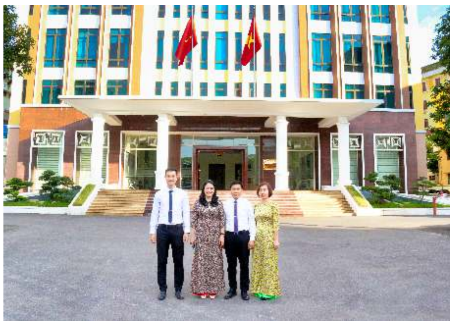
Tập thể Ban Dân vận Thành ủy Thái Nguyên (năm 2021)