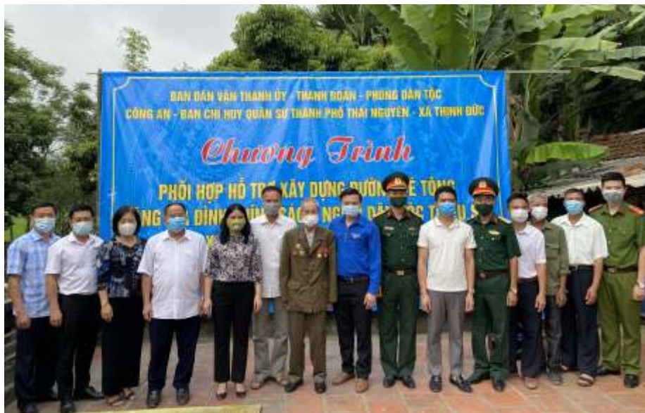
Chương trình phối hợp hỗ trợ xây dựng đường bê tông cho hộ gia đình chính sách, người dân tộc thiểu số tại xã Thịnh Đức, thành phố Thái Nguyên (năm 2021)