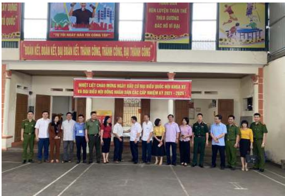
Lãnh đạo Ban Dân vận Tỉnh ủy, Thành ủy đi cơ sở nắm tình hình nhân dân phục vụ công tác bầu cử Đại biểu Quốc hội khóa XV và đại biểu HĐND các cấp, nhiệm kỳ 2021-2026 và thăm mô hình Dân vận khéo tại tổ 1, phường Quang Trung, thành phố Thái Nguyên (năm 2021)