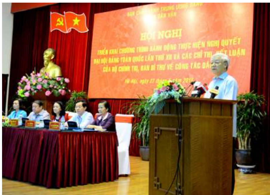
Tổng Bí thư Nguyễn Phú Trọng phát biểu chỉ đạo Hội nghị triển khai chương trình hành động thực hiện nghị quyết Đại hội đảng toàn quốc lần thứ XII và các chỉ thị, kết luận của Bộ Chính trị, Ban Bí thư về công tác dân vận (năm 2016)