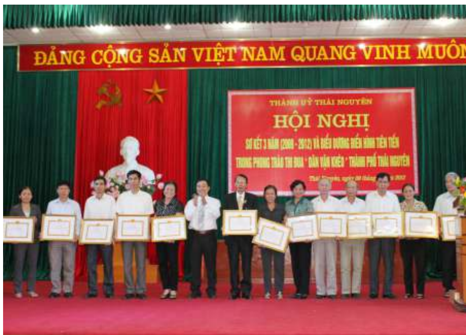
Biểu dương các điển hình tiên tiến trong phong trào thi đua Dân vận khéo thành phố Thái Nguyên (năm 2012)