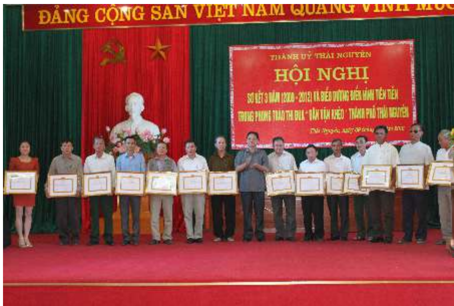
Đồng chí Mai Đông Kinh, Phó Bí thư Thường trực Thành ủy, Chủ tịch HĐND thành phố Thái Nguyên khen thưởng tại Hội nghị sơ kết 3 năm và biểu dương các điển hình tiên tiến trong phong trào thi đua Dân vận khéo hành phố Thái Nguyên (năm 2012)