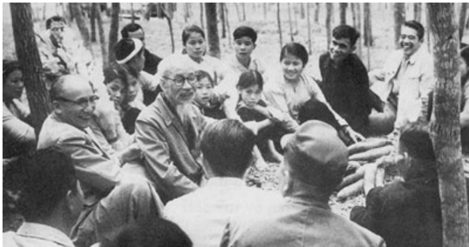
Bác Hồ nói chuyện với nhân dân huyện Đại Từ, tỉnh Thái Nguyên