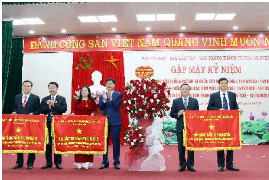
Thường trực Thành ủy tặng cờ lưu niệm cho Ban Dân vận Thành ủy nhân kỷ niệm 90 năm ngày truyền thống công tác Dân vận của Đảng (năm 2020)