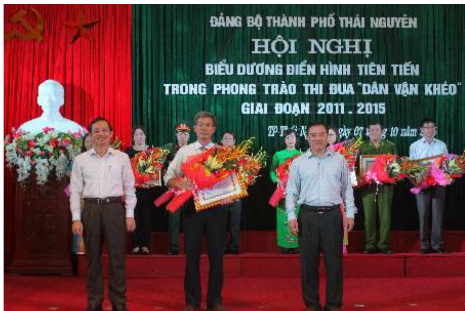
Hội nghị biểu dương các điển hình tiên tiến trong phong trào thi đua Dân vận khéo, giai đoạn 2011-2015 (năm 2015)