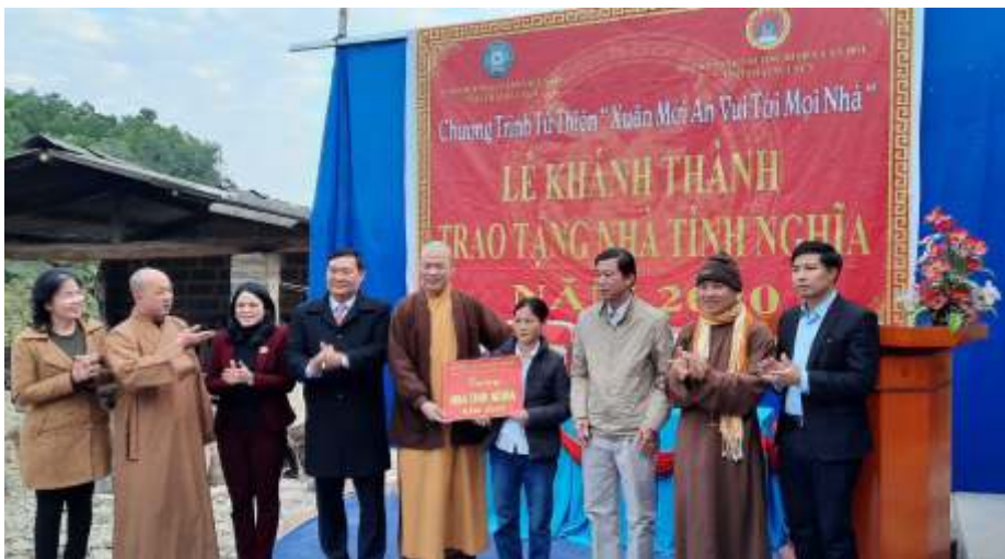
Lễ khánh thành trao tặng nhà tình nghĩa tại xã Linh Sơn, thành phố Thái Nguyên (năm 2020)