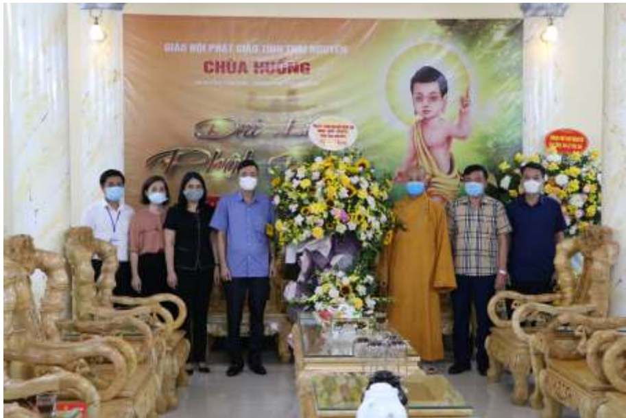
Ban Dân vận Thành ủy Thái Nguyên mừng Đại lễ Phật Đản tại Chùa Hương (năm 2021)