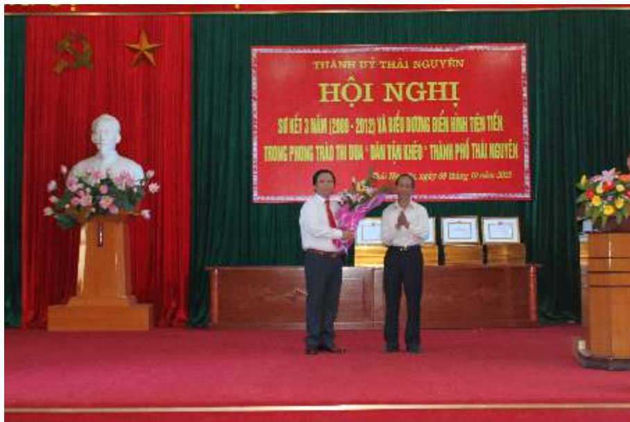
Biểu dương điển hình tiên tiến trong phong trào thi đua Dân vận khéo thành phố Thái Nguyên (năm 2012)