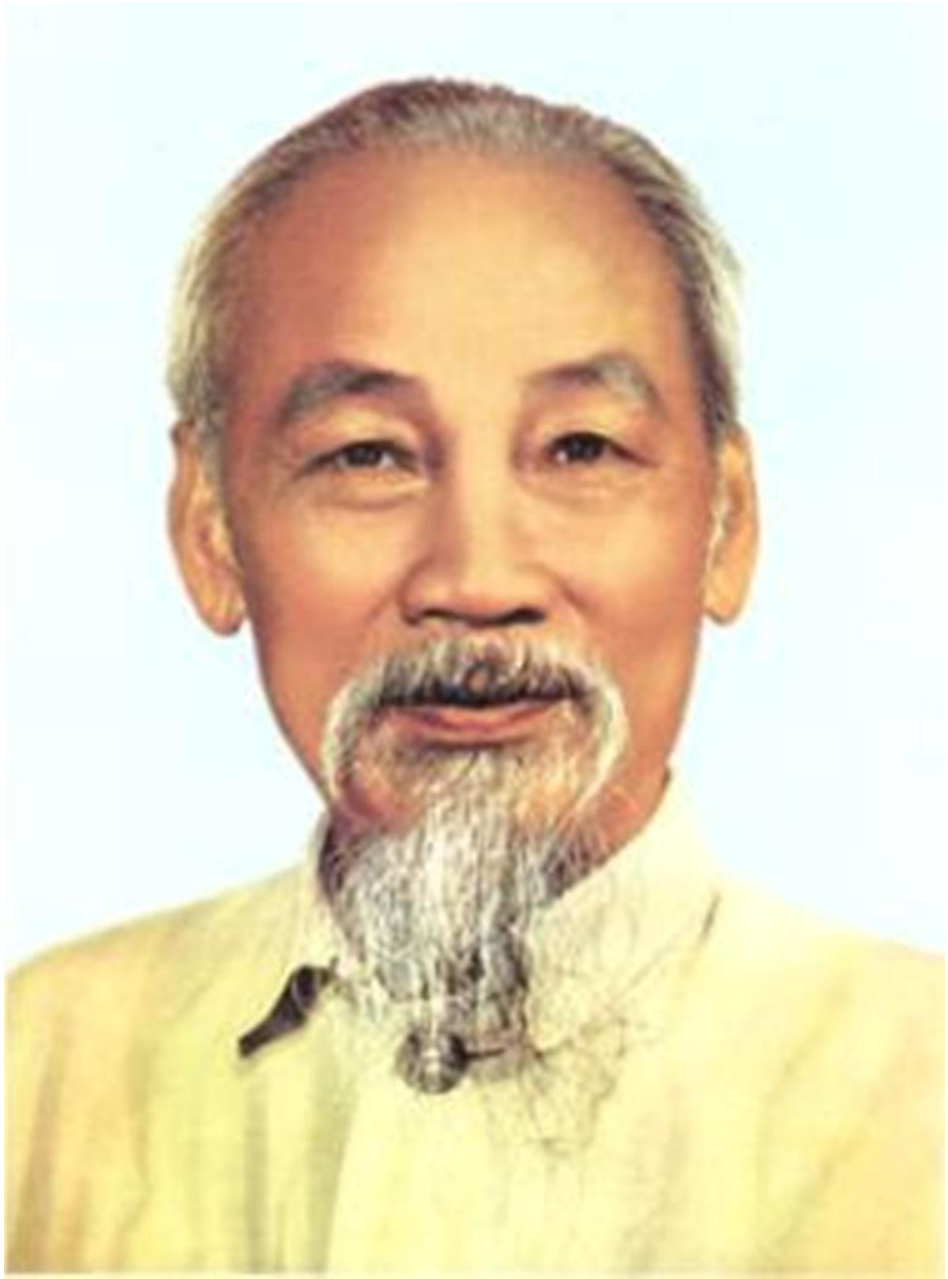
CHỦ TỊCH HỒ CHÍ MINH