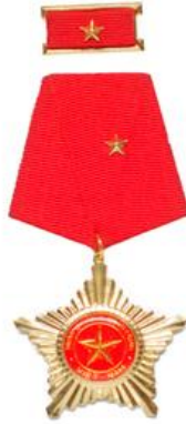
Huân chương Quân công hạng Ba (năm 1985)