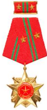
Huân chương chiến công hạng Nhì (năm 1996)