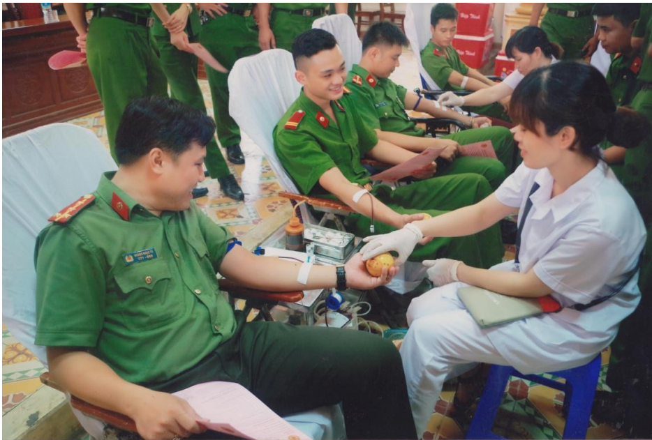
Cán bộ chiến sĩ Công an Thành phố Thái Nguyên tham gia hiến máu tình nguyện (ảnh tư liệu)