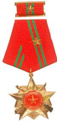
Huân chương Chiến công hạng Ba (năm 1980)