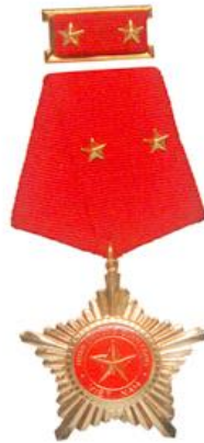
Huân chương Quân công hạng Nhì (năm 1995)