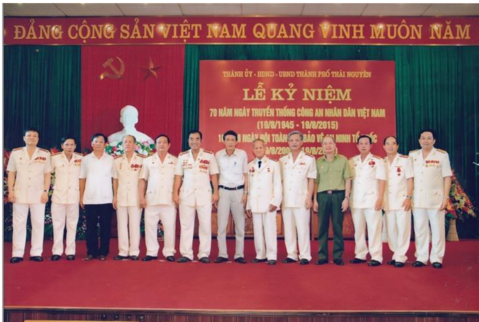
Lễ kỉ niệm 70 năm ngày truyền thống Công an nhân dân Việt Nam (19/8/1945 - 19/8/2015) (ảnh tư liệu)