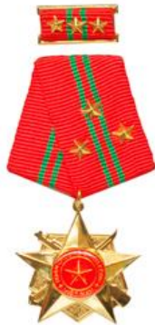
Huân chương chiến công hạng Nhất (năm 2005)