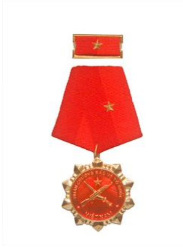
Huân chương Bảo vệ Tổ quốc hạng Ba (năm 2006)