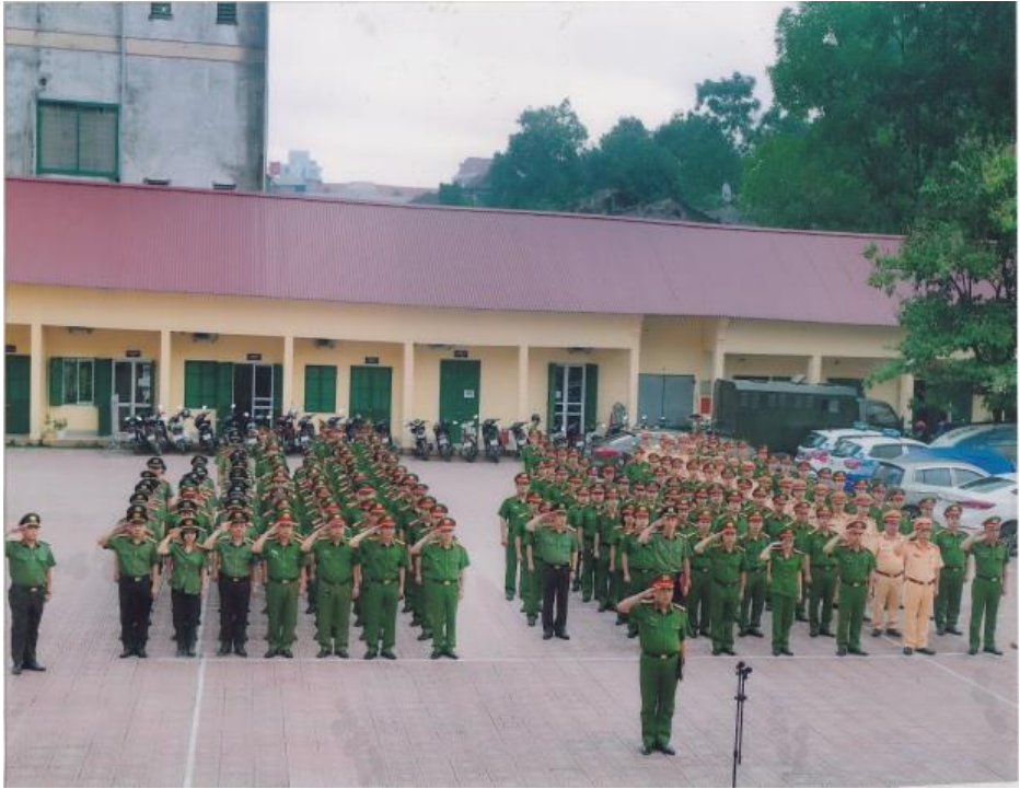
Công an Thành phố Thái Nguyên tổ chức sinh hoạt dưới cờ hàng tháng (ảnh tư liệu)