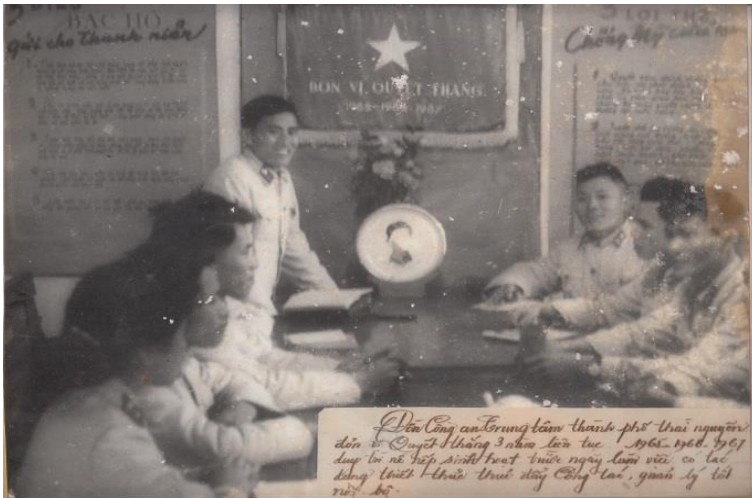
Đồn Công an Trung tâm Thành phố Thái Nguyên - Đơn vị Quyết thắng 3 năm liên tục (1965 -1966 -1967) duy trì giao ban, sinh hoạt đầu giờ buổi sáng hàng ngày (ảnh tư liệu)