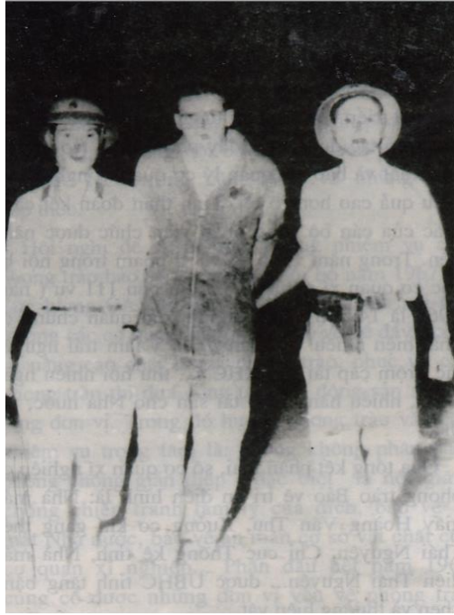
Cán bộ, chiến sĩ Công an Thành phố Thái Nguyên tham gia bắt và dẫn giải giặc lái máy bay Mỹ tháng 11/1966 (ảnh tư liệu)