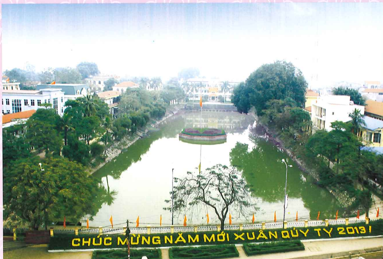
Quang cảnh khu hành chính huyện Phổ Yên