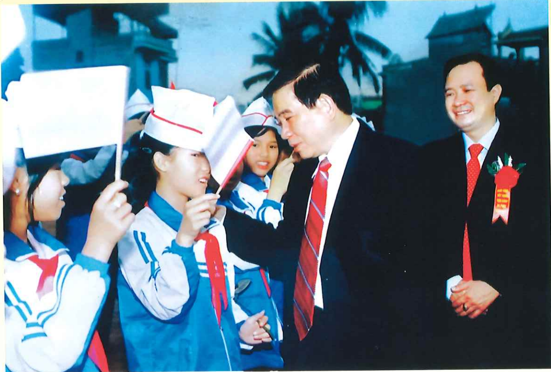
Chủ tịch nước CHXHCN Việt Nam Nguyễn Minh Triết tới thăm và làm việc tại huyện Phở Yên, tỉnh Thái Nguyên - Tháng 2/2010