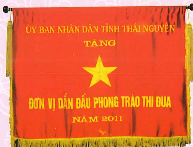
CỜ THI ĐUA CỦA CHÍNH PHỦ VÀ UBND TỈNH THÁI NGUYÊN TẶNG