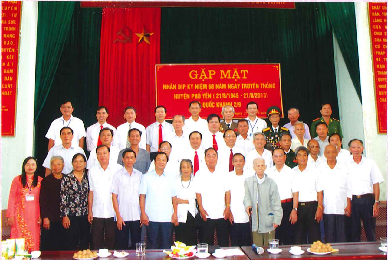
Gặp mặt kỷ niệm 68 năm ngày truyền thống huyện Phổ Yên - 21/8/2013