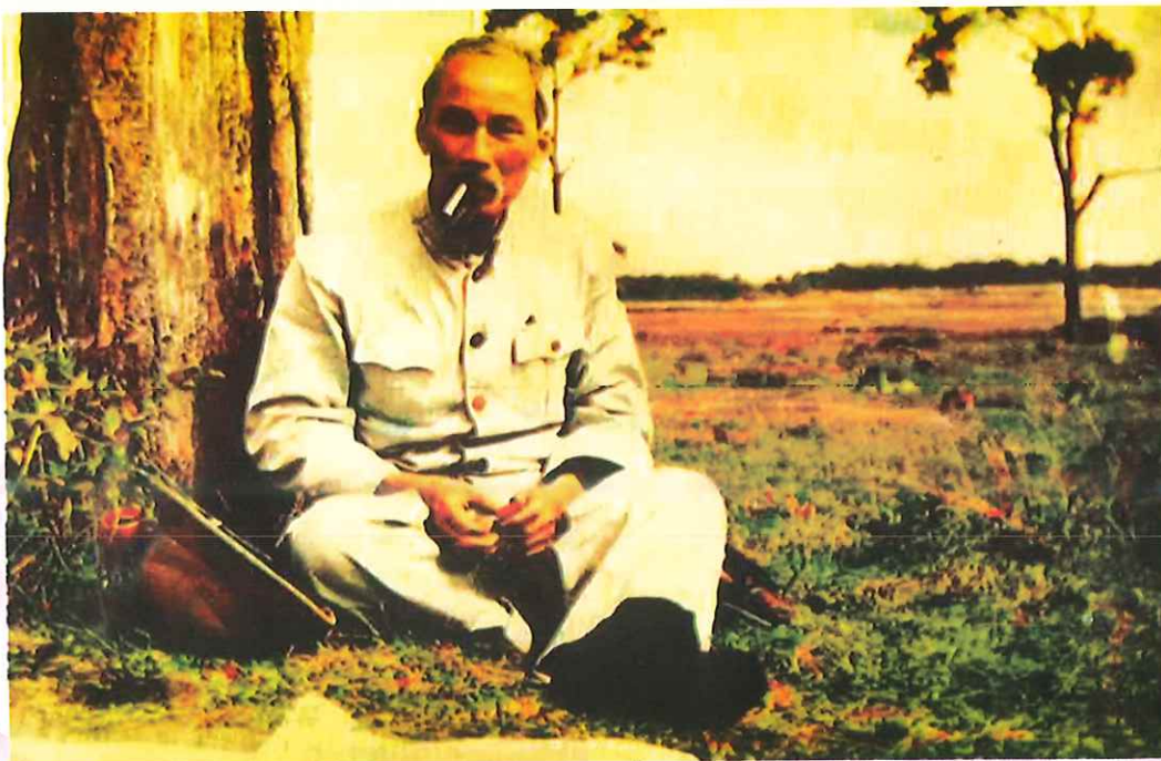
Bác Hồ dừng chân nghỉ tại Đồi Thông Vân Dương, Hồng Tiến, Phô Yên trưa ngày 01/01/1964 trên đường trở về sau khi thăm Đảng bộ và nhân dân các dân tộc tỉnh Thái Nguyên (Bác thăm Đền Mẫu Vương tại xã Hồng Tiến (Phô Yên), tới thăm cán bộ, chiến sỹ Sư đoàn 312 đóng quân trên khu đồi phía Tây thị trấn Ba Hàng – nay là nơi Viện Quân y 91 đứng chân)

Sau cách mạng Tháng Tám không lâu, nhân dân Phô Yên lại cùng nhân dân cả nước bước vào 2 cuộc kháng chiến chống thực dân Pháp và Đế quốc Mỹ xâm lược. Trong 2 cuộc kháng chiến đầy khó khăn, gian khổ và hy sinh này, nhân dân Phô Yên đã hưởng ứng lời kêu gọi của Chủ tịch Hồ Chí Minh: “Quyết tâm đem tất cả tinh thần và lực lượng, tính mạng và của cải để giữ vững tự do, độc lập”, tinh thần “không có gì quý hơn độc lập, tự do” . Bám sát các chỉ thị, nghị quyết của Trung ương và lời kêu gọi chống Pháp, chống Mỹ của Chủ tịch Hồ Chí Minh, Đảng bộ, chính quyền và nhân dân các dân tộc Phô Yên đã nêu cao tinh thần đoàn kết, tin tưởng vào niềm tin chiến thắng. Các cấp, các ngành và toàn thể nhân dân các dân tộc trọng huyện đã ra sức thi đua lao động sản xuất, thực hành tiết kiệm, động viên con em lên đường làm nhiệm vụ bảo vệ Tổ quốc và tinh thần Quốc tế cao cả. Hàng vạn người con của quê hương Phô Yên đã nối tiếp nhau trong 2 cuộc kháng chiến chống Đế quốc xâm lược. Nhiều người tham gia chiến đấu, phục vụ chiến đấu khi trở về còn mang trên mình vết thương của cuộc chiến tranh và bệnh tật do chất độc Diôxin của Mỹ gây ra, hàng ngàn liệt sỹ đã hy sinh vì độc lập tự do cho Tổ quốc, góp phần cùng quân dân cả nước làm nên chiến thắng lịch sử Điện Biên Phủ và đại thắng mùa xuân 1975, kết thúc thắng lợi vẻ vang sự nghiệp đấu tranh giải phóng dân tộc, cùng cả nước đi lên chủ nghĩa xã hội.