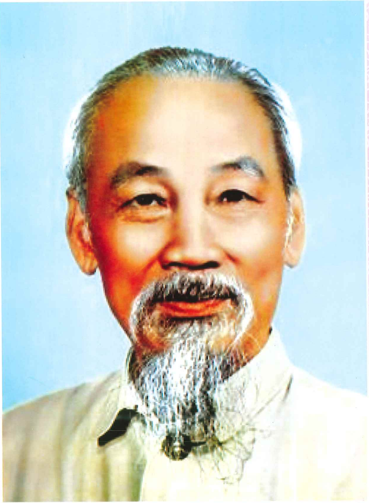
CHỦ TỊCH HỒ CHÍ MINH (1890 - 1969)