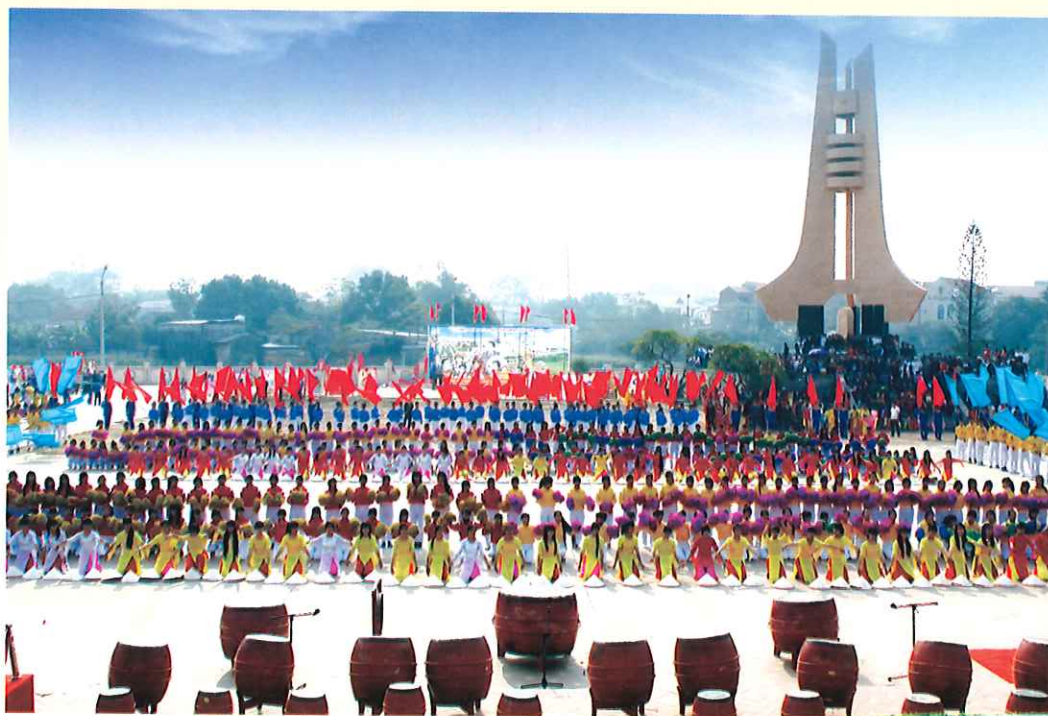
Đại hội Thể dục thể thao huyện Phở Yên lần thứ 5 năm 2013

Về văn hóa văn nghệ, thể dục thể thao, hiện tại huyện có hàng trăm công trình lớn nhỏ như: Nhà văn hóa, điểm bưu điện, thư viện điện tử, sân tập bóng đá, nhà thi đấu, các sân tennis, cầu lông, bóng chuyền... cơ bản đáp ứng nhu cầu văn hóa, thể dục thể thao của nhân dân trên địa bàn.