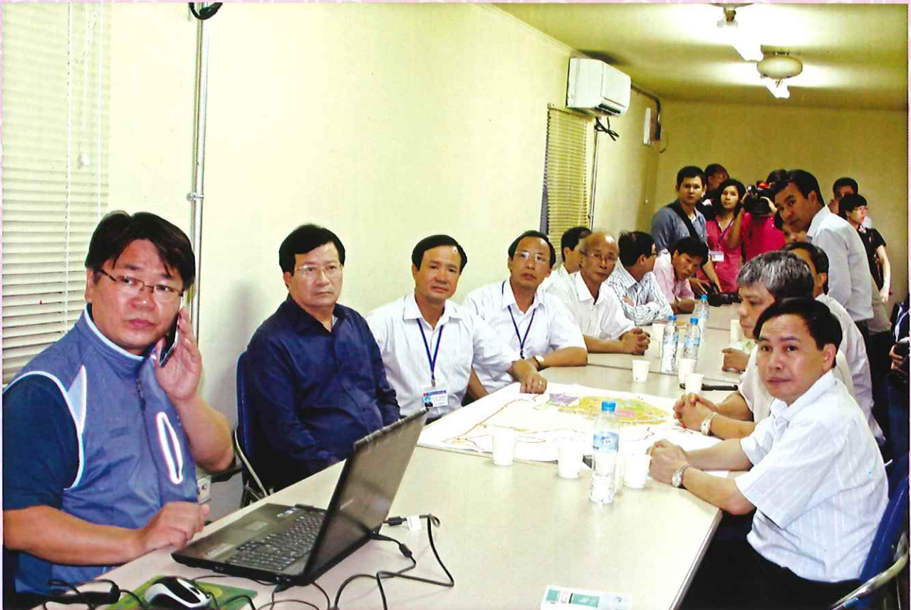
Đồng chí Trịnh Đình Dũng - Bộ trưởng Bộ Xây dựng cùng lãnh đạo tỉnh, huyện làm việc với Tập đoàn Samsung tại nhà điều hành công trường.