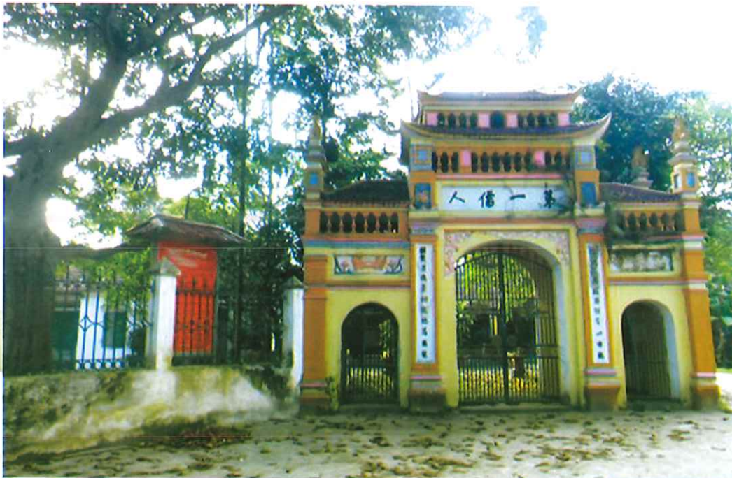
Ngày 21/8/1945 tại Đền Giá xã Đông Cao Ban lãnh đạo tổng khởi nghĩa huyện Phở Yên tổ chức họp và chính thức thành lập Ủy ban giải phóng lâm thời huyện.

Trước cách mạng tháng 8 năm 1945 Phở Yên đã được Trung ương Đảng và Xứ uỷ Bắc Kỳ tin tưởng chọn làm An toàn khu II (gọi tắt là ATK2) - một căn cứ địa bí mật nằm ngay trong lòng địch. Tại đây các cơ quan của Trung ương Đảng, Xứ uỷ Bắc Kỳ, các đồng chí Trường Chinh (Tổng Bí thư Đảng), đồng chí Hoàng Quốc Việt, Đồng chí Hoàng Văn Thái và nhiều đồng chí cán bộ tiền bối của Đảng đã đến ở và làm việc. Nhân dân và lực lượng tự vệ Phở Yên đã hoàn thành xuất sắc nhiệm vụ bảo vệ các cơ quan và các đồng chí lãnh đạo cao cấp của Trung ương, góp phần quan trọng tiến hành tổng khởi nghĩa cách mạng Tháng Tám thành công và thành lập chính quyền cách mạng nhân dân huyện Phở Yên ngày 21/8/1945.