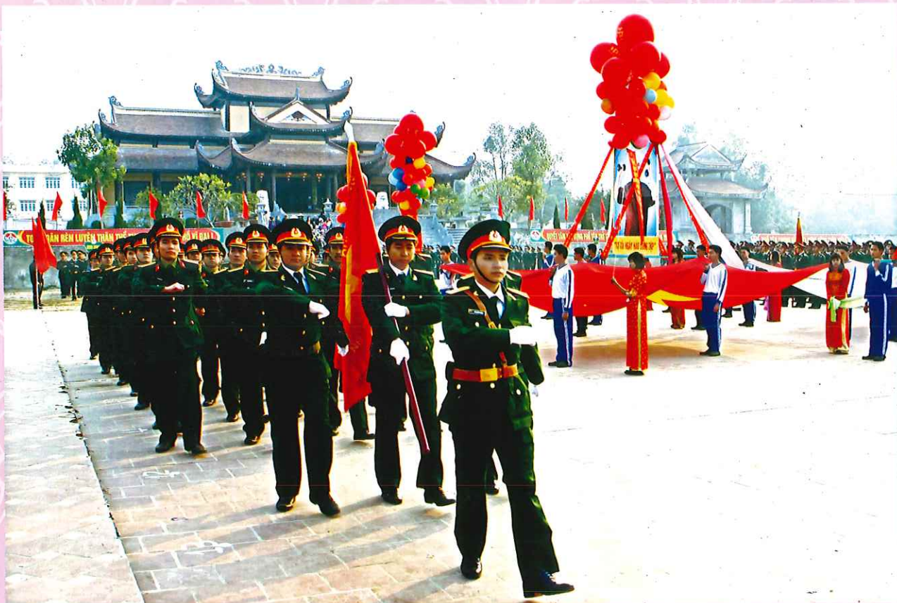
Lực Lượng Vũ Trang huyện Phổ Yên duyet binh tại Đại hội thể dục thể thao huyện Phổ Yên lần thứ 5.