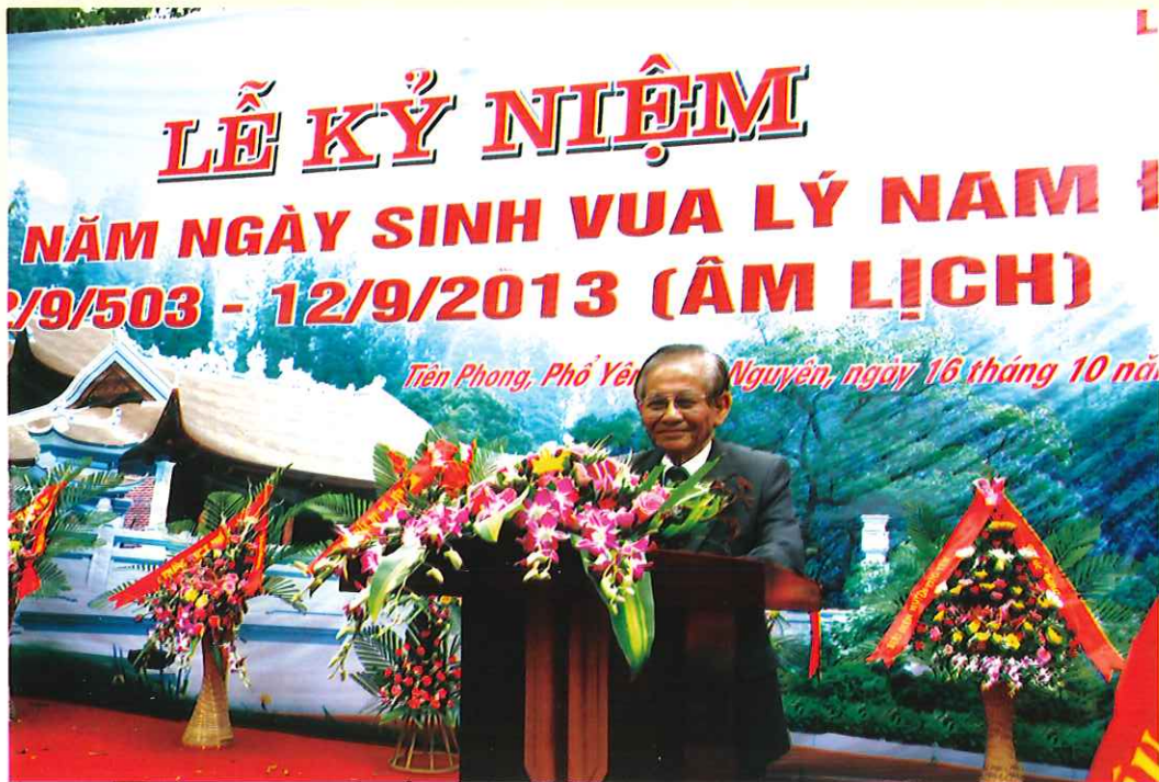
Lễ kỷ niệm 1510 năm ngày sinh Vua Lý Nam Đế (12/9/503 - 12/9/2013 ÂL) tại xã Tiên Phong, huyện Phổ Yên