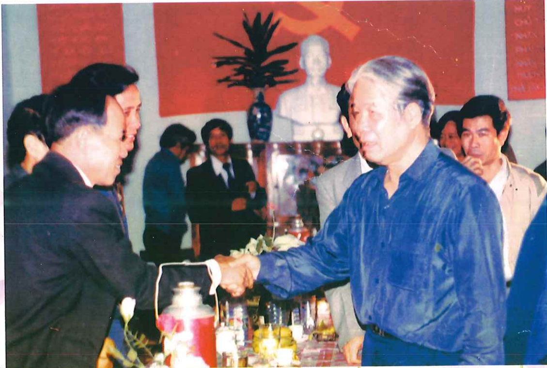
Tổng Bí thư Đỗ Mười thăm và làm việc với Đảng bộ, chính quyền, nhân dân các dân tộc huyện Phổ Yên