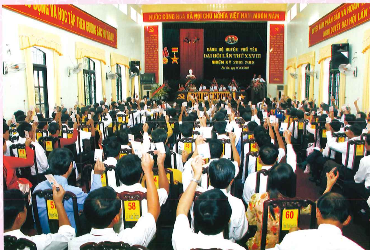
Đại hội Đảng bộ huyện Phổ Yên lần thứ XXVIII