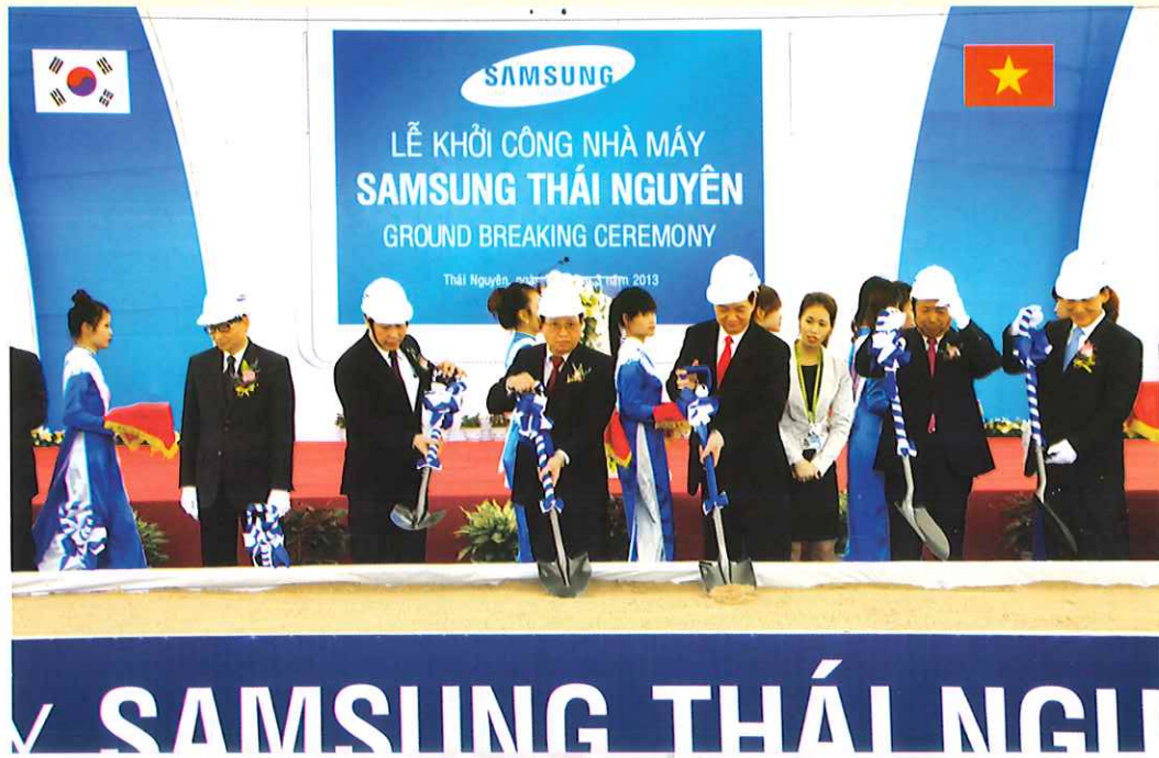
Thủ tướng Chính phủ khởi công xây dựng nhà máy SamSung tại Khu công nghiệp Yên Bình, Phở Yên, Thái Nguyên.

Để lãnh đạo chỉ đạo tổ chức thực hiện Ban Thường vụ Huyện ủy đã ban hành Nghị quyết 09-NQ/HU về tăng cường sự lãnh đạo của Đảng đối với công tác giải phóng mặt bằng để xây dựng và phát triển huyện thành thị xã công nghiệp vào năm 2015. Do vậy đã giải phóng trên 230 ha, liên quan đến hơn 2.300 hộ dân, tái định cư cho trên 300 hộ, thu hút trên 30 dự án, đưa tổng số dự án trên địa bàn huyện lên 83 dự án với số vốn đăng ký trên 165 nghìn tỷ đồng. Trong đó thành tích xuất sắc là đã thu hút dự án Sam Sung đầu tư vào địa bàn với vốn đầu tư trên 3,2 tỷ USD. Đây là dự án lớn có ý nghĩa vô cùng quan trọng với phát triển kinh tế xã hội của huyện và thực hiện mục tiêu xây dựng thị xã công nghiệp; chỉ trong 57 ngày đêm đã giải phóng trên 100 ha bàn giao cho chủ đầu tư khởi công xây dựng nhà máy. Đến thời điểm hiện nay, nhà máy đã hoàn thành trên 80% khối lượng xây dựng các công trình, dự kiến đi vào hoạt động trong quý I/2014.