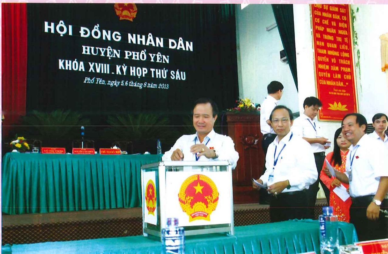
Đại biểu HĐND huyện bỏ phiếu tại kỳ họp lần thứ 6 HĐND huyện khóa XVIII