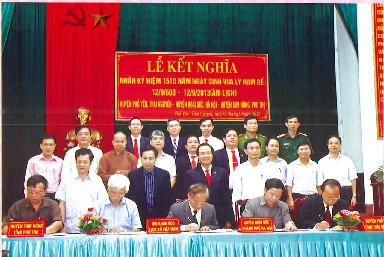
Lễ kết nghĩa nhân kỷ niệm 1510 năm ngày sinh vua Lý Nam Đế (huyện Phổ Yên, Thái Nguyên - huyện Hoài Đức, Hà Nội - huyện Tam Nông, Phú Thọ)