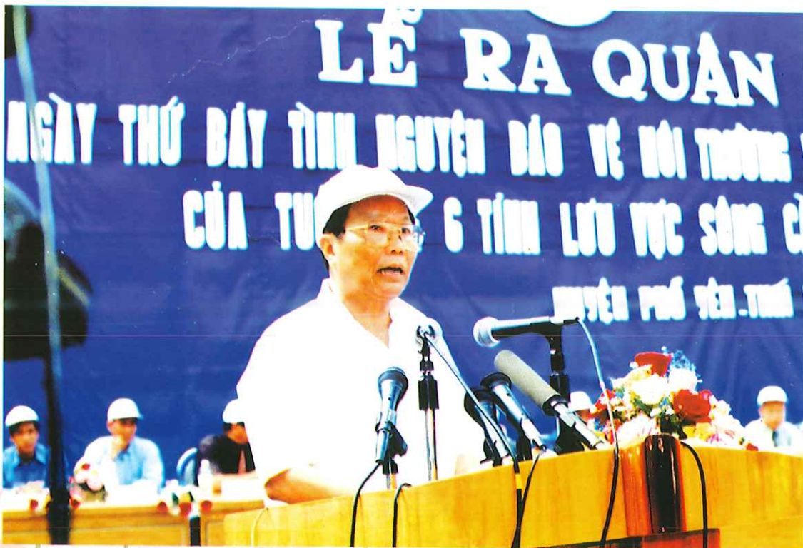
Chủ tịch nước Trần Đức Lương phát biểu tại lễ ra quân bảo vệ môi trường 6 tỉnh lưu vực Sông Cầu tại huyện Phở Yên