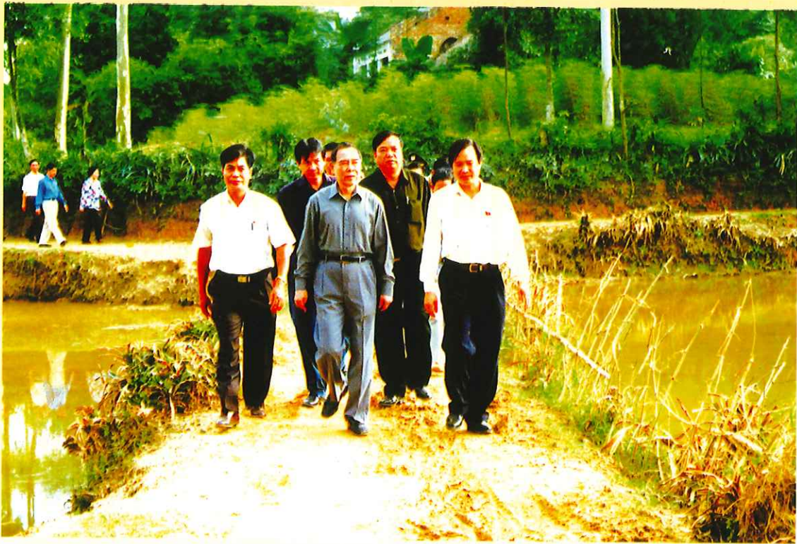
Thủ tướng Phan Văn Khải kiểm tra công tác phòng, chống bão lụt tại huyện Phở Yên - Năm 2001