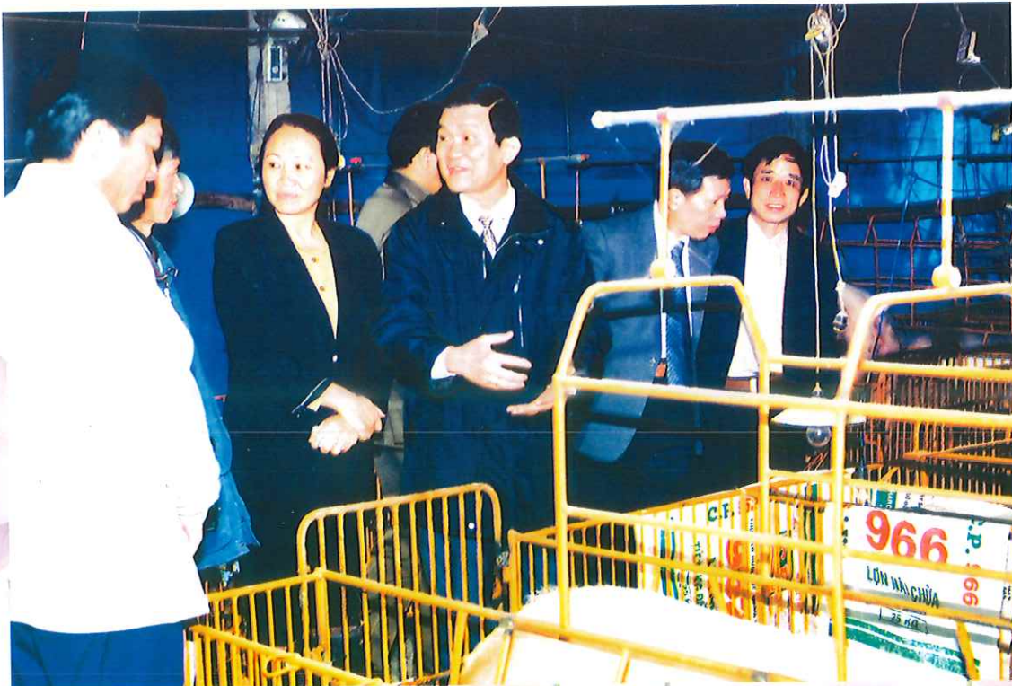
Chủ tịch nước Trương Tấn Sang thăm mô hình trang trại chăn nuôi tại huyện Phở Yên