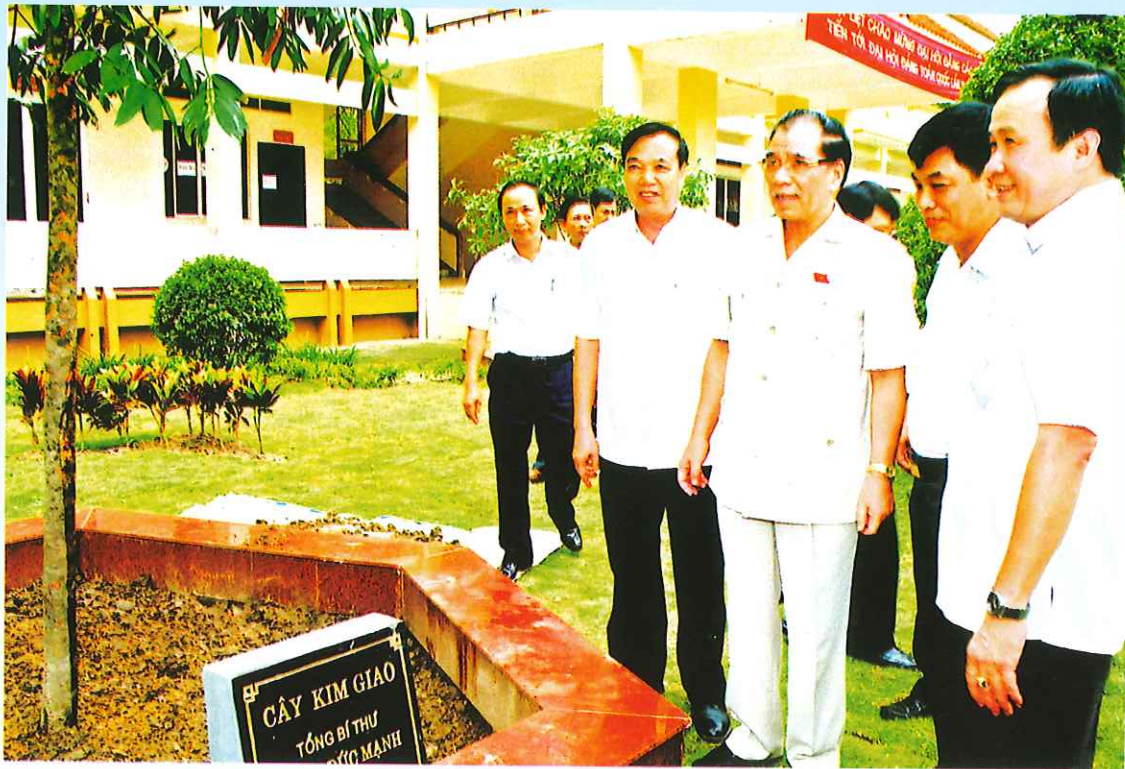
Tổng Bí thư Nông Đức Mạnh trồng cây lưu niệm tại UBND huyện