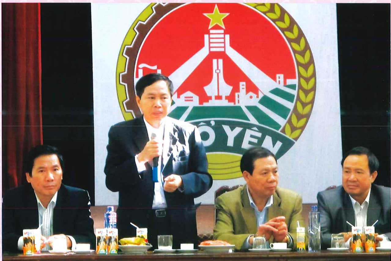
Đ/c Phó Bí thư TT, đ/c Chủ tịch HĐND, đ/c Chủ tịch UBND thăm và làm việc tại huyện Phổ Yên.