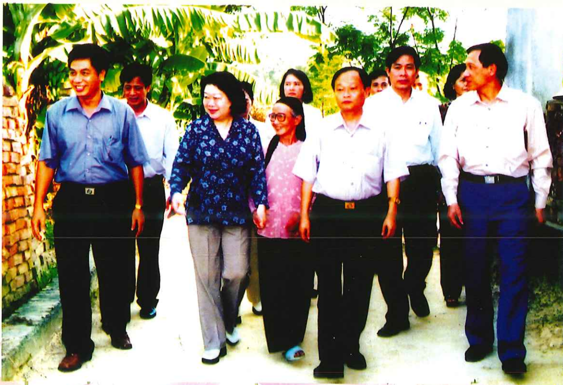
Đồng chí Trương Mỹ Hoa - Ủy viên TW Đảng - Phó Chủ tịch Nước đến thăm và làm việc tại huyện Phở Yên - Tháng 8/2003