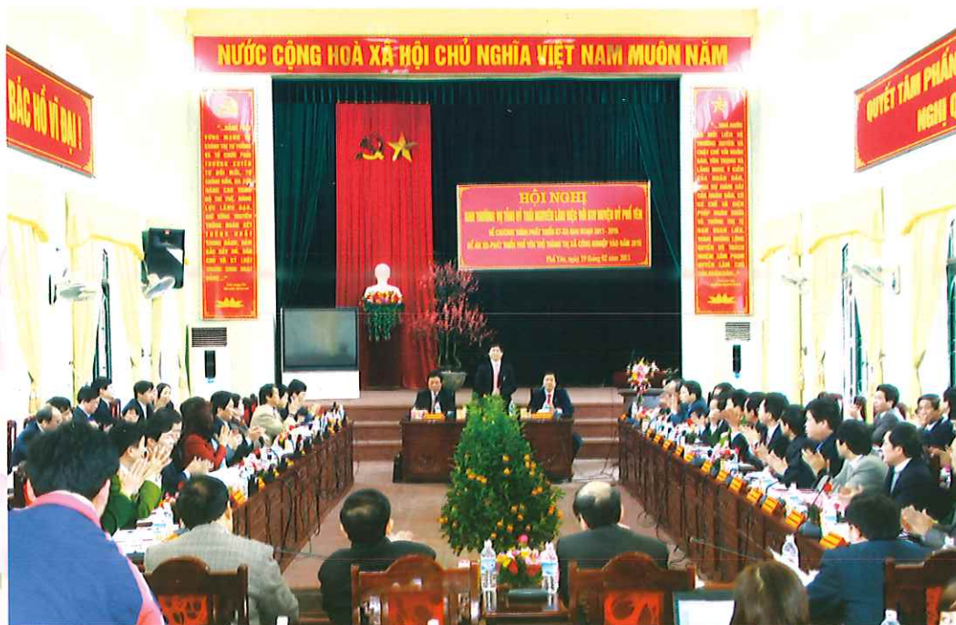
BTV Tỉnh ủy Thái Nguyên làm việc với BTV Huyện ủy Phò Yên về Đề án xây dựng và phát triển Phò Yên trở thành thị xã công nghiệp vào năm 2015

Cụ thể hóa Nghị quyết Đại hội Đảng bộ huyện lần thứ XXVIII, Ban Thường vụ Huyện ủy đã đề nghị và được Ban Thường vụ Tỉnh ủy nhất trí ban hành Nghị quyết 02-NQ/TU ngày 14/3/2011 về xây dựng và phát triển huyện Phò Yên trở thành thị xã công nghiệp vào năm 2015. Thực hiện nghị quyết 02-NQ/TU của Ban Thường vụ Tỉnh ủy, Đảng bộ, chính quyền nhân dân các dân tộc huyện Phò Yên tiếp tục phát huy truyền thống đoàn kết, năng động, sáng tạo đề ra các giải pháp để tổ chức thực hiện, trong đó tiếp tục xác định một trong những giải pháp mang đỉnh đột phá là giải phóng mặt bằng thu hút đầu tư phát triển kinh tế xã hội nhằm chuyển dịch cơ cấu kinh tế.