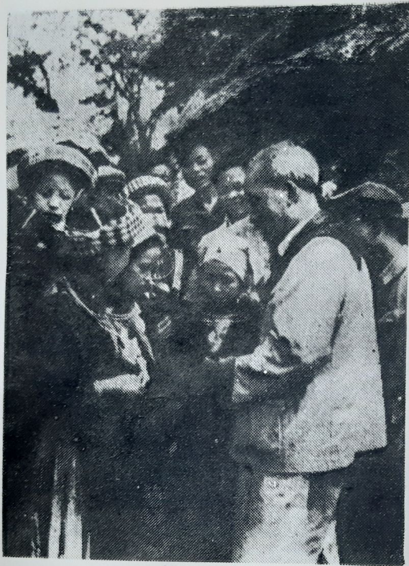
Hồ Chủ tịch thăm trường Thiếu nhi vùng cao ngày 13-3-1960