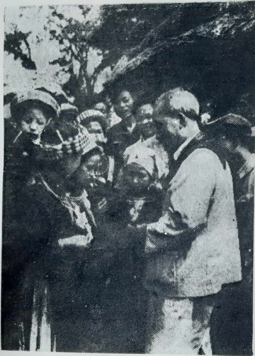
Hồ Chủ tịch thăm trường Thiếu nhi vùng cao ngày 13-3-1960