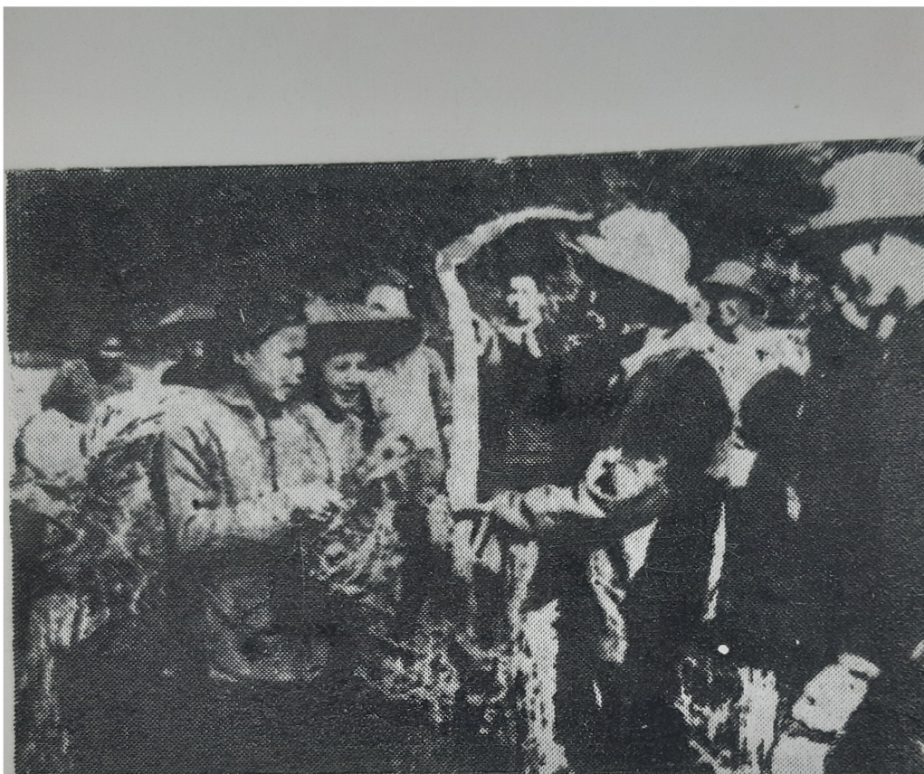
Hồ Chủ tịch nhận quà tặng (củ sắn) của nông dân Chợ Đồn Năm 1951