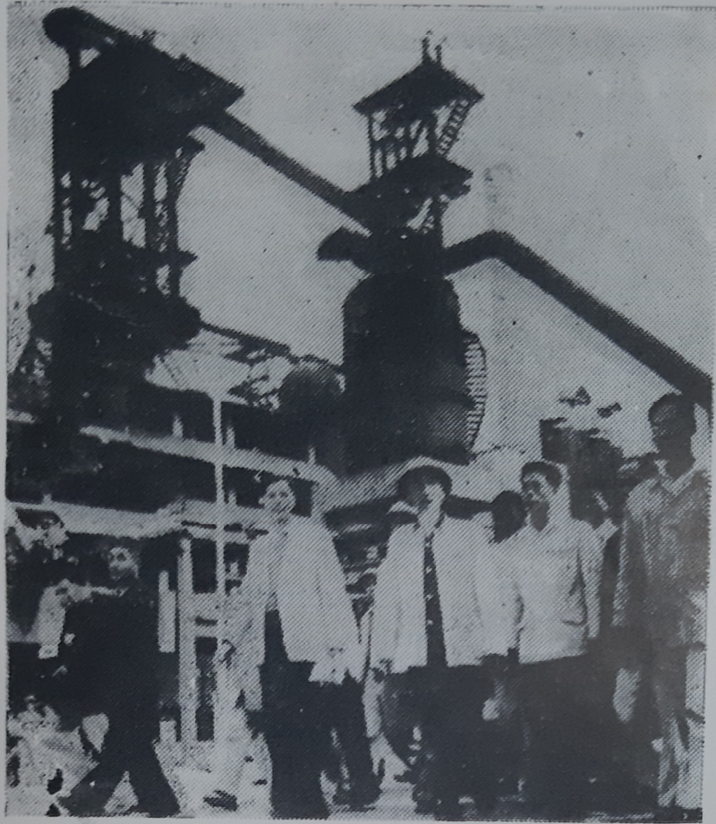
Hồ Chủ tịch xem Lò cao công ty Gang thép Thái Nguyên ngày 1-1-1964