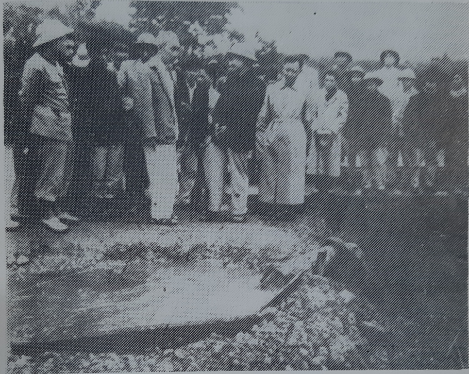
Hồ Chủ tịch xem công trình thủy lợi Lũ Yên (Phú Bình) ngày 2-3-1958