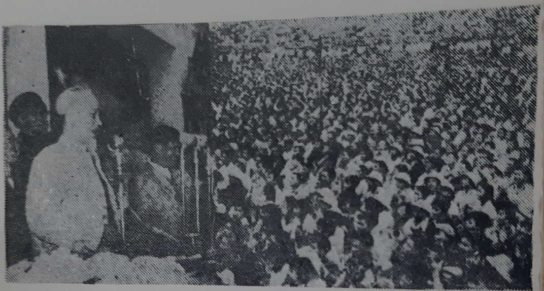
Hồ Chủ tịch nói chuyện với đồng bào Thái Nguyên và công nhân Khu Gang thép ngày 1-1-1964