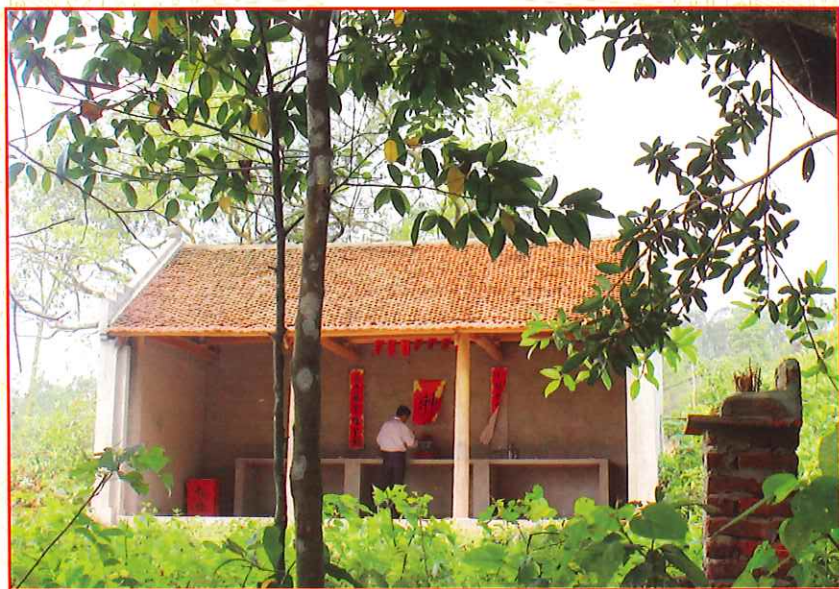
Đình Vực Giảng - nơi thành lập chi bộ Đảng Tân Hòa đầu tiên