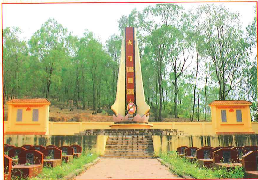
Nghĩa trang liệt sĩ xã