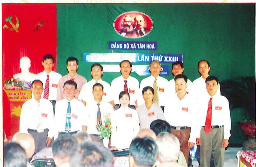
Ban Chấp hành Đảng bộ xã Tân Hòa nhiệm kỳ 2005 - 2010