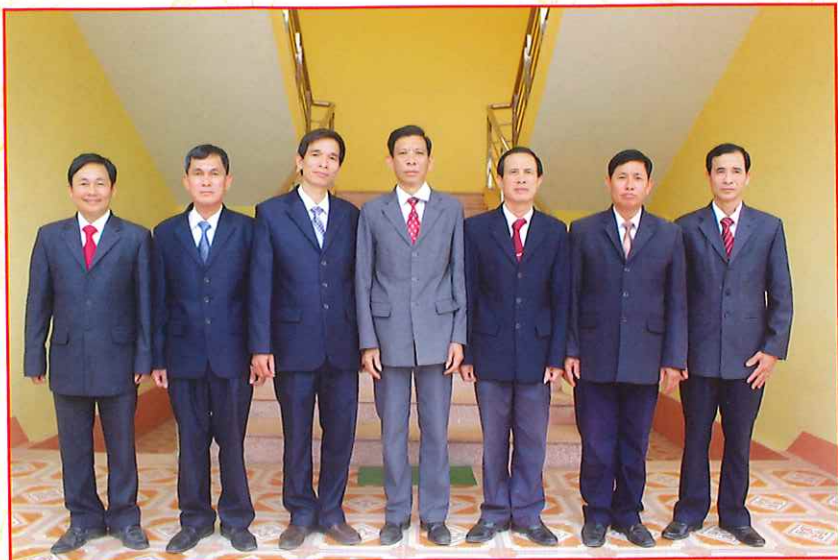
Ban chỉ đạo biên soạn “Lịch sử Đảng bộ xã Tân Hòa (1946 - 2010)”