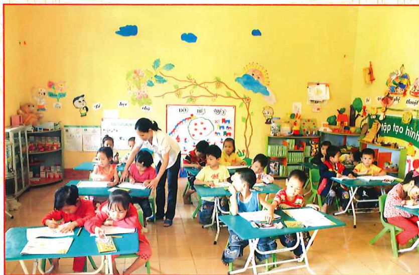
Giờ học vẽ của các cháu mẫu giáo Trường Mầm non xã Tân Hòa