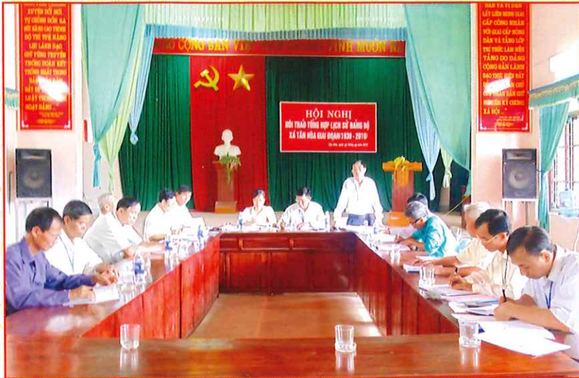
Hội nghị hội thảo tổng hợp “ Lịch sử Đảng bộ xã Tân Hòa (1946 - 2010) ”