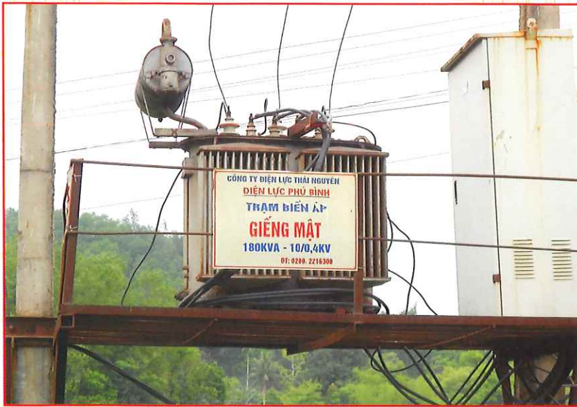
Trạm biến áp Giếng Mật trên địa bàn xã