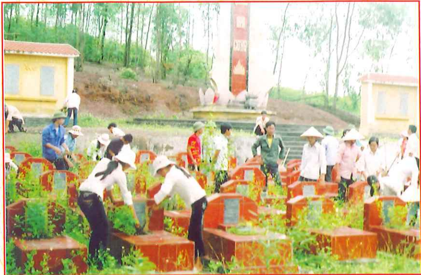
Đoàn Thanh niên xã Tân Hòa tham gia lao động dọn dẹp Nghĩa trang liệt sĩ xã