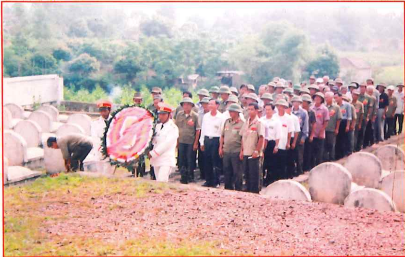
Hội Cựu chiến binh viếng liệt sĩ xã nhân kỷ niệm ngày thương binh liệt sĩ 27/7