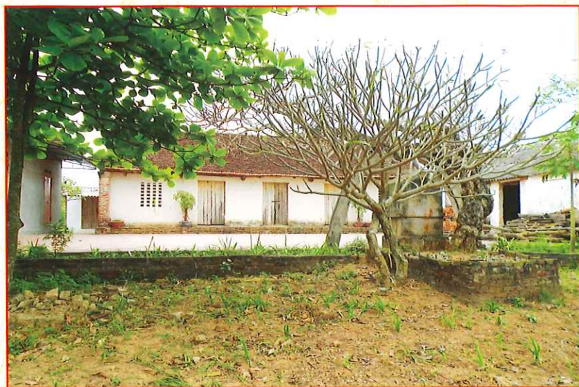
Đình làng U