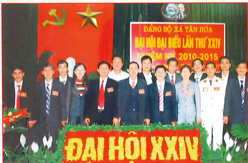
Ban Chấp hành Đảng bộ xã Tân Hòa nhiệm kỳ 2010 - 2015