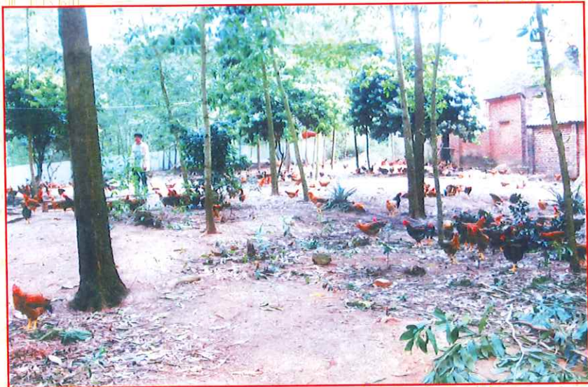
Mô hình chăn nuôi gà đồi của hội viên nông dân xã Tân Hòa