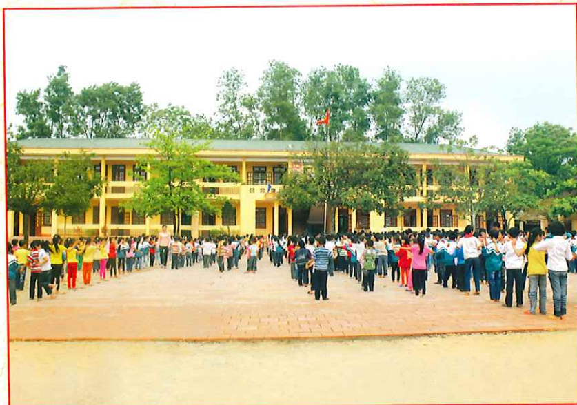
Trường Tiểu học Tân Hòa