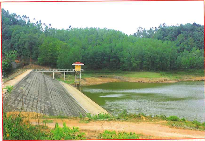
Đập Trại Gạo