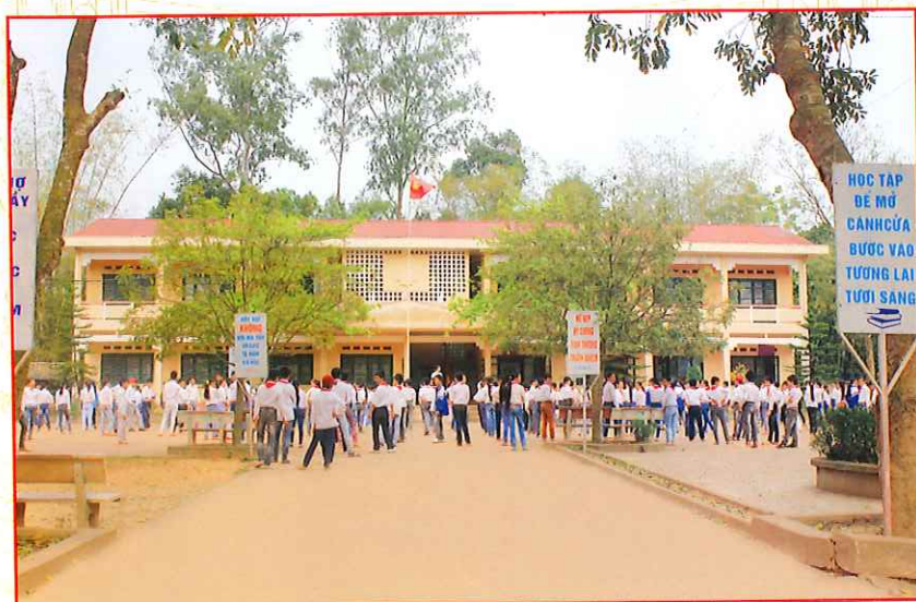
Trường Trung học cơ sở Tân Hòa