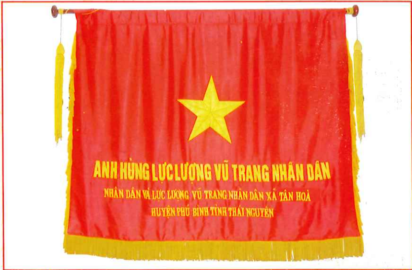
Cờ Anh hùng lực lượng vũ trang nhân dân xã Tân Hòa