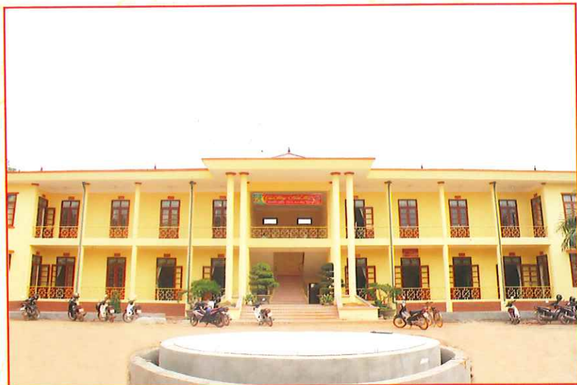
Trụ sở Đảng ủy - HĐND - UBND xã