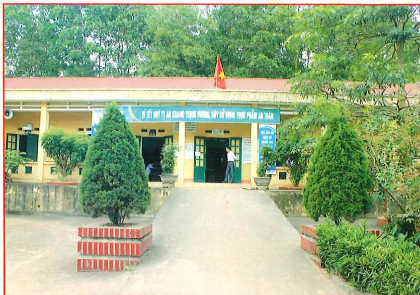
Trạm y tế xã