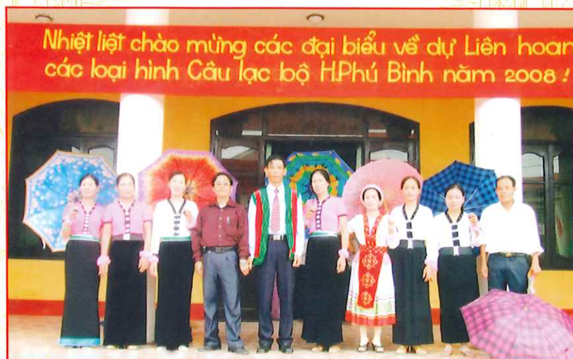
Đội văn nghệ xã Tân Hòa tham gia Liên hoan các loại hình Câu lạc bộ huyện Phú Bình (năm 2008)