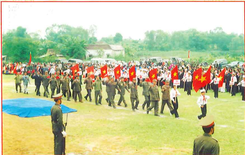
Lễ đón nhận danh hiệu Anh hùng lực lượng vũ trang nhân dân xã Tân Hòa (năm 2005)