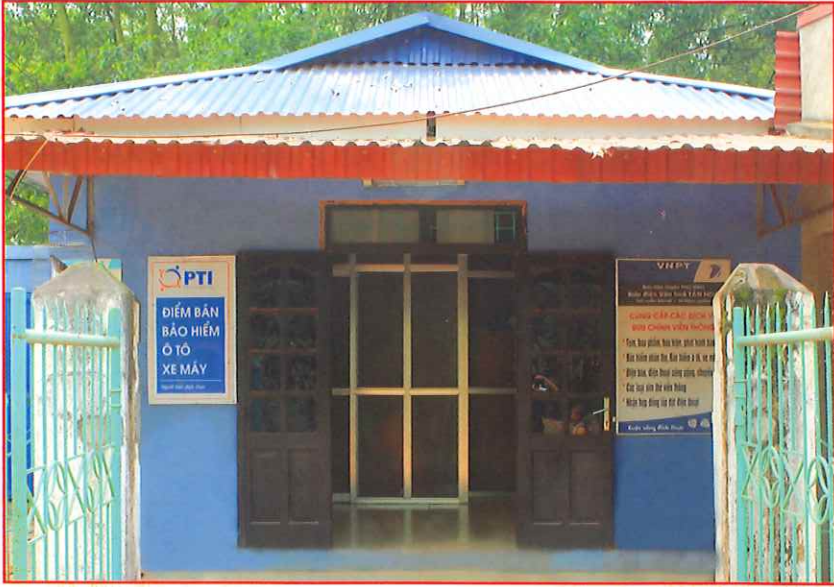
Bưu điện văn hóa xã