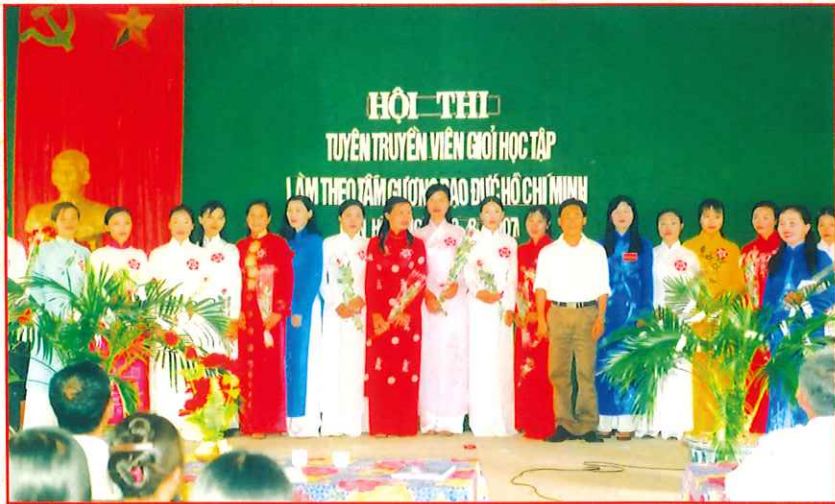
Hội Phụ nữ xã Tân Hòa trong Hội thi "Tuyển truyền viên giỏi học tập làm theo tấm gương đạo đức Hồ Chí Minh"