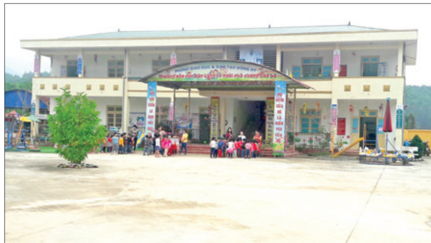
Trường Mầm non xã Văn Lăng (năm 2018).