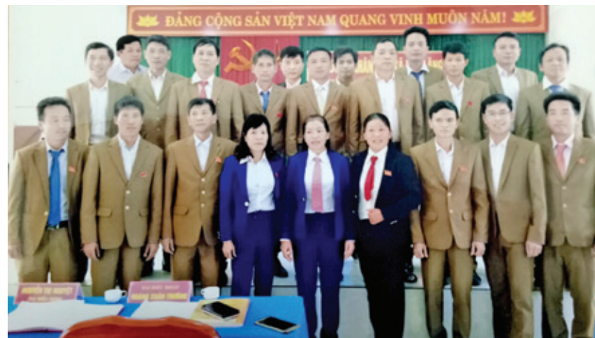
Các đại biểu Hội đồng nhân dân xã khóa XIX chụp ảnh lưu niệm năm 2018.