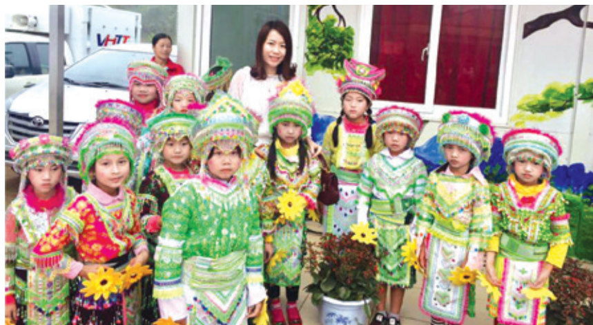
Học sinh người Mông trên điểm trường Bản Tèn trong ngày Hội Văn hóa-Thể thao dân tộc Mông năm 2018.