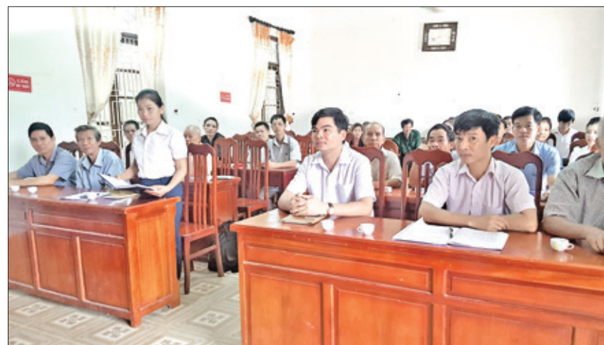
Hội nghị triển khai công tác sưu tầm và biên soạn Lịch sử Đảng bộ xã Văn Lăng Ảnh chụp ngày 15/9/2017.