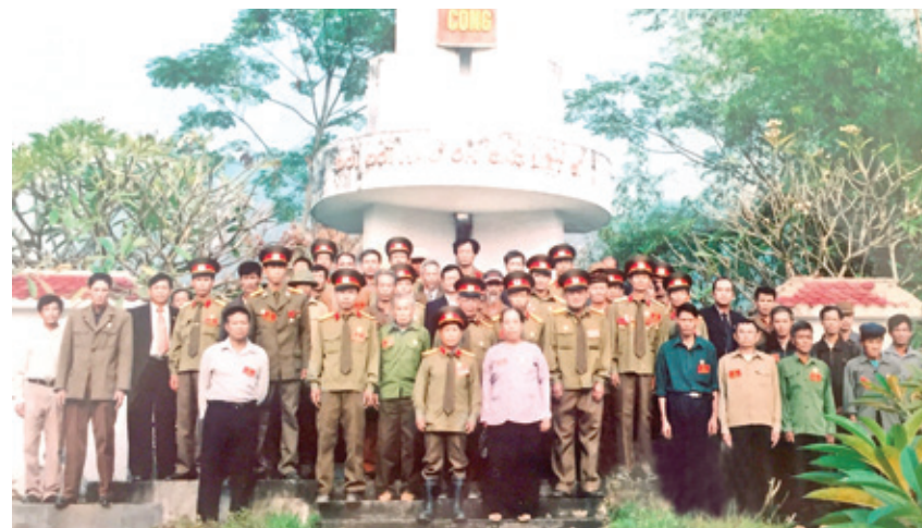
Các đại biểu dự Đại hội Hội Chiến binh xã, nhiệm kỳ 2012 - 2017 Đền viếng và chụp ảnh lưu niệm bên Đài tưởng niệm liệt sỹ xã Văn Lăng.