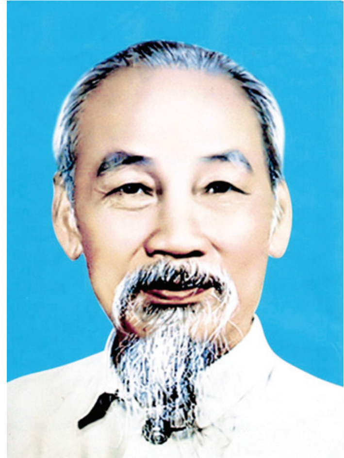
CHỦ TỊCH HỒ CHÍ MINH (1890 - 1969)

“Dân ta phải biết sử ta Cho tường gốc tích nước nhà Việt Nam”