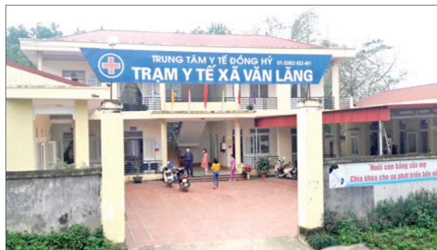
Trạm Y tế xã Văn Lăng, năm 2018.