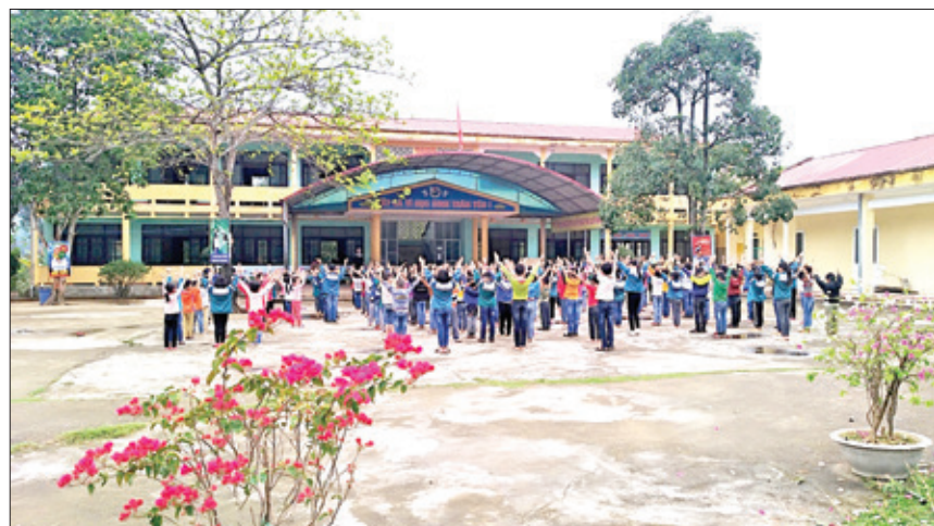
Giờ thể dục của học sinh Trường Phổ thông dân tộc bán trú Tiểu học số 1 Văn Lăng (năm 2018).