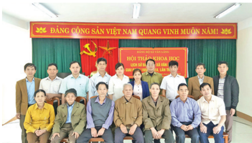
Các đại biểu dự Hội thảo khoa học Lịch sử Đảng bộ xã Văn Lăng (1958 - 2018), ngày 4/4/2019.