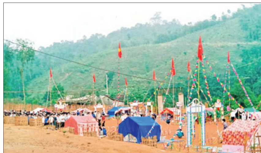
Hội trại thanh niên hè năm 2006.