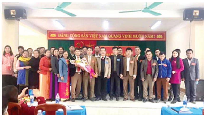
Ủy viên UBMT Tổ quốc xã nhiệm kỳ 2017 - 2022 ra mắt đại hội.