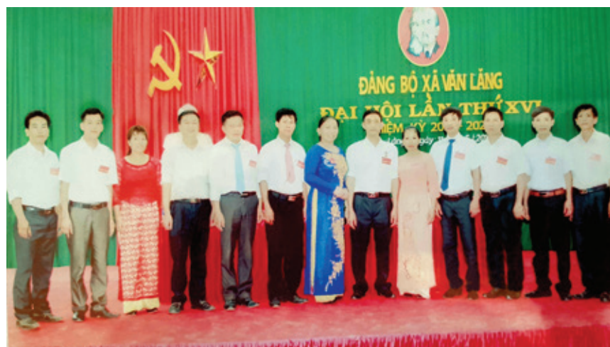
Ban Chấp hành Đảng bộ xã khóa XVI ra mắt Đại hội.