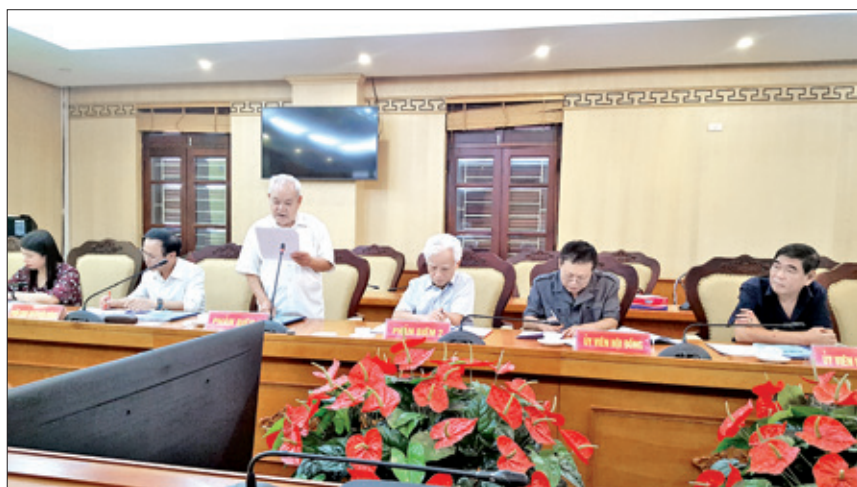
Hội đồng Khoa học Lịch sử Đảng bộ tỉnh thẩm định cuốn sách Lịch sử Đảng bộ xã Văn Lăng (1958 – 2018) ngày 10/5/2019.