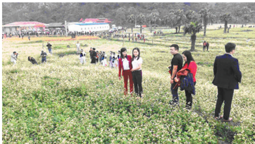
Hoa Tam giác mạch khoe sắc trong Ngày hội Văn hóa-Thể thao dân tộc Mông 2018.