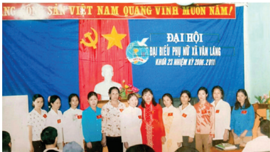
Ban chấp hành Hội Liên hiệp phụ nữ xã nhiệm kỳ 2006 - 2011 ra mắt đại hội.