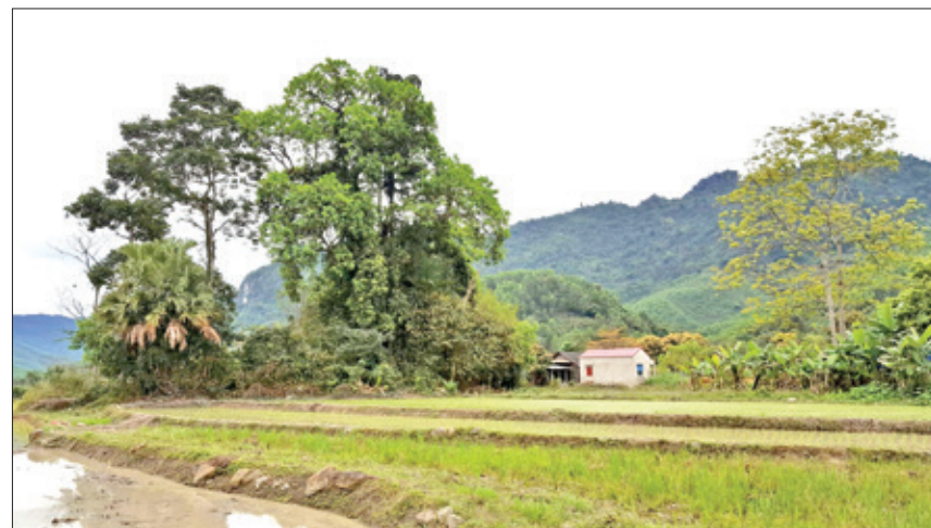
Dấu tích đình Nà Ung năm 2018 (ở xóm Văn Khánh, nay chỉ còn lại lùm cây nhội)