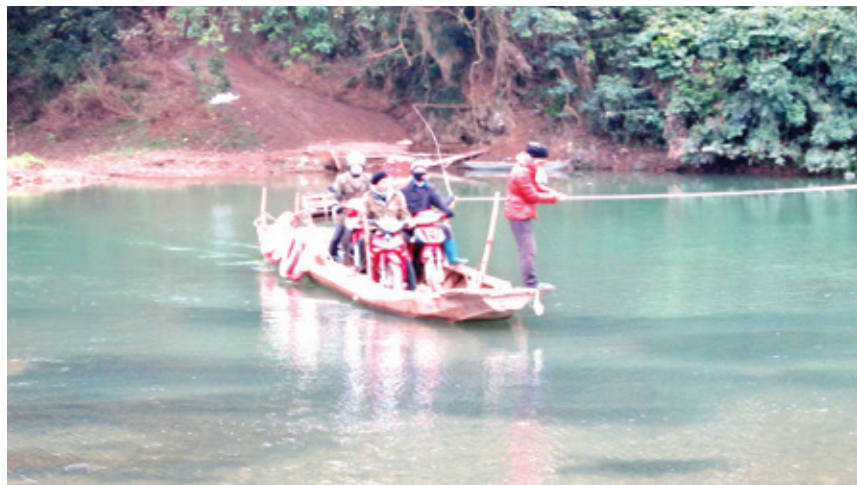
Bến đò Vịt khi sửa chữa cầu năm 2012 (nay không còn và đã thay bằng cầu treo Văn Lăng).