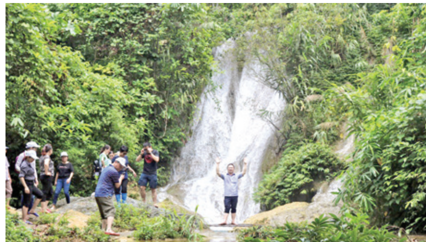
Quang cảnh Thác Tiên (năm 2018)