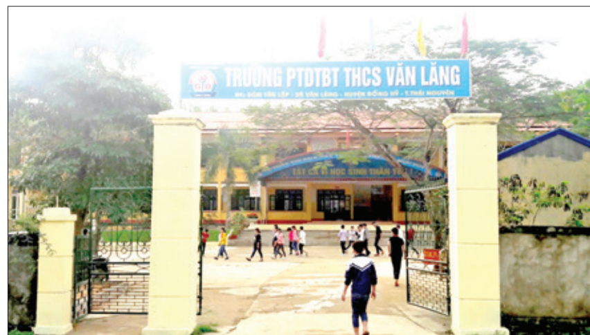
Trường Phổ thông dân tộc bán trú THCS Văn Lăng (năm 2018).