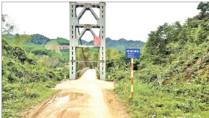
Cầu treo Tam Va, nối con đường từ trung tâm xã lên Bản Tèn (năm 2018).