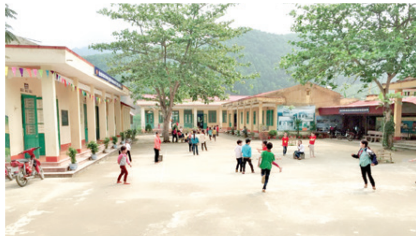
Trường Tiểu học số 2 Văn Lăng (năm 2018).