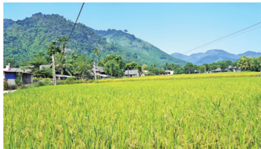
Mùa lúa chín ở Văn Lăng (năm 2018)