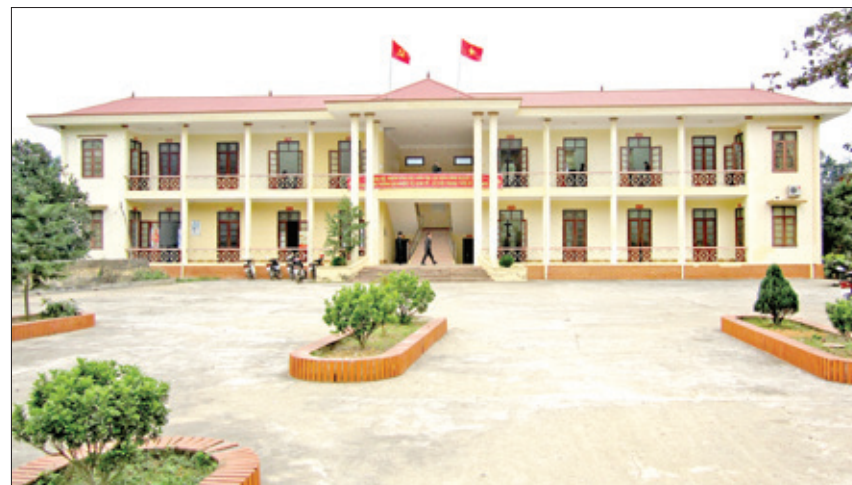
Trụ sở Đảng ủy-Hội đồng nhân dân-Ủy ban nhân dân xã Văn Lăng, năm 2016.