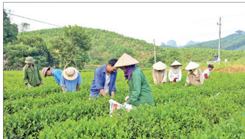
Thu hoạch chè ở xóm Tân Lập 1.