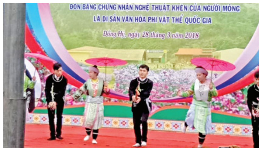
Điệu Múa Khèn trong Ngày hội Văn hóa - Thể thao dân tộc Mông năm 2018.