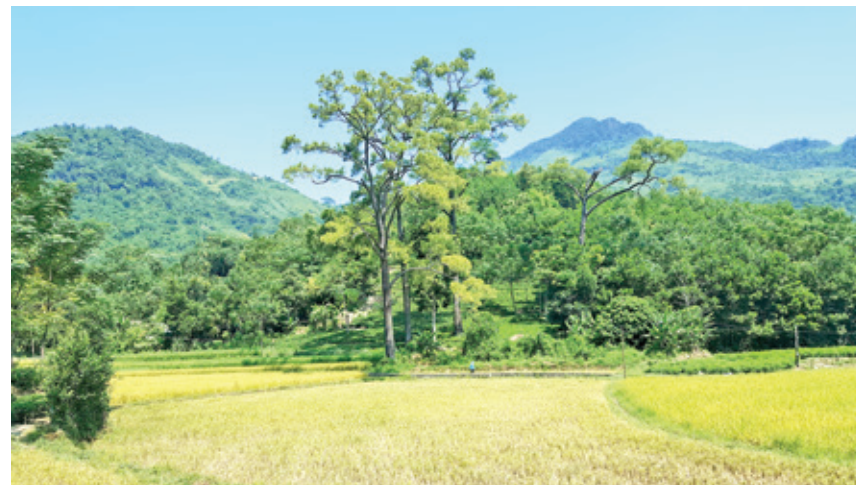
Dấu tích đình Nà Ôn (tức đình Văn Lăng) năm 2018, chỉ còn lại 5 cây thông.