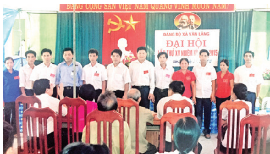
Ban Chấp hành Đảng bộ xã khóa XV ra mắt Đại hội.