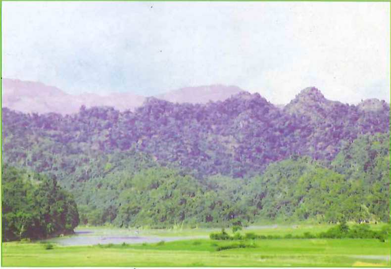
Hồ Pé Vài - xã Khang Ninh