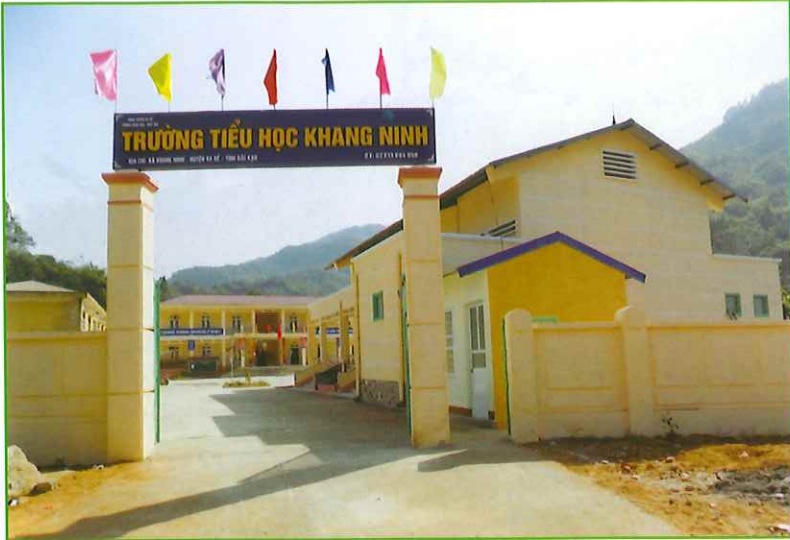
100 Trường Tiểu học Khang Ninh 101