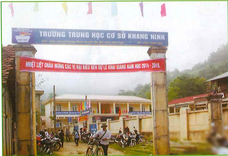
102 Trường THCS Khang Ninh 103