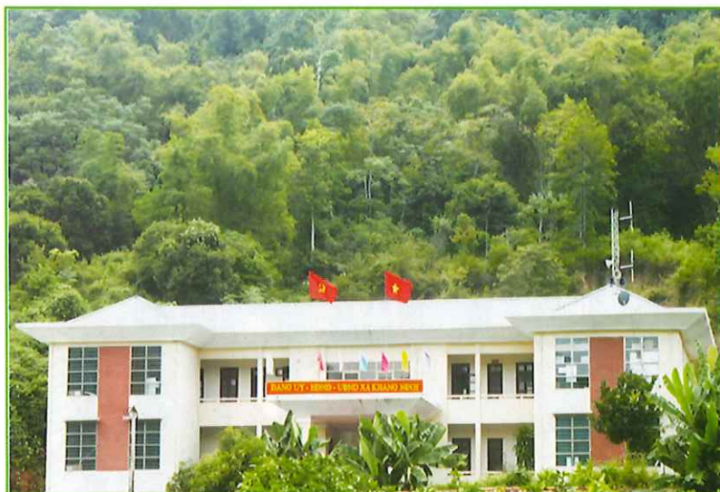
Trụ sở Đảng ủy, Hội đồng nhân dân, Ủy ban nhân dân xã Khang Ninh