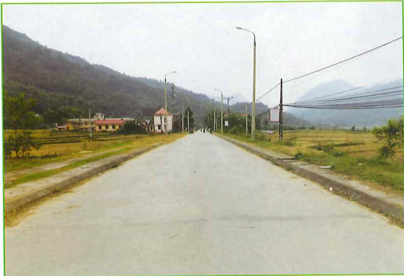
Trục đường giao thông xã Khang Ninh