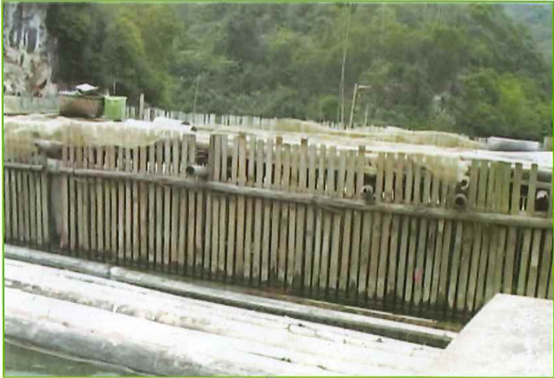
Mô hình nuôi cá lồng ở xã Khang Ninh