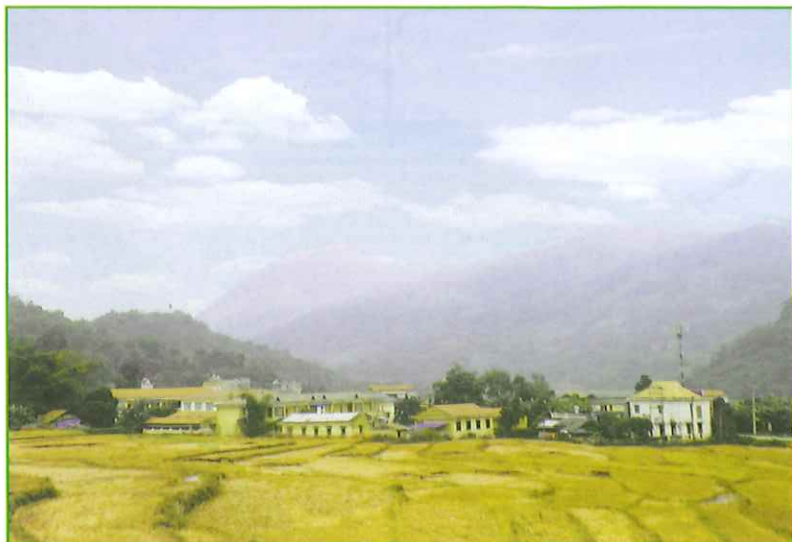
Khu dân cư xã Khang Ninh