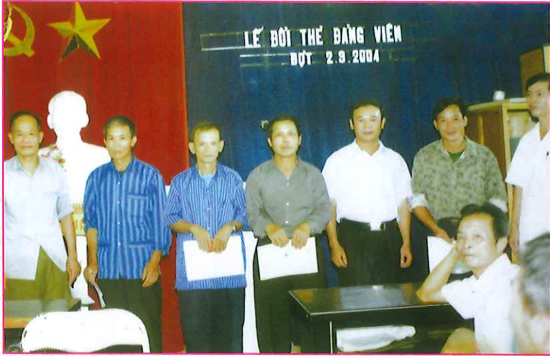
Lễ đổi thẻ đảng viên năm 2004