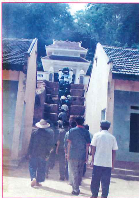
Cán bộ, đảng viên xã Đông Viên dâng hương tại Đài Tưởng niệm liệt sỹ