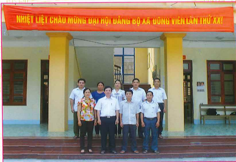
Ban Chấp hành Đảng bộ xã Đông Viên (nhiệm kỳ 2010-2015)