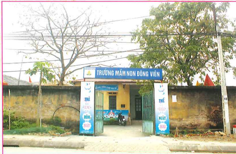
Trường Mầm non xã Đông Viên