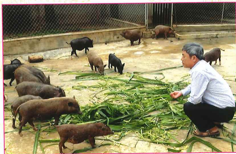
Mô hình chăn nuôi lợn rừng xã Đông Viên