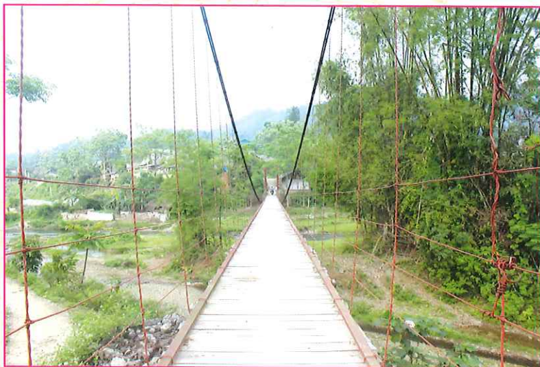
Cầu treo Nà Vần xã Đông Viên