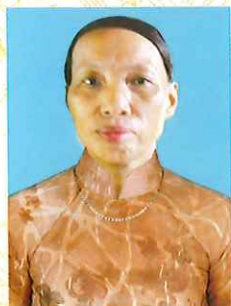
Nguyễn Thị Bình