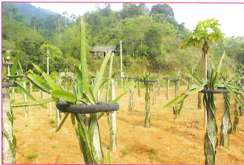
Mô hình trồng Thanh Long xã Đông Viên