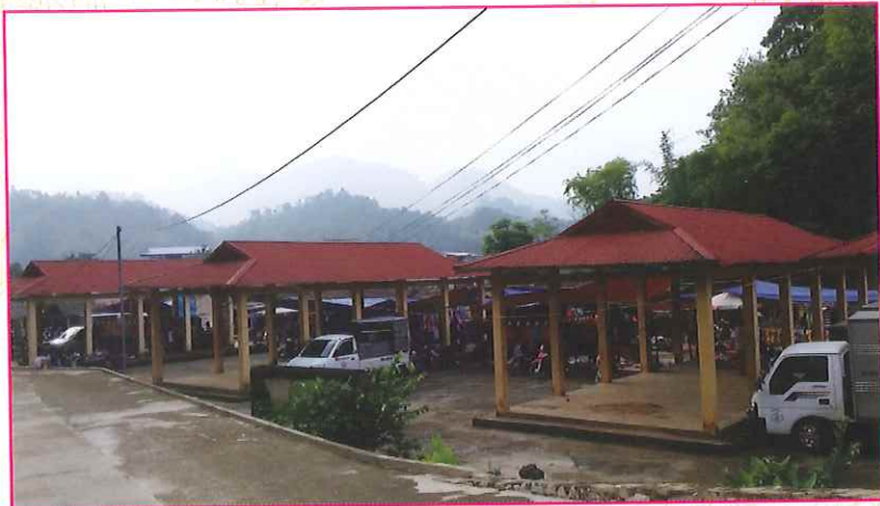
Một góc chợ xã Đông Viên