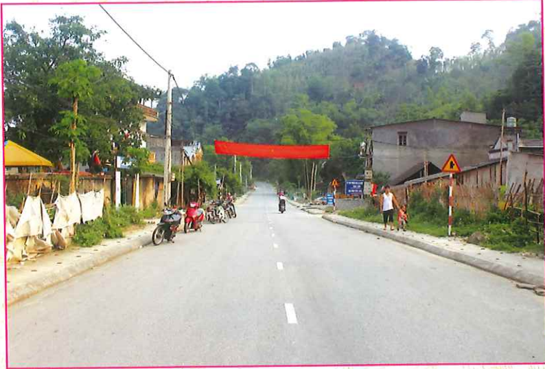
Một góc làng quê xã Đông Viên