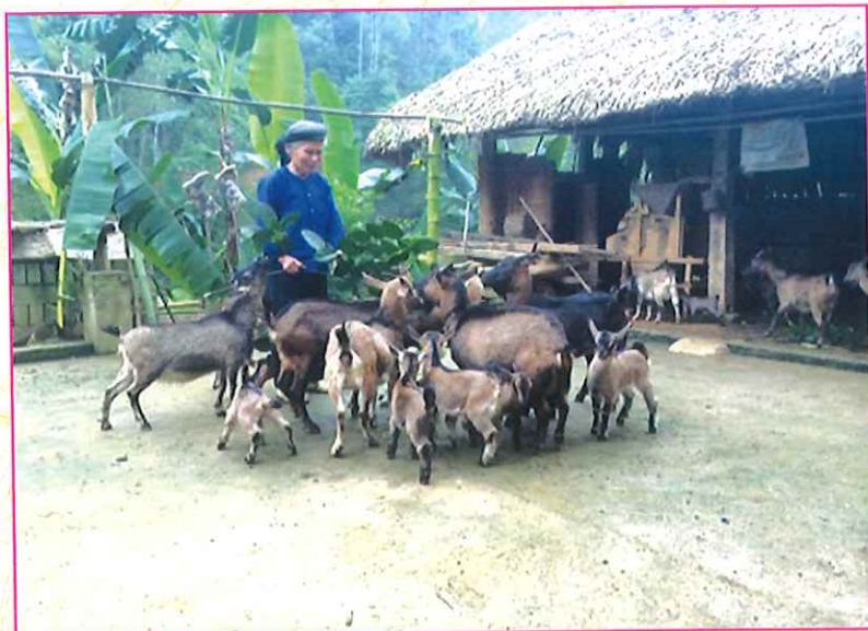
Mô hình nuôi dê xã Đông Viên