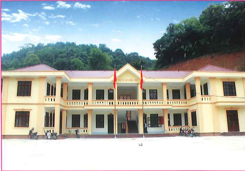
Trụ sở Đảng ủy - HĐND - UBND xã Đông Viên