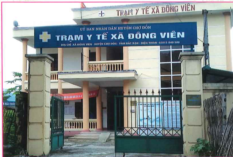
Trạm Y tế xã Đông Viên