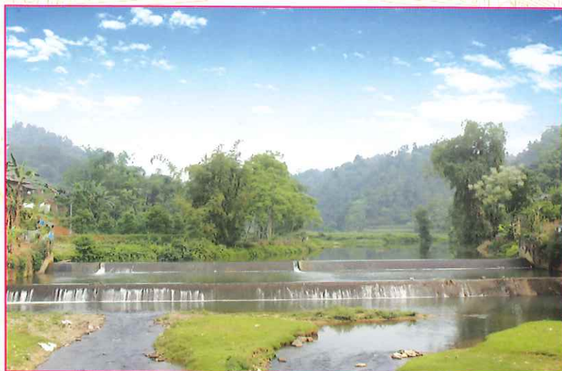
Đập thủy lợi phục vụ cho sản xuất nông nghiệp ở xã Đông Viên