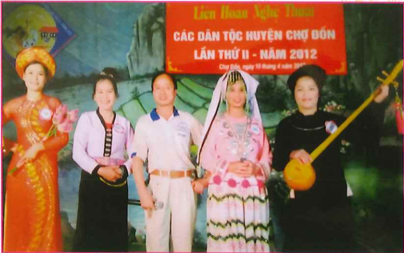
Đội văn nghệ xã Đông Viên tham gia liên hoan nghệ thuật các dân tộc huyện Chợ Đồn lần thứ II - năm 2012