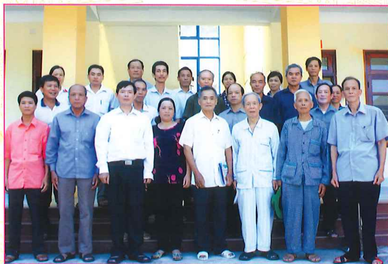
Các đại biểu tham dự hội thảo khoa học “Lịch sử Đảng bộ xã Đông Viên (1947-2014)” chụp ảnh lưu niệm