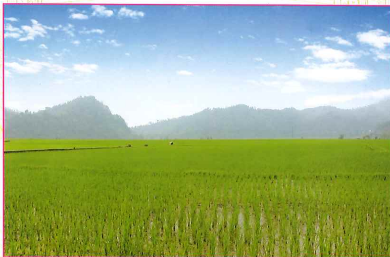
Cánh đồng lúa xuân xã Đông Viên