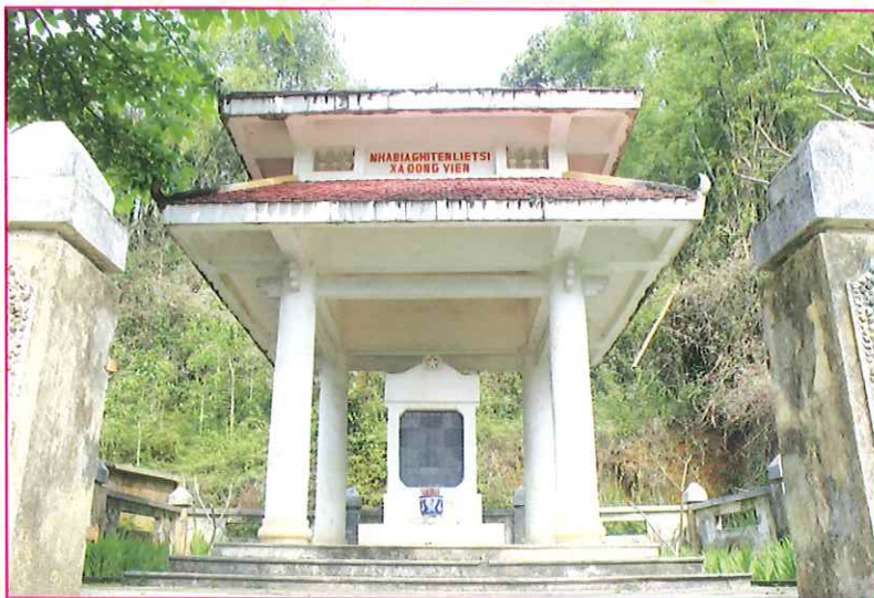
Nhà bia Tưởng niệm Liệt sỹ xã Đông Viên