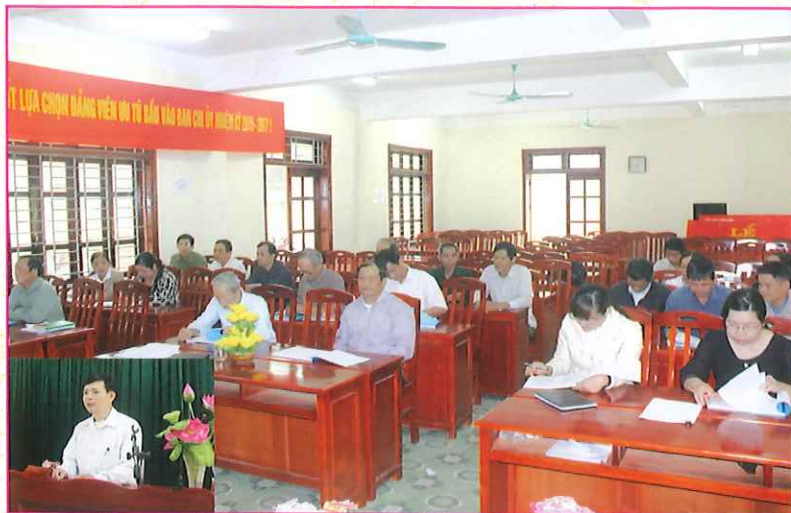
Hội thảo khoa học “Lịch sử Đảng bộ xã Đông Viên (1947-2014)”