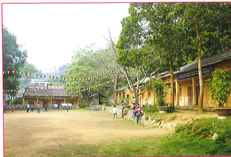
Trường Trung học cơ sở xã Đông Viên