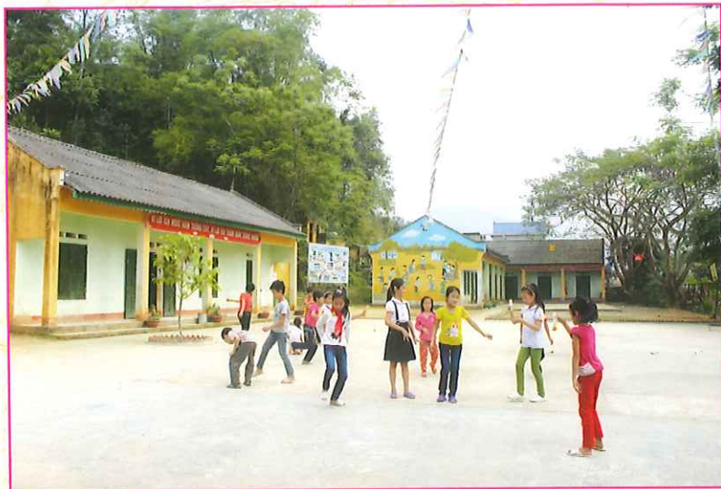
Trường Tiểu học xã Đông Viên