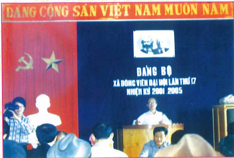
Đại hội Đảng bộ xã Đông Viên lần thứ XVII (nhiệm kỳ 2001-2005)