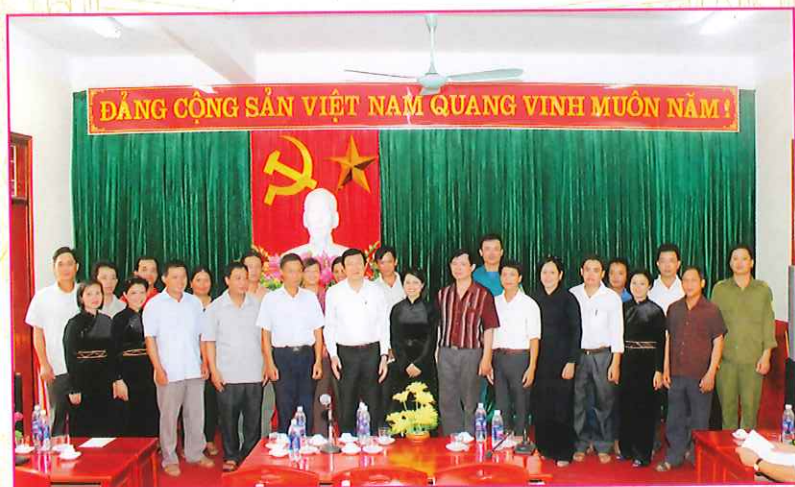
Cán bộ, công nhân viên chức xã Đông Viên chụp ảnh lưu niệm với Chủ tịch nước Trương Tấn Sang trong chuyến thăm và làm việc tại Bắc Kạn ngày 7-8/7/2015