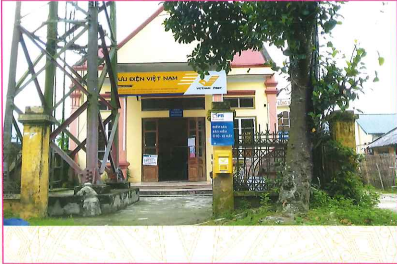
Bưu điện Văn hóa xã Đông Viên